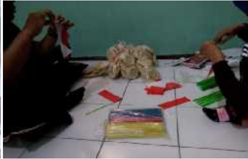
Persiapan Hut RI