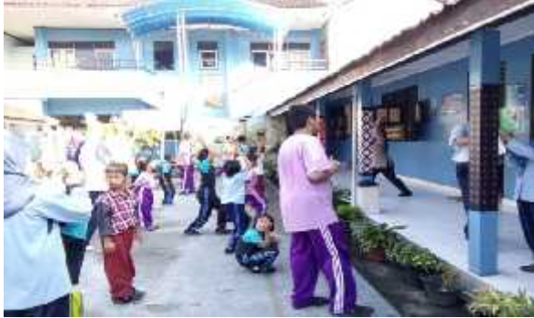
Kegiatan Senam Pagi