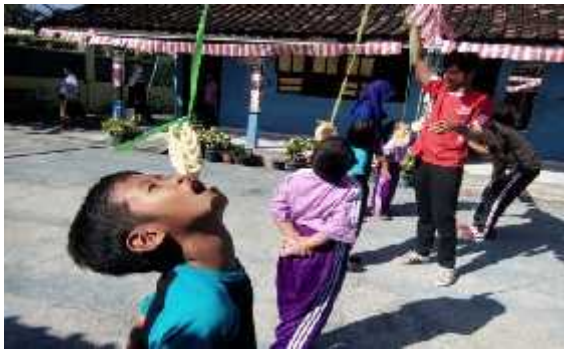
Lomba Memperingati HUT RI