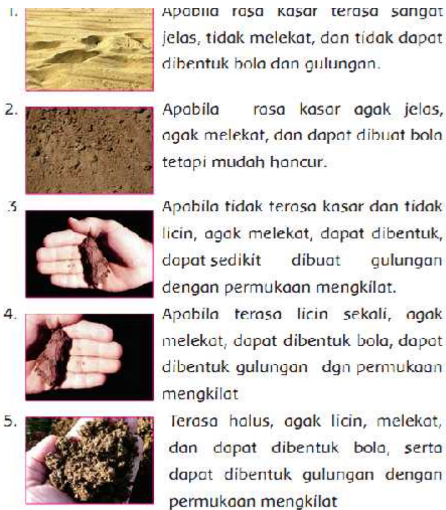
Gbr 1.14. tekstur tanah