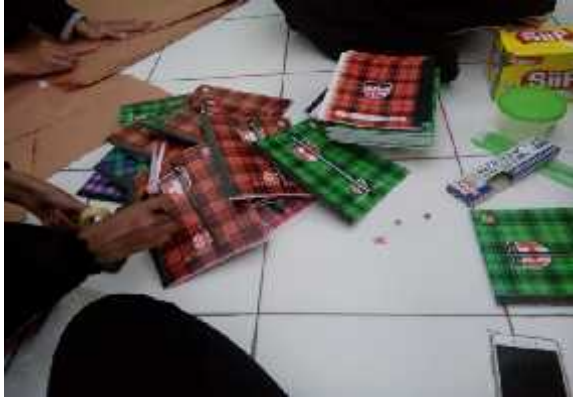
Pembungkusan hadiah Lomba