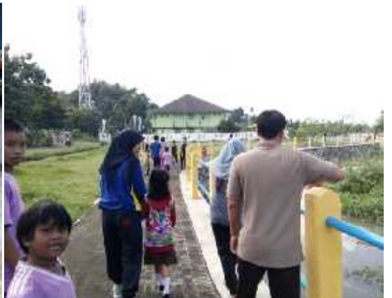
Jalan-jalan memutari embung