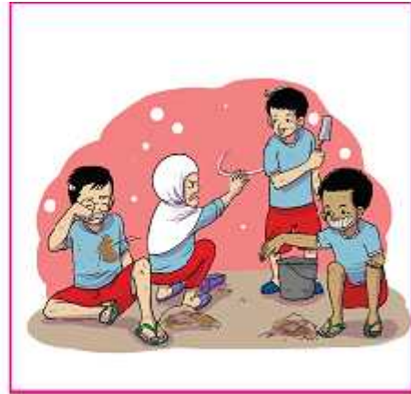
gambar 1.7. pengamalan sila ketiga