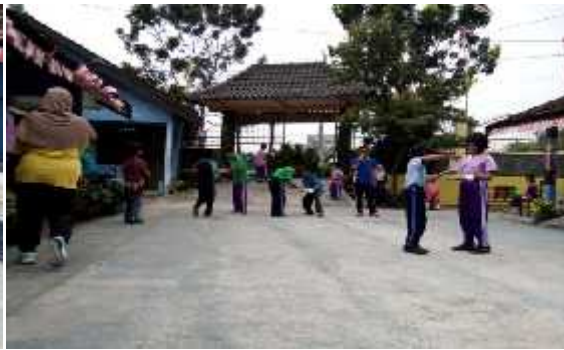
Lomba peringatan HUT RI