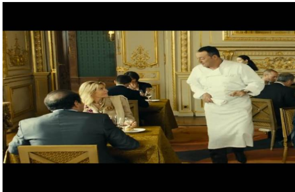
Gambar adegan 7. Seorang wanita memuji masakan M. Lagarde

Berikut ini merupakan salah satu contoh tindak tutur ekspresif yang berfungsi untuk menyatakan simpati.