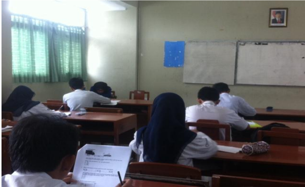
(Gambar 1. Tes Penjurusan)