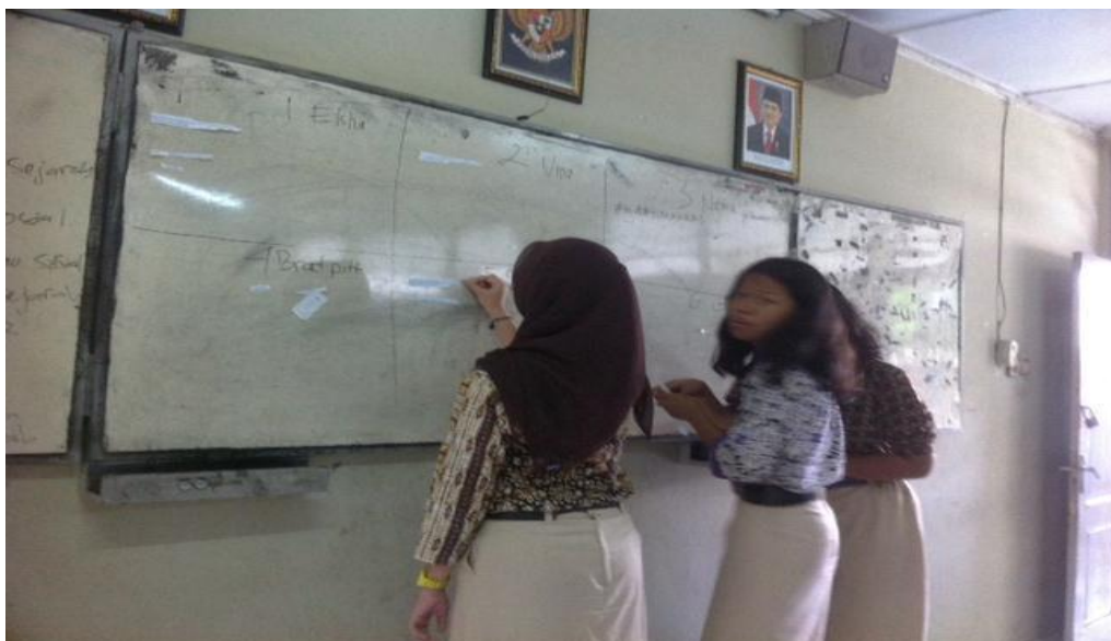
(Gambar 3. Penempelan Kata Saat Estafet Kata)