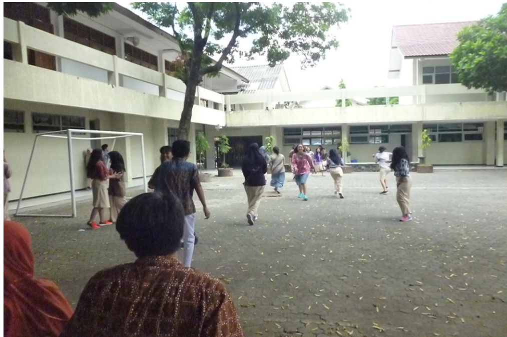
(Gambar1. Suasana Estafet Kata)