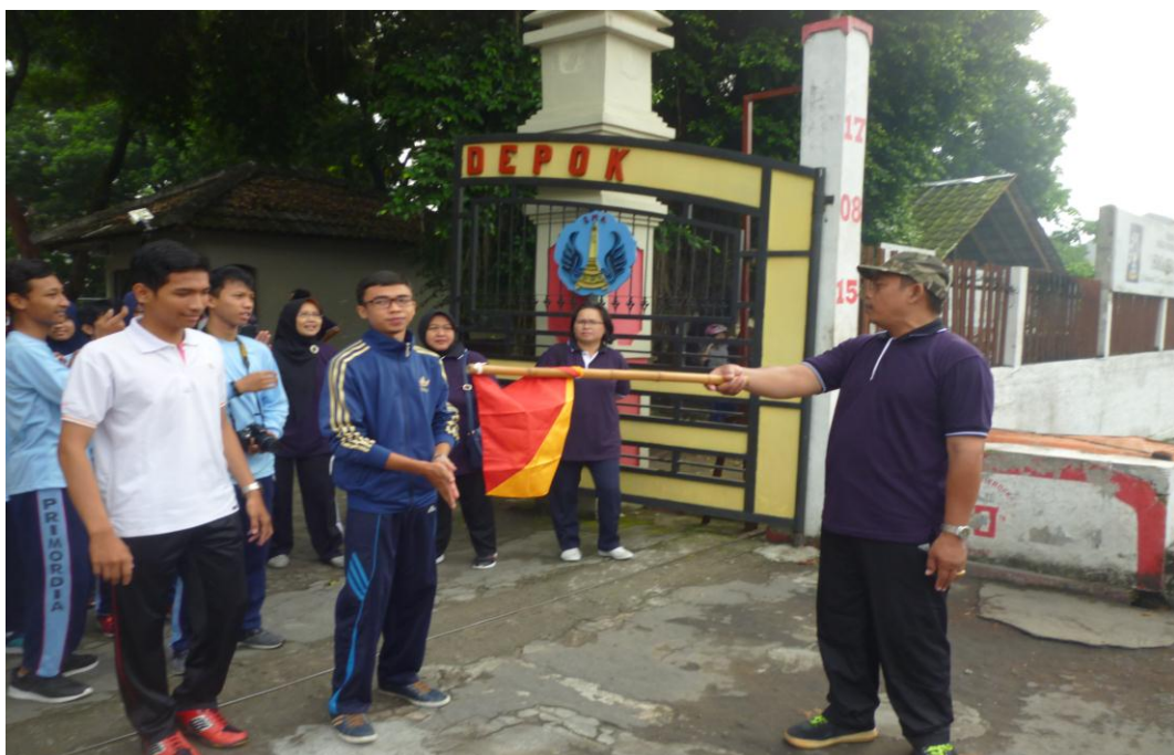
(Gambar 6. Jalan Sehat Hari Olahraga Nasional)