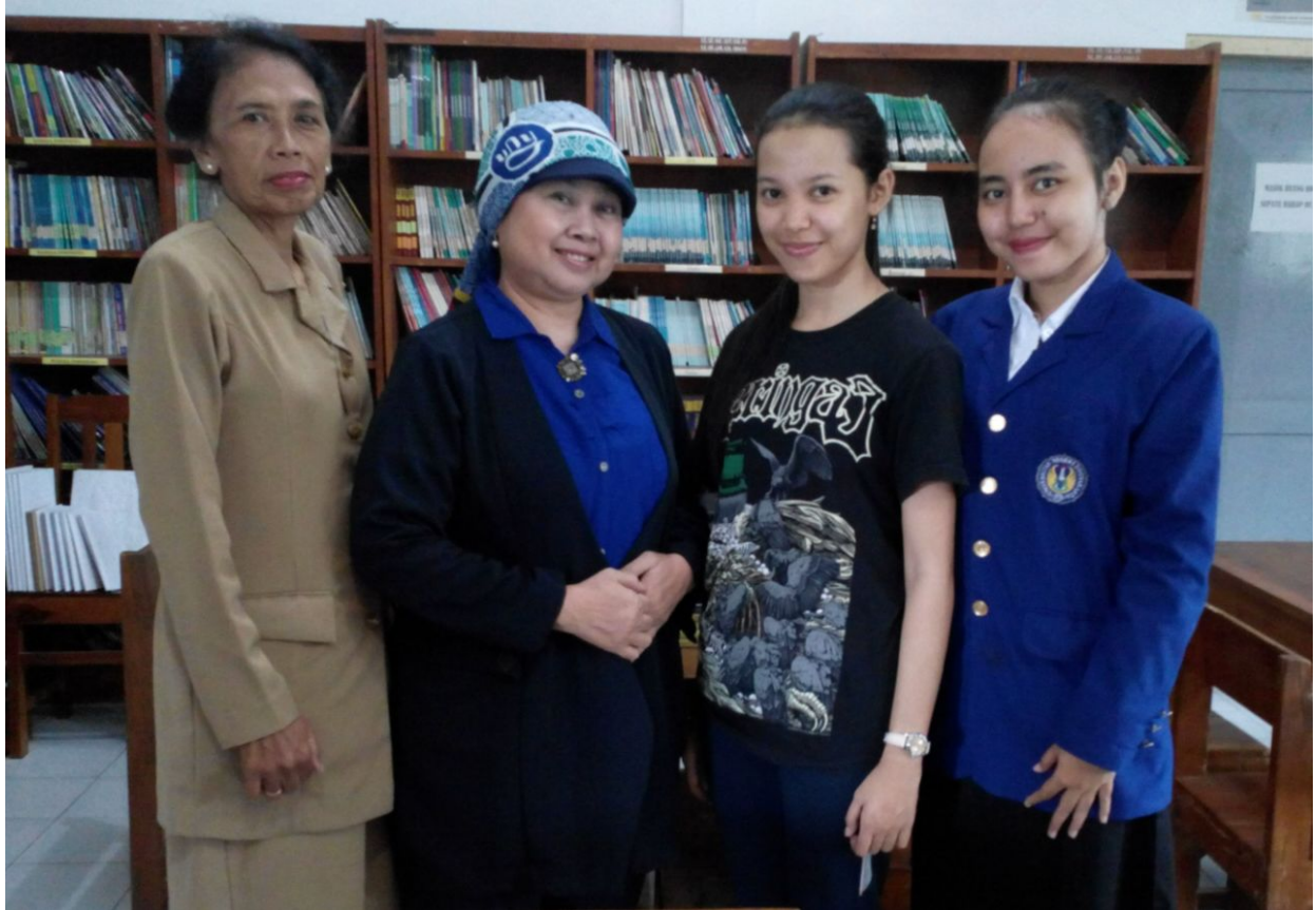
Mahasiswa PPL dan Para Guru SMP N 1 Turi