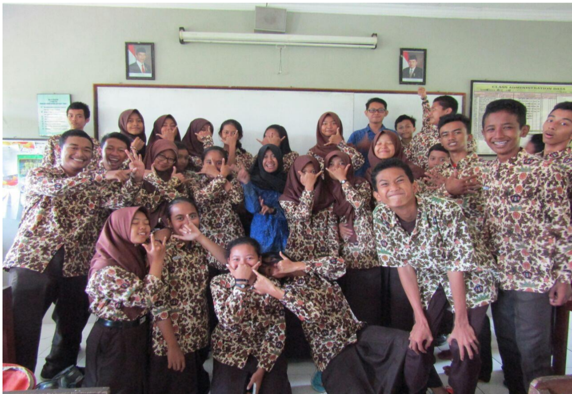
12. Foto Bersama X MIPA 1