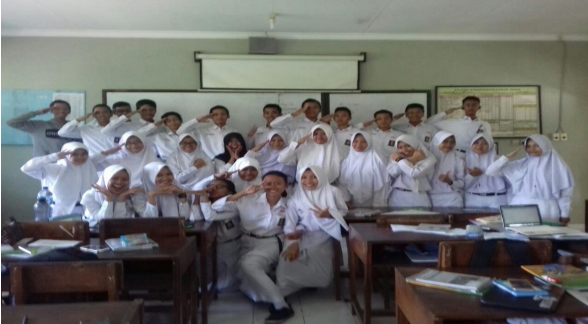
13. Foto Bersama X MIPA 2

Jalan Bogem, Tamanmartani, Kalasan, Sleman, DI Yogyakarta