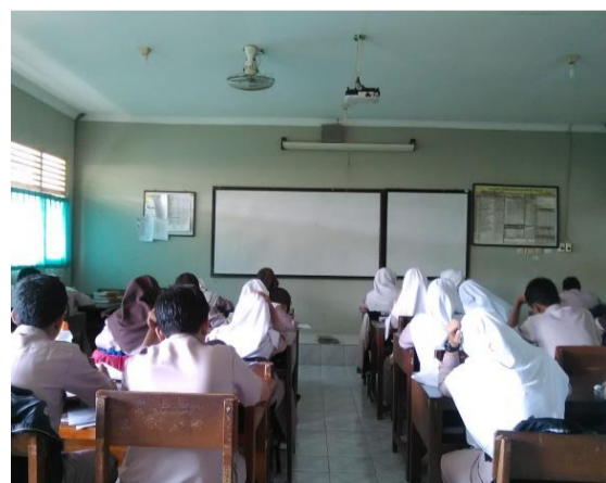
6. Foto Saat Ulangan