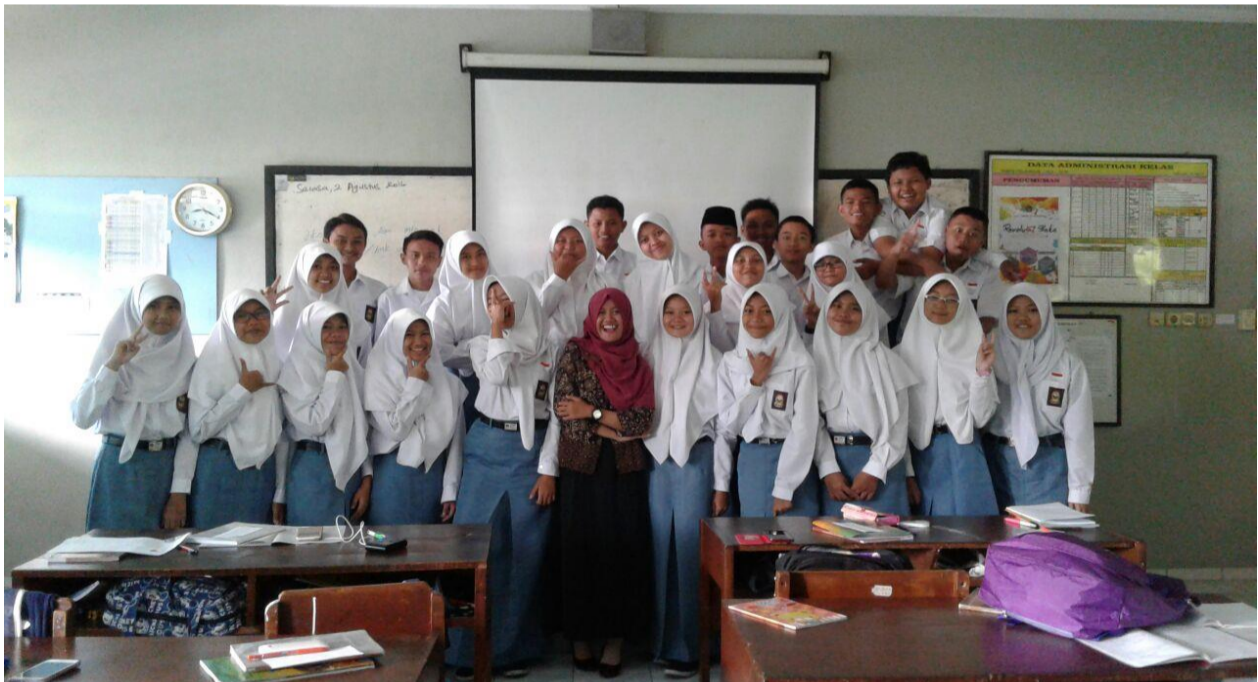
14. Foto Bersama X MIPA 4