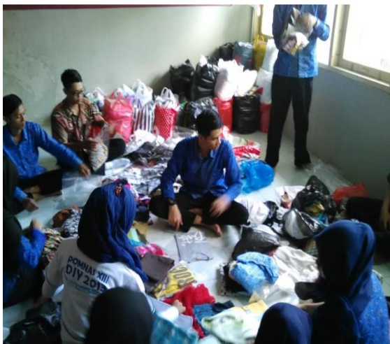
3. Foto Ngepak Pakaian Bakti Sosial