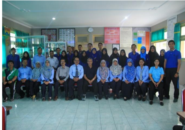
2. Foto Bersama Guru Pembimbing PPL