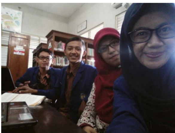
5. Foto Jaga Perpustakaan