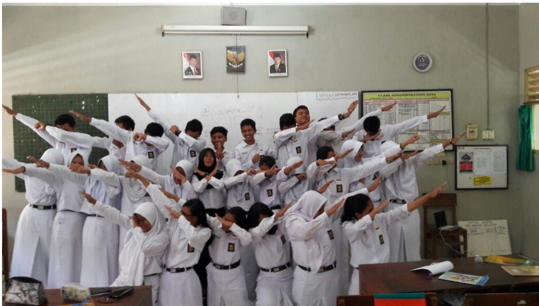
10. Foto Bersama X IPS 1