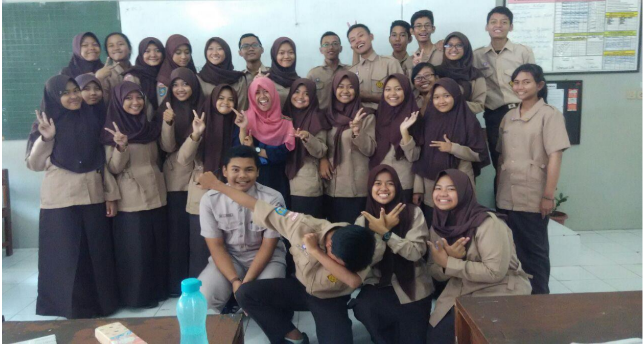
15. Foto Bersama X IPS 2

Jalan Bogem, Tamanmartani, Kalasan, Sleman, DI Yogyakarta