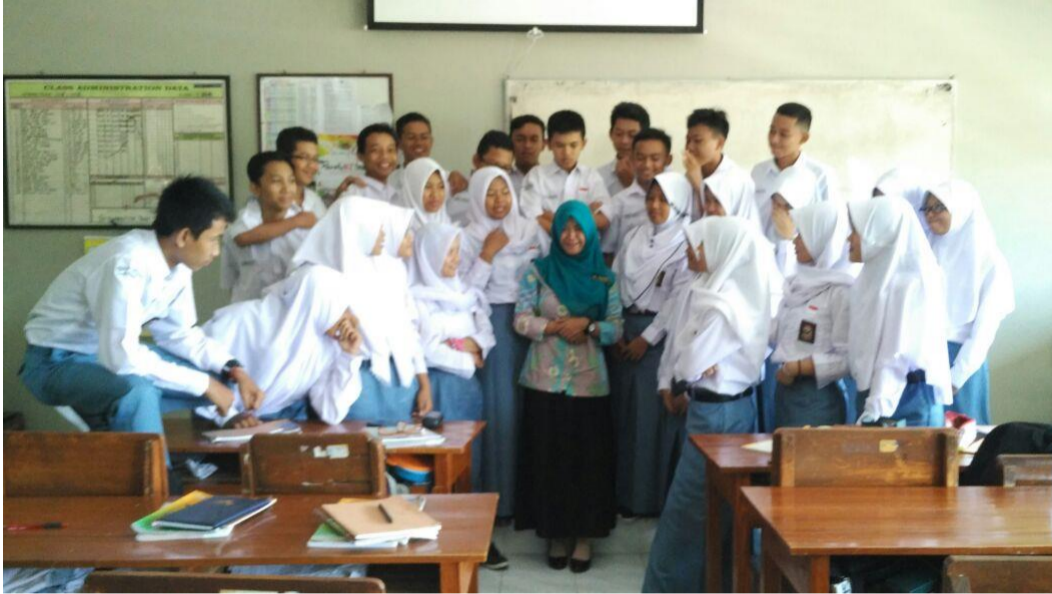
9. Foto Bersama X MIPA 5

Jalan Bogem, Tamanmartani, Kalasan, Sleman, DI Yogyakarta