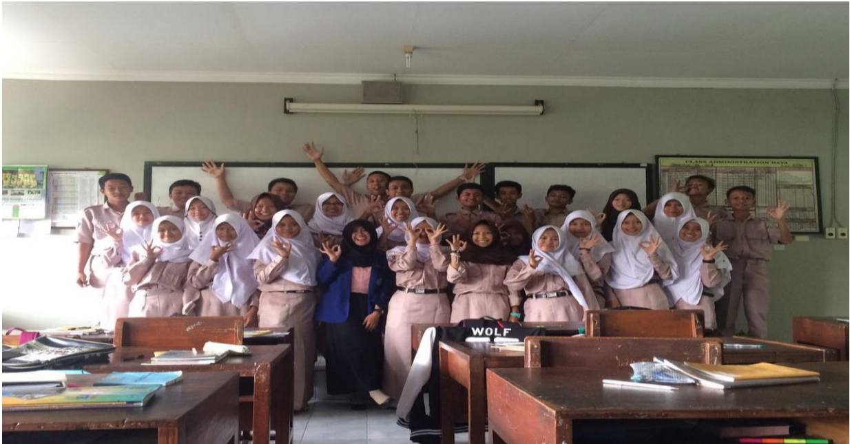
11. Foto Bersama X MIPA 3

Jalan Bogem, Tamanmartani, Kalasan, Sleman, DI Yogyakarta