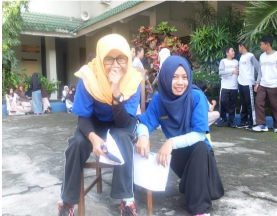
1. Dokumentasi Juri Lomba Gobag Sodor