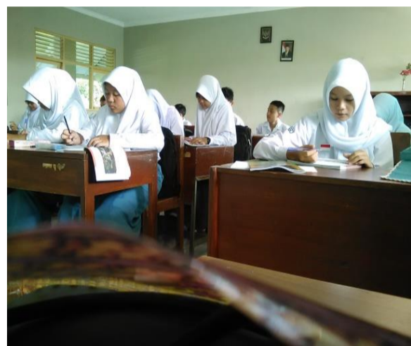
4. Foto Saat KBM