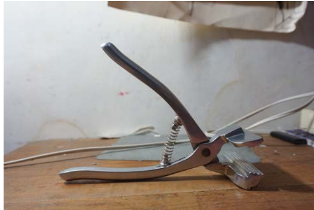
Gambar 36. Tang