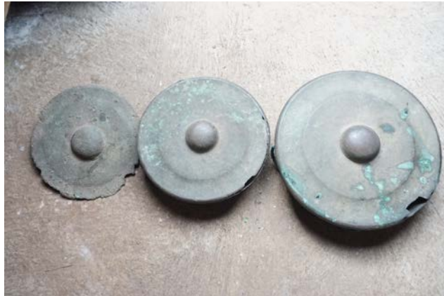
Gambar 13. Bendhe Peninggalan