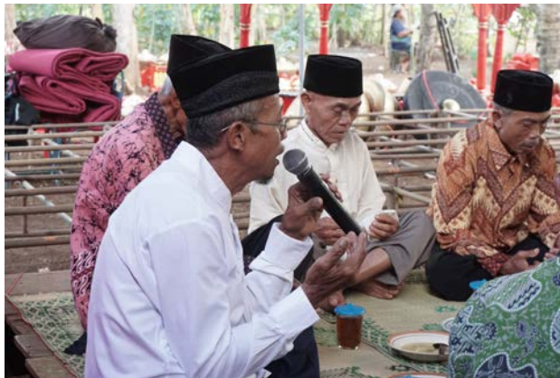
Gambar 8. Iqrar pada Prosesi Kenduren

prosesi rebutan gunung . Prosesi dilaksanakan sebelum dimulainya proses rebutan gunung yang dipimpin oleh orang yang sama pada saat memimpin iqrar proses kenduri . Pada saat rebutan gunung dibacakan doa dengan proses iqrar agar yang direbutkan dapat berguna dengan baik. Contoh padi pada gunung dapat bermanfaat untuk usaha taninya berhasil.