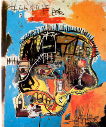
Gambar 21. Karya Jean Michel Basquiat (Sumber: Jean Michel Basquiat)

tersebut, dengan melakukan penggoresan secara merata (plakat). Hal ini mampu memberikan ide dalam warna-warna lukisan yang digunakan oleh penulis.