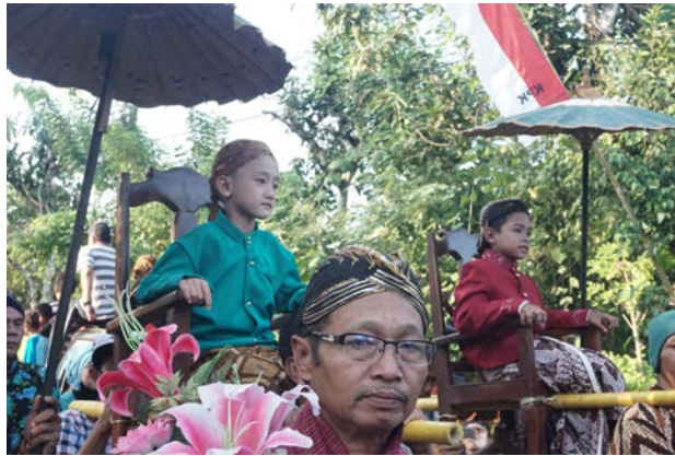
Gambar 14. Sepasang Pengantin