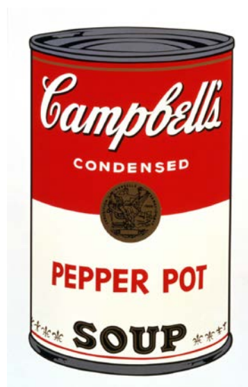
Gambar 22. Karya Andy Warhol (Sumber: Andy Warhol)