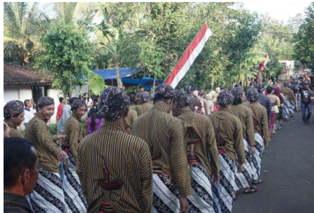
Gambar 17. Salah Satu Peserta Kirab

g. Kegiatan ngalap berkah pada prosesi rebutan gunung dalam Tradisi Upacara Grebeg Ngenep.