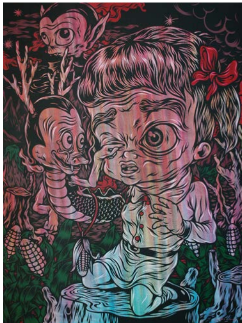
Gambar 2. Under Attack (Sumber : Wedhar Riyadi, 2009)

Wedhar Riyadi lahir di Jogjakarta, 13 Agustus 1980. Lulusan dari Institut Seni Indonesia, atau ISI. Berawal dari ketertarikannya pada komik membuat wedhar berkarya dengan bentuk komik. Komik adalah salah satu refrensi dalam berkaryanya. Karya dua dimensi maupun instalasinya pun banyak menggunakan tokoh-tokoh kartun, seperti The Simpson, Mickey Mouse, Doraemon serta