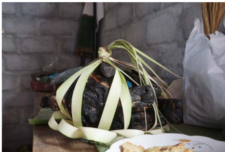
Gambar 3. Sesaji Kepala Kambing

atau disusun oleh anak keturunan dari Ki Mento Kuasa. Setelah itu sesaji atau sering disebut dengan sesajen ini dikirimkan ke tujuh tempat-tempat angker (dipasangkan di tempat angker) “ sing mbaureksa dusun dikaruhi ben dha ora ngangu ” (penunggu dusun didatangi agar tidak mengganggu). Dalam proses melakukan pengiriman sesajen ini hanya bisa dilakukan oleh anak-keturunan Ki Mento Kuasa.