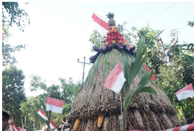
Gambar 15. Gunungan Palawija