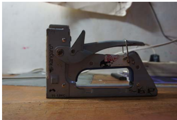
Gambar 31. Staples Tembak

Staples merupakan alat yang digunakan dalam proses penciptaan lukisan. Staples yang digunakan adalah staples tembak. Staples tembak ini memiliki ukuran yang cukup besar karena disesuaikan dengan fungsinya dalam proses penciptaan lukisan. Staples tembak memiliki fungsi atau kegunaan untuk memasang kanvas pada span ram. Staples tembak sangat dibutuhkan karena kanvas yang digunakan adalah kanvas yang belum dalam keadaan terpasang pada span ram. Penulis menggunakan staples tembak berjenis KANGARO TS-13HC yang memiliki ukuran Staples 13mm sehingga akan membuat kanvas terpasang pada span ram dengan kencang dan rapi sesuai dengan apa yang diinginkan oleh penulis.