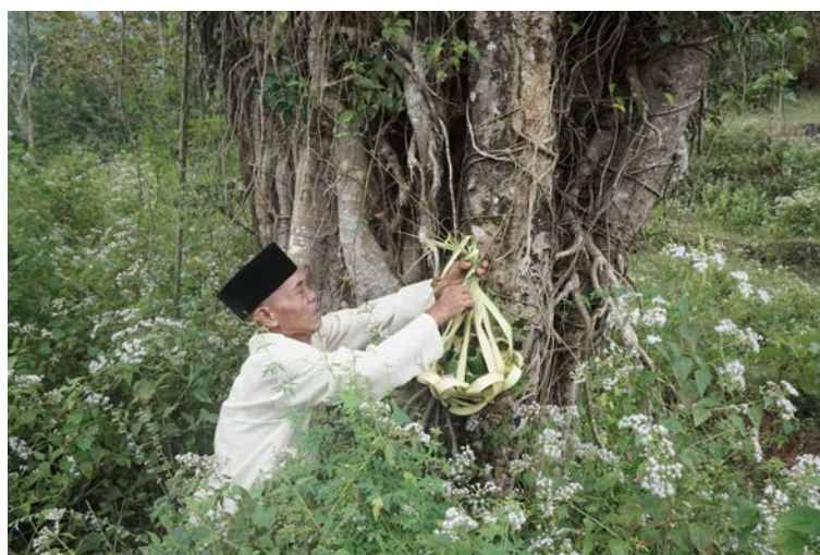
Gambar 4. Mengirim Sesaji