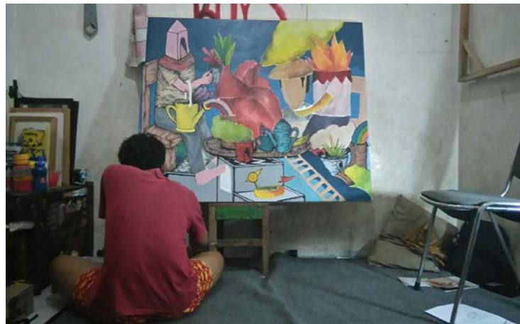
Gambar 39. Proses Pewarnaan

memperhatikan unsur gelap terang untuk mencapai dimensi pada objek. Sedangkan teknik plakat dikerjakan untuk memberikan kesan flat dan menciptakan kontras antara objek dengan background .