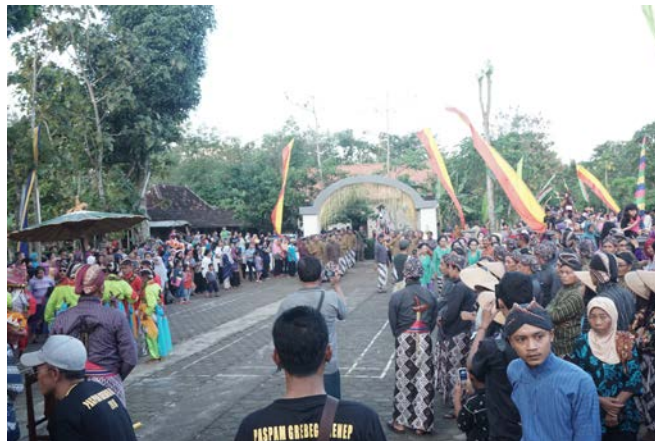
Gambar 19. Peserta Kirab dan penonton