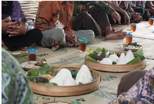
Gambar 5. Tumpeng Kenduren

dalamnya, peran ibu-ibu pun ada di belakang untuk menyiapkan makanan yang akan disajikan. Prosesi kenduren juga digunakan untuk membahas, mempersiapkan prosesi upacara yang digelar pada hari Jumat Wage yang dipimpin oleh ketua pelaksanaan tradisi.