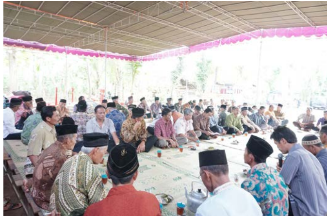
Gambar 7. Peserta Kenduren