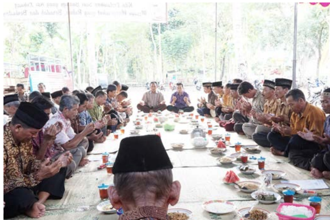
Gambar 6. Prosesi Kenduren