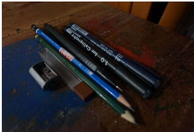
Gambar 35. Pensil dan Bolpoint

Bolpoint adalah alat yang digunakan penulis dalam pembuatan sketsa. Setelah sketsa selesai dibuat dengan menggunakan pensil, sketsa di tebalkan dengan bolpoint. Selain itu, bolpoint di gunakan untuk membuat arsir pada sketsa yang nantinya untuk membuat arsir pada lukisan yang sudah ada dikanvas. Bolpoint yang digunakan penulis berjenis drawing pen berukuran 0.2, 0.5, dan 0.7.