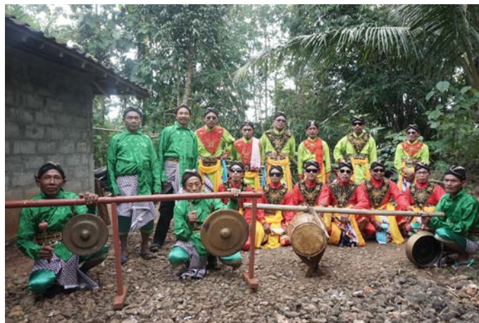
Gambar 10. Prajurit dari Anak-keturunan

Setelah selesainya mengelilingi kompleks Ngenep, semua gunung-gunungan dan peserta kirab dikumpulkan di masjid Al Mutaqim yang berada di Dusun Nogosari untuk melanjutkan prosesi selanjutnya.