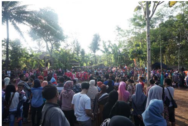
Gambar 12. Tempat berkumpul peserta Kirab