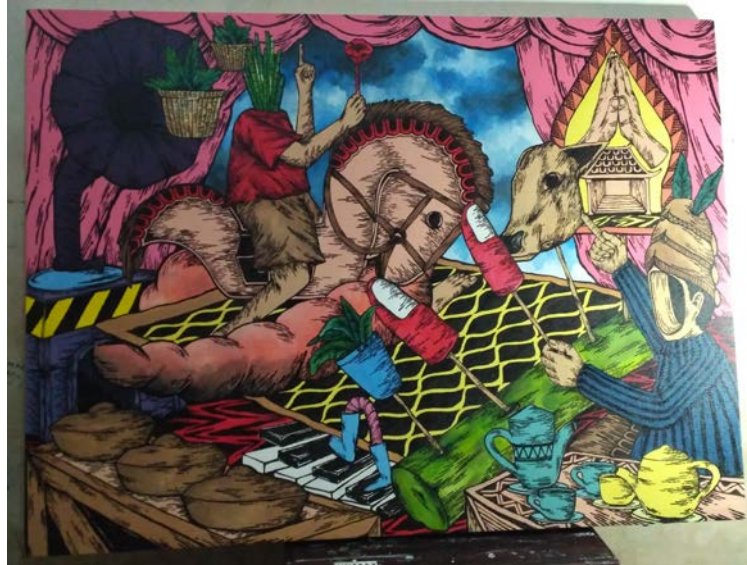
Gambar 40. Arsiran pada Objek