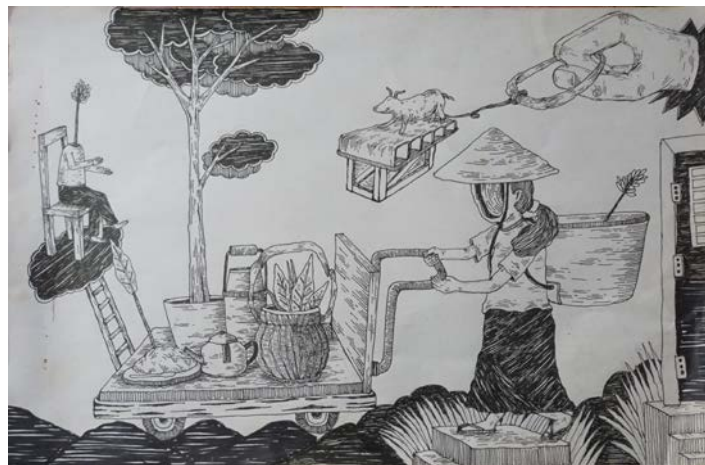
Gambar 37. Sketsa pada Kertas

Sketsa dibuat sebagai proses awal atau perencanaan dalam lukisan. Langkah tersebut merupakan upaya untuk mengeksplorasi berbagai kemungkinan bentuk serta komposisinya sebelum dipindahkan ke atas kanvas. Sketsa dibuat atas hasil observasi yang dilakukan penulis dan hasil eksplorasi dari foto yang diambil penulis pada waktu observasi. Sketsa dibuat menggunakan pensil yang ditebalkan dengan bolpoint jenis drawing pen dengan media kertas. Pada prosesnya sketsa masih memungkinkan untuk dikembangkan lebih lanjut dalam hal pengolahan bentuk ketika dikerjakan di atas kanvas.