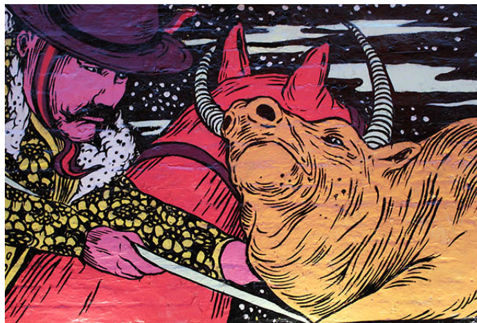
Gambar 26. Karya Broken Fingaz (Sumber: Broken Fingaz)