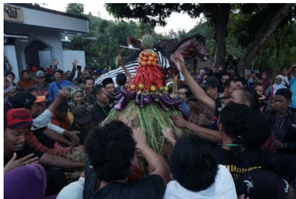
Gambar 20. Suasana Prosesi Rebutan Gunungan