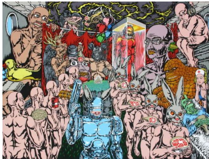
Gambar 25. Karya Nano Warsono

Dalam penciptaan lukisan, penulis melakukan pendekatan dari Nano Warsono dan Broken Fingaz. Kedua seniman ini selalu menggunakan arsiran dalam lukisannya. Arsiran dari kedua seniman itulah mampu memberikan ide arsiran pada lukisan penulis.