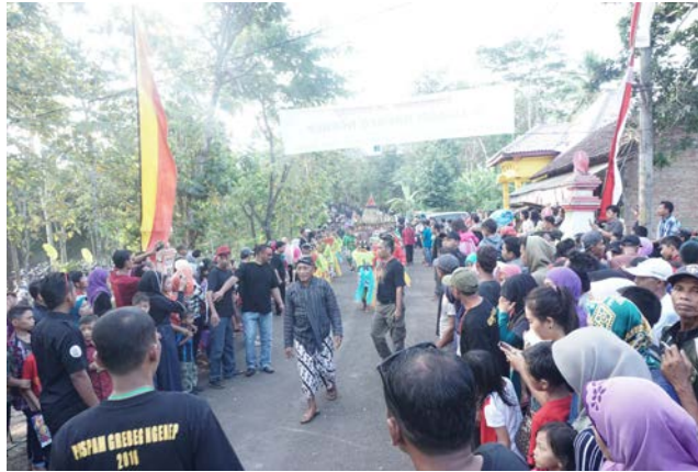
Gambar 16. Suasana Prosesi Kirab