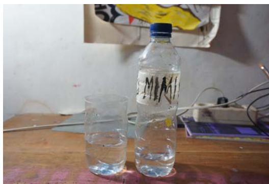
Gambar 29. Air Bersih

Air bersih disini digunakan sebagai pelarut dari cat akrilik, dan mencuci kuas setelah digunakan. Selain mudah didapat, air juga tidak menimbulkan bau yang menyengat sehingga tidak mengganggu penulis pada saat proses melukis.