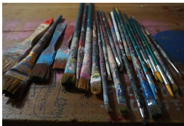
Gambar 30. Kuas

Kuas yang digunakan adalah kuas dengan berbagai ukuran, mulai ukuran 0,1 sampai 20, kuas ukuran kecil untuk pendetailan, dan untuk arsiran, ukuran sedang untuk bagian pembentukan dasar objek, sedangkan kuas ukuran besar untuk penggarapan background . Bentuk dan ukuran kuas akan sangat mempengaruhi hasil goresan warna pada objek. Penulis menggunakan ukuran kuas serta bentuk kuas yang berbeda pada masing-masing objek lukisannya untuk menghasilkan teknik pewarnaan yang diinginkan oleh penulis.