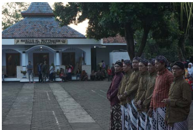
Gambar 18. Sambutan untuk Peserta Kirab

Prosesi ini dimulai dengan pembacaan iqrar yang dipimpin oleh orang yang sama pada saat memimpin iqrar prosesi kenduri . Prosesi ini menjadi penting dan sangat dinanti karena setiap isi dari gunung memiliki manfaat masing-masing. Seperti contohnya untaian padi pada gunung palawija bermanfaat untuk ngalap berkah agar usaha taninya berhasil. Setelah itu semua gunung dibawa kembali ke masing-masing dusun.