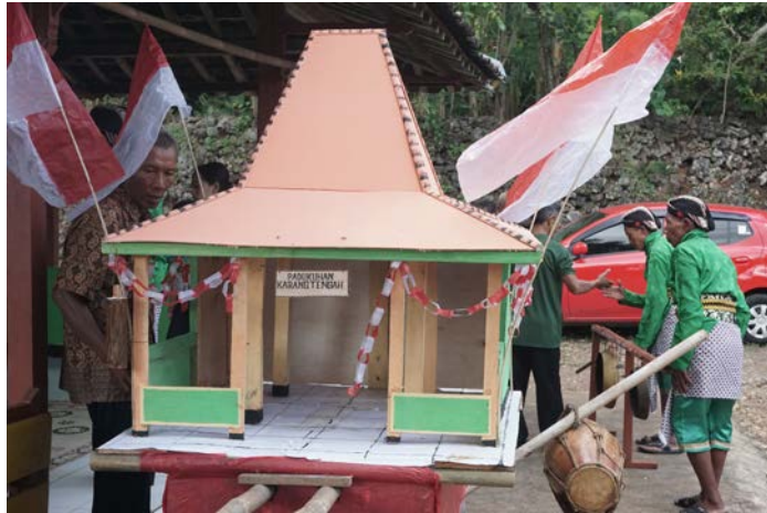
Gambar 11. Pengambilan Gunungan