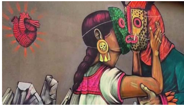
Gambar 23. Karya Saner Edgar (Sumber: Saner Edgar)

Dalam penciptaan lukisan penulis melakukan pendekatan dari Wedhar Riyadi dan Saner Edgar. Penggunaan karakter objek dan komposisi yang digunakan dalam bentuk lukisan dari kedua seniman ini mampu memberikan ide dalam lukisan penulis.