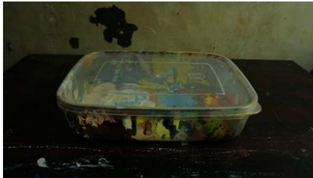
Gambar 32. Toples Plastik

Supaya, cat yang dituangkan tidak terlalu banyak, sesuai dengan kebutuhan penulis. Toples ini beserta tutup, dengan tujuan supaya cat tidak mudah kering.