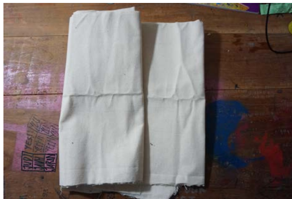
Gambar 27. Kanvas

Kain kanvas yang digunakan adalah kanvas mentah yang berserat halus. Kain kanvas dibentangkan di atas spanram yang terbuat dari kayu pinus, dan jati, kemudian kain kanvas diberi lapisan pertama dengan cat tembok (no drop) lalu diberi lapisan dengan cat tembok (envi) yang diencerkan dengan pelarut berupa air, lapisan dapat dilakukan tiga sampai empat lapis, gunanya untuk menutup pori-pori pada kain, kemudian ditiriskan sampai kering. Setelah itu permukaan diampelas sampai halus dan jadilah kanvas siap digunakan untuk melukis.