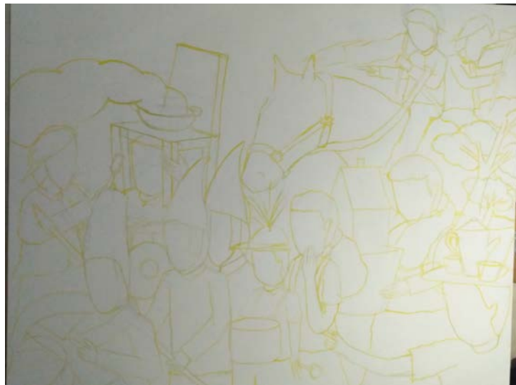
Gambar 38. Sketsa pada Kanvas

digunakan pensil HB untuk membuat objek dan figur pada kanvas. Tingkat kepekatan pensil HB yang rendah membuat objek pada kanvas tidak terlihat dengan jelas. Maka dari itu penulis melanjutkan dengan menggunakan cat yang lebih encer dengan warna yellow dalam pembuatan sketsa pada kanvas. Eksplorasi bentuk dan komposisi dalam proses pemindahan sketsa pada kanvas sangat dimungkinkan karena adanya penajaman ide dan gagasan, sehingga memunculkan objek yang beragam maupun pembuatan objek yang sederhana.