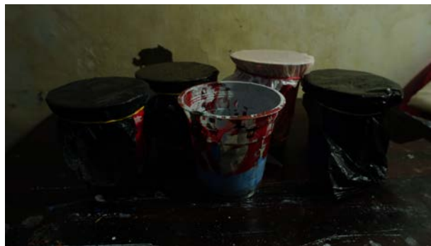
Gambar 33. Gelas Plastik

Selain toples plastic yang digunakan untuk menyampur cat, penulis juga menggunakan gelas plastik untuk tempat cat dan menyampur cat. Alat ini digunakan ketika penulis membutuhkan cat dengan porsi yang lebih banyak untuk pewarnaan objek maupun pewarnaan pada background lukisan. Biasanya setelah digunakan gelas plastik yang sudah berisi cat itu ditutup dengan plastik supaya cat yang ada didalamnya tidak kering dan bisa digunakan lagi. Selain itu, alat ini juga digunakan untuk tempat air mencuci kuas yang setelah digunakan oleh penulis.