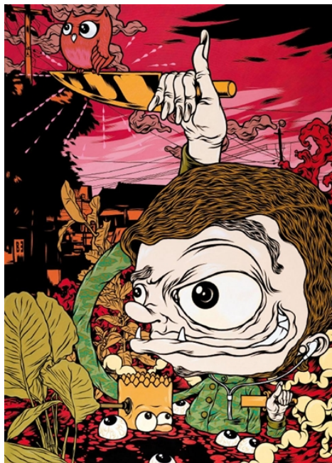
Gambar 24. Karya Wedhar Riyadi