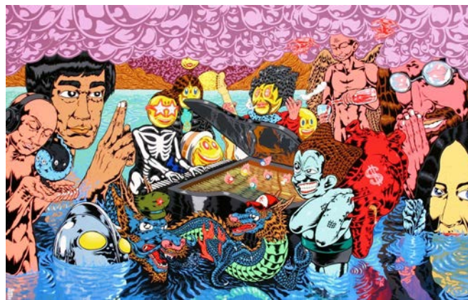
Gambar 1. Celebrating The New Moon

Nano Warsono lahir di Jepara, pada tanggal 09 Mei 1976. Pada Tahun 2002, Nano lulus dari Institut Seni Indonesia (ISI) jurusan Patung. Bekerja menjadi dosen di ISI sejak 2004, selain menjadi dosen, Nano juga mempunyai pekerjaan sampingan sebagai ilustrator. Pada tahun 2009 seniman ini pernah menjadi 15 finalis asian art prize.