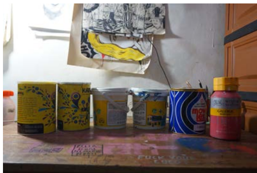
Gambar 28. Cat

bermacam teknik lukis, diantaranya plakat , gradasi dan arsir (dalam hal ini cat akrilik tidak kalah dari cat minyak). Menggunakan pelarut berupa air juga menjadi salah satu alasan penulis menggunakan cat akrilik, karena sangat membantu penulis pada saat proses melukis dikarenakan cat akrilik yang menggunakan pelarut berupa air ini tidak menimbulkan bau menyengat yang dapat mengganggu mood , konsentrasi serta kesehatan penulis pada saat proses melukis.