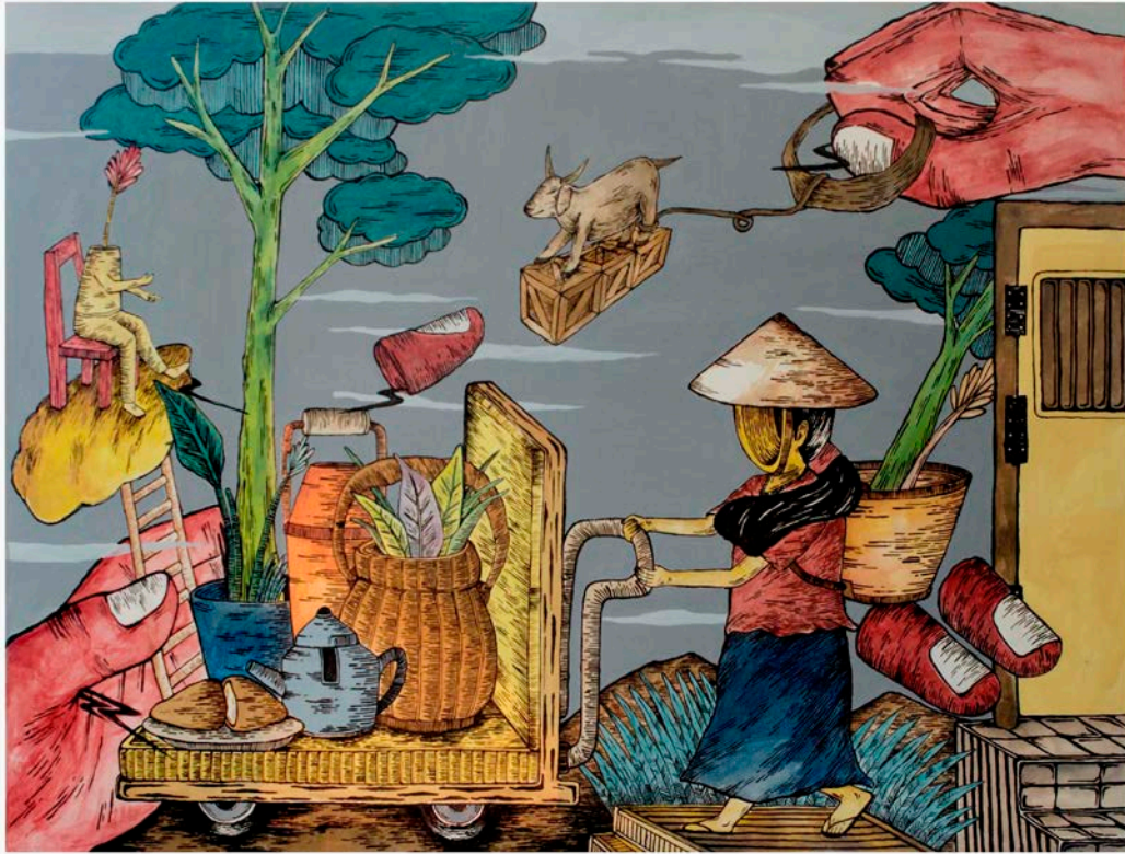
Gambar.44 Karya berjudul: “ Urat Syarat ” Cat Acrylic pada Kanvas 120cm x 90cm, 2016

Lukisan diatas terdapat beberapa figur orang, figur potongan tangan, potongan jari, figur berbagai tumbuhan, pohon dan objek benda. Pada bagian tengah lukisan terlihat satu figur orang yang digambarkan dengan posisi berdiri dan seakan sedang berjalan mendorong sebuah benda menyerupai troli dan juga menggendong sebuah objek benda. Figur ini berdiri diatas sebuah kotak berwarna brunt siena yang digambarkan dengan sebuah tangga bermotif persegi panjang berwarna hitam yang disusun secara sejajar. Figur orang ini divisualisasikan menyerupai seorang perempuan dengan bagian wajah berlubang kedalam yang sedang mengenakan baju lengan pendek berwarna brilliant red dan rok panjang