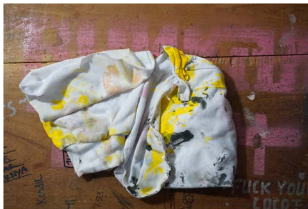
Gambar 34. Kain Lap

Kain lap merupakan perangkat yang tidak bisa ditinggalkan selama proses melukis. Kain lap adalah alat yang cukup penting dalam proses selama melukis. Kain lap digunakan untuk membersihkan sisa-sisa cat yang masing menempel pada kuas. Sisa-sisa cat yang menempel pada kuas apabila dibiarkan atau tidak dilap akan beresiko mengganggu saat menggunakan warna yang baru dalam proses pewarnaan lukisan. Warna cat baru yang ada pada kuas bisa tercampur dengan warna cat yang menempel sebelumnya pada kuas tersebut. Hasil dari percampuran warna cat yang baru dengan warna-warna cat yang menempel sebelumnya pada kuas tentunya akan memberikan hasil warna yang berbeda dari yang diinginkan oleh penulis. Hal tersebut tentunya menjadikan lap menjadi alat yang sangat penting dalam proses pembuatan atau penciptaan sebuah lukisan.