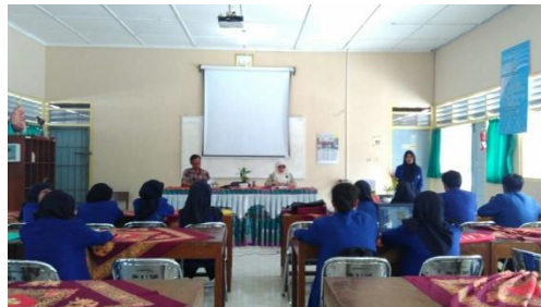
Pelepasan Mahasiswa PPL