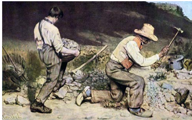
Gambar 1. Lukisan karya Gustav Courbet “ The Stone Breaker ” (1849)

Seni lukis realisme adalah suatu aliran atau gaya yang memandang dunia ini tanpa ilusi, apa adanya tanpa menambah atau mengurangi objek, atau suatu faham yang menangkap realitas seperti apa adanya. Proklamasi realisme dilakukan oleh pelopor sekaligus tokohnya yaitu Gustave Courbet (1819-1877) pada tahun 1855, dengan slogannya yang terkenal “Tunjukkan malaikat padaku dan aku akan melukisnya!” yang mengandung arti bahwa bagian lukisan itu adalah seni yang kongkret, menggambarkan segala sesuatu yang nyata. Dengan kata lain, ia hanya mau menggambarkan pada penyerapan panca indra saja (khususnya mata) dan meninggalkan fantasi dan imajinasinya (Mikke Susanto, 2011: 327).