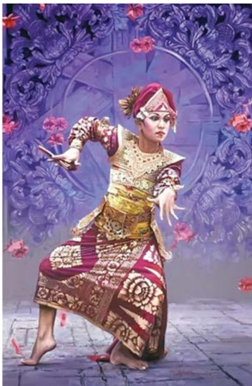
Gambar 2. Lukisan karya Dede Eri Supria "Penari Legong" (Cat minyak pada kanvas, 120x110 cm, 2006)

Dede Eri Supria adalah seorang maestro pelukis pelopor aliran realisme. Seniman kelahiran Jakarta, 29 Januari 1956 ini dikenal sebagai seorang pelukis yang mampu memindahkan objek ke bidang kanvas mirip hasil fotografi. Dede banyak mengungkapkan sisi kehidupan di ibukota metropolitan dan sering melukiskan tema tentang pertunjukan tari terutama lengang-lenggok gadis Bali.