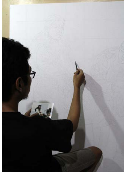
Gambar 17. Sketsa pada kanvas

Dalam membuat sketsa pada kanvas, pensil yang digunakan adalah pensil dengan ukuran HB. Tingkat kepekatan pensil HB yang rendah menjadi pertimbangan dalam pemindahan sketsa pada kanvas, karena mudah dihapus dan tidak menimbulkan bekas maupun kesan kotor pada lukisan.