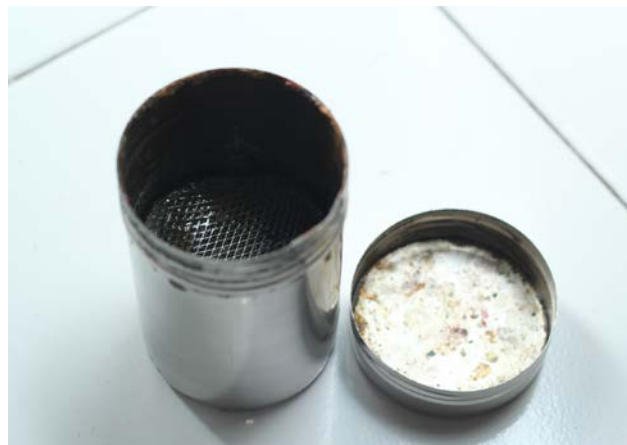
Gambar 13. Wadah berisi White Spirit

ataupun terpentin. Di dalam wadah, penulis memodifikasi dengan memberikan kawat kasa yang diletakkan \frac{3}{4} dari tinggi wadah. Hal ini agar saat mencuci kuas, cat yang kotor dapat mengendap di bawah wadah dan tidak ikut tercampur serta kuas dapat tercuci secara bersih.