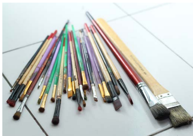
Gambar 8. Kuas

Pada proses visualisasi, kuas yang digunakan yaitu kuas berbahan nilon dengan merek V-Tec , Eterna , Phoenix dan Lyra . Kuas yang digunakan adalah kuas dengan berbagai ukuran, mulai ukuran 0,1 sampai 18, kuas ukuran kecil untuk pendetailan, ukuran sedang untuk bagian pembentukan dasar objek, sedangkan kuas ukuran besar untuk penggarapan background . Bentuk dan ukuran kuas akan sangat mempengaruhi hasil goresan warna pada objek. Pada penciptaan lukisan ini menggunakan ukuran kuas serta bentuk kuas yang berbeda pada masing-masing objek lukisanya untuk menghasilkan teknik pewarnaan yang diinginkan.