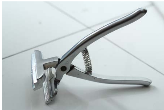
Gambar 15. Tang kanvas

Tang kanvas ( Cascade tant pliers ) dibutuhkan untuk memudahkan ketika memasang lembaran kanvas pada spanram agar dapat tertarik dengan kencang. Tang kanvas ini mempunyai mulut yang berbentuk pipih dan lebar serta bergerigi yang berfungsi untuk menekan kanvas dengan kuat. Dalam penciptaan lukisan ini menggunakan tang kanvas merk Maries yang dapat di temukan di toko alat lukis.