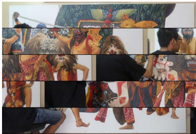
Gambar 19. Proses pewarnaan objek

Kemudian apabila obyek yang dibuat pada langkah pertama sudah terlihat kemiripan dengan bentuk objek, dilanjutkan dengan proses polychrome atau multiwarna. Pewarnaan pada objek ini dilakukan dengan teknik opaque . Tahap ini berupa penambahan warna sesuai dengan realita atau sesuai dengan warna asli objeknya. Dalam melukis teknik ini juga dimungkinkan adanya timpa-timpa warna dan cat. Menumpuk dan menumpuk warna dilakukan untuk mengincar ketepatan bentuk dan warna yang diinginkan ( impasto ).