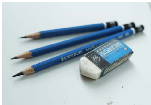
Gambar 11. Pensil dan penghapus

Pensil digunakan untuk memindahkan sketsa pada kanvas. Penulis menggunakan pensil jenis HB. Pensil jenis HB memiliki ketebalan warna yang rendah karena batang arang yang terdapat pada pensil tersebut bersifat keras, pensil dengan kode ini digunakan untuk memindahkan sketsa pada kanvas. Tingkat ketebalan yang rendah membuat pensil ini mudah di hapus dan tidak menimbulkan kesan kotor pada lukisan.