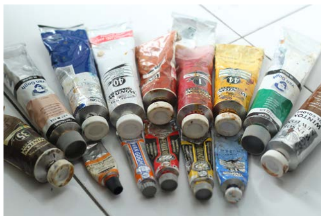
Gambar 6. Cat Minyak

Cat merupakan bahan yang sangat penting dalam pembuatan sebuah lukisan. Ada beberapa jenis cat yang dapat digunakan untuk mewarnai sebuah objek lukisan diatas kanvas misalnya cat minyak, cat air dan cat akrilik. Dalam penciptaan lukisan ini menggunakan cat minyak karena sifatnya yang tidak cepat kering, sehingga memudahkan dalam membuat detail dan membuat gradasi pada karya lukis. Jenis cat minyak yang digunakan dalam melukis yaitu, cat produk dari Rembrandt , Van Gogh , Winton dan Greco . Cat produk ini mempunyai kualitas warna dan ketahanan yang cukup baik.