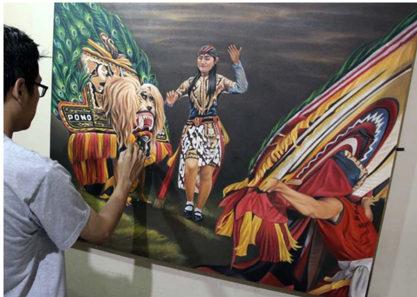
Gambar 21. Proses finishing

Finishing atau penyelesaian yaitu tahap pengerjaan secara akhir sebagai penyempurna pada keseluruhan lukisan dengan menambahkan atau menumpukkan warna-warna dengan lebih kompleks. Pada tahap ini proses penggarapaan lukisan berada pada titik paling sensitif. Disebut demikian karena setiap bagian terkecil diperhatikan dengan seksama seperti memperhatikan warna secara tepat pada bagian-bagian detail terkecil.