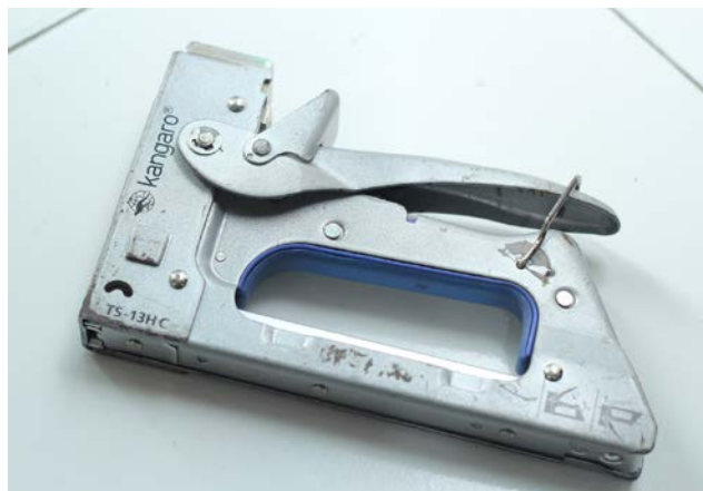
Gambar 12. Staples Tembak

Staples merupakan alat yang digunakan dalam proses penciptaan lukisan. Staples yang digunakan adalah staples tembak. Staples tembak ini memiliki ukuran yang cukup besar karena disesuaikan dengan fungsinya dalam proses penciptaan lukisan. Staples tembak memiliki fungsi atau kegunaan untuk memasang kanvas pada spanram. Staples tembak sangat dibutuhkan karena kanvas yang digunakan adalah kanvas yang belum dalam keadaan terpasang pada spanram. Penulis menggunakan staples tembak berjenis Kangaro TS-13HC yang memiliki ukuran Staples 12mm sehingga akan membuat kanvas terpasang pada spanram dengan kencang dan rapi sesuai dengan apa yang diinginkan.