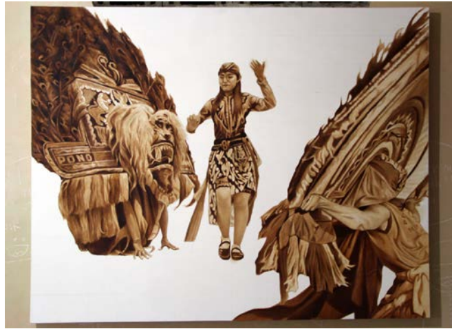
Gambar 18. Proses underpainting

Kemudian apabila obyek yang dibuat pada langkah pertama sudah terlihat kemiripan dengan bentuk objek, dilanjutkan dengan proses polychrome atau multiwarna. Pewarnaan pada objek ini dilakukan dengan teknik opaque . Tahap ini berupa penambahan warna sesuai dengan realita atau sesuai dengan warna asli objeknya. Dalam melukis teknik ini juga dimungkinkan adanya timpa-timpa warna dan cat. Menumpuk dan menumpuk warna dilakukan untuk mengincar ketepatan bentuk dan warna yang diinginkan ( impasto ).