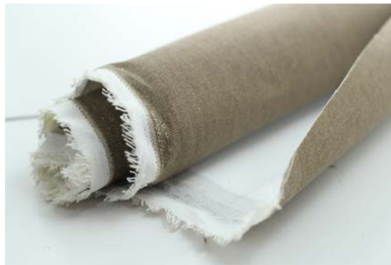
Gambar 5. Kanvas