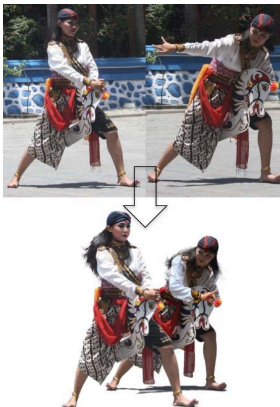
Gambar 16. Tahapan penggabungan foto

Berdasarkan gambar di atas, dapat dianalisa bahwa hasil akhir gambar di atas merupakan gabungan dari dua foto dengan posisi depan-belakang, sehingga menimbulkan kesan ruang. Secara keseluruhan komposisi pada foto telah diubah dan dibuat secara seimbang dengan mengomposisikan objek utama berada di tengah. Dengan mengomposisi ulang objek-objek menjadi terlihat seimbang, hal ini juga dilakukan penulis terhadap foto lain sebelum melakukan pembuatan sketsa di kanvas.