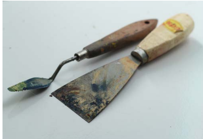
Gambar 10. Pisau Palet