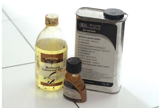
Gambar 7. Pelarut Cat

Artist White Spirit mempunyai karakter mudah menguap, mudah terbakar, digunakan untuk membersihkan peralatan cat minyak, dengan karakteristik berbau namun tidak beracun dibandingkan terpentin.