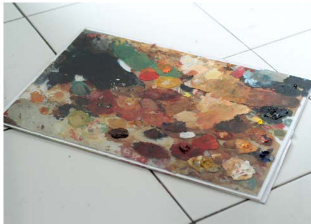
Gambar 9. Palet

Palet merupakan alat yang penting dalam proses visualisasi lukisan. Palet warna digunakan sebagai tempat mencampur cat. Palet warna yang baik adalah yang memiliki daya serap cairan yang rendah dan tidak mudah patah ataupun sobek sehingga memudahkan pelukis untuk mencampur berbagai macam unsur warna dengan menggunakan takaran air maupun minyak. Sesuai kebutuhannya penulis hanya menggunakan palet dari kaca karena lebih licin saat mencampur cat dan agar mudah dalam pembersihannya ketika cat sudah menumpuk kering.