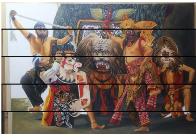
Gambar 20. Proses pewarnaan background

Background dalam lukisan dibuat flat dengan gradasi warna menggunakan teknik opaque yaitu mencampurkan cat menggunakan sedikit medium lalu menyapukan cat secara menyeluruh dan membuat gradasi warna menggunakan kuas yang berukuran lebar pada bidang kanvas. Permainan kontras pada objek dengan pewarnaan gradasi warna background yang datar dapat menonjolkan karakter-karakter objek pada lukisan. Pemilihan warna background pada lukisan dominan menggunakan warna gelap dan redup. Hal ini dimaksudkan untuk memunculkan kesan dramatik pada lukisan. Karena pada dasarnya kesenian Reyog Ponorogo adalah kesenian yang erat dengan nuansa magisnya.