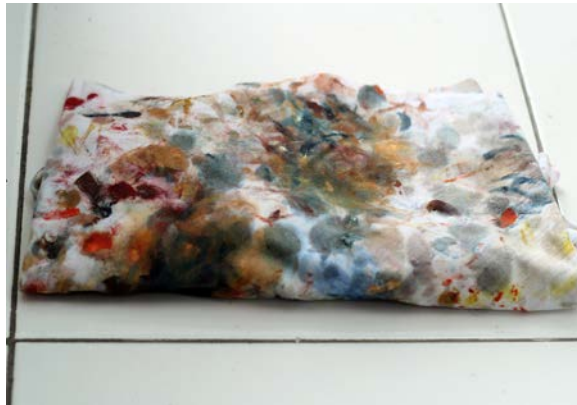
Gambar 14. Kain Lap

Selain itu kain lap juga digunakan untuk membersihkan cat atau minyak yang tercecer disekitar tempat melukis. Hal tersebut tentunya menjadikan lap menjadi alat yang sangat penting dalam proses pembuatan atau penciptaan sebuah lukisan.