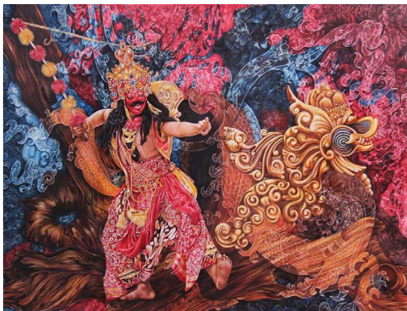
Gambar 4. Lukisan karya Chairul S. Sabarudin "I'll Conquer You!"

(Pensil warna pada kanvas, 250x190 cm, 2016)