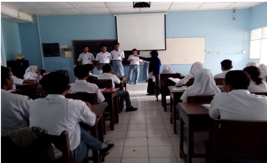
Presentasi setiap perwakilan kelompok terkait salah satu materi sosiologi dengan metode JIGSAW