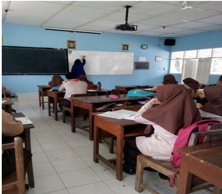
Praktek mengajar di kelas X B dengan media manual “eco media dan ceramah”