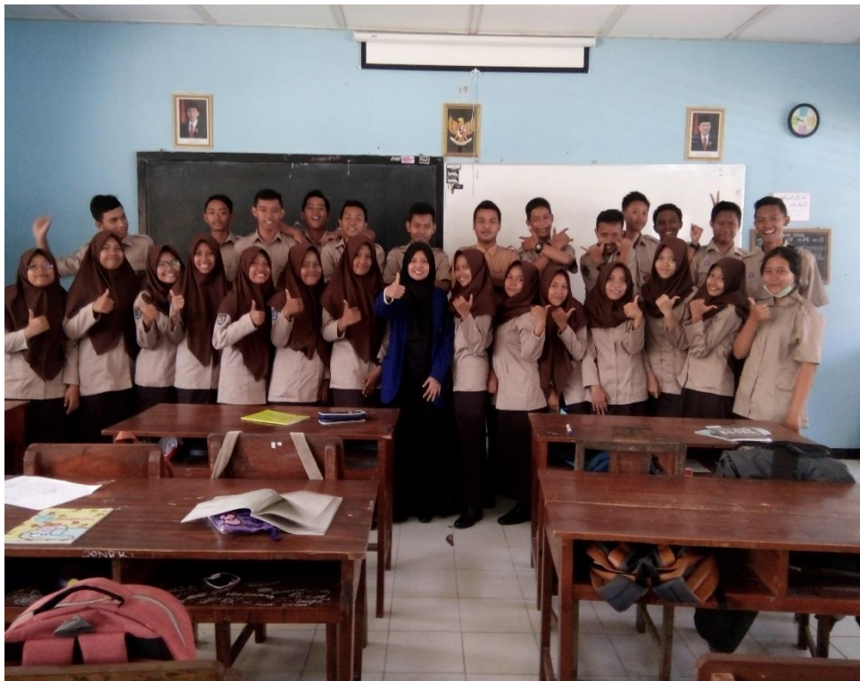
Pose pertemuan praktek mengajar terakhir dan perpisahan dengan anak-anak X B