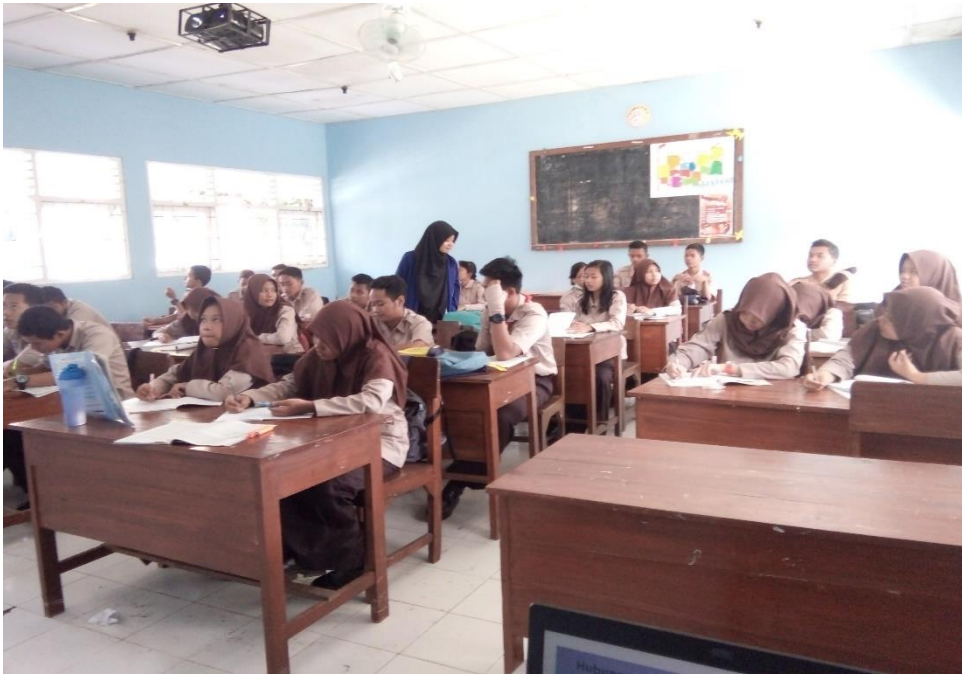
Kondisi anak-anak kelas X B yang sedang melangsungkan ulangan harian