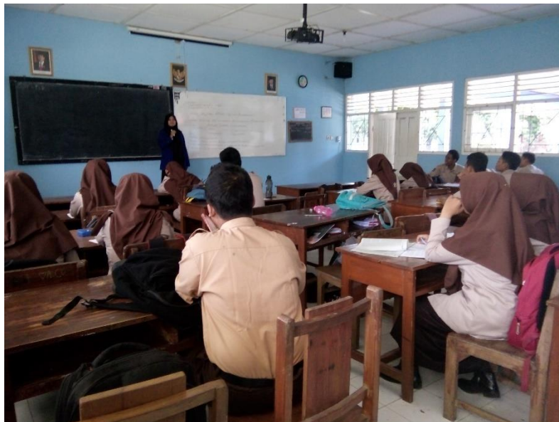
Praktek Mengajar dengan menggunakan IT dan ceramah