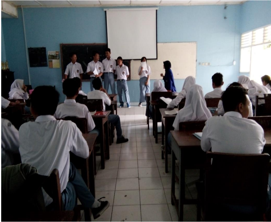
Praktek mengajar di kelas X A di ikuti dengan penuh antusias oleh siswa