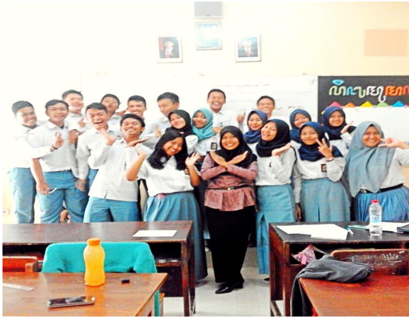
Foto bersama siswa kelas XII IPA 3