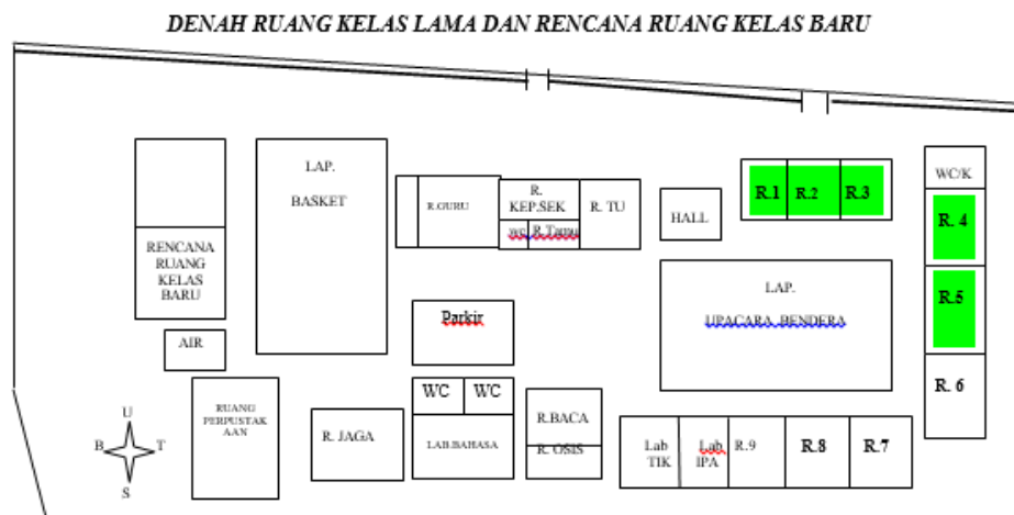
Gambar 2. Denah SMP N 2 Cangkringan