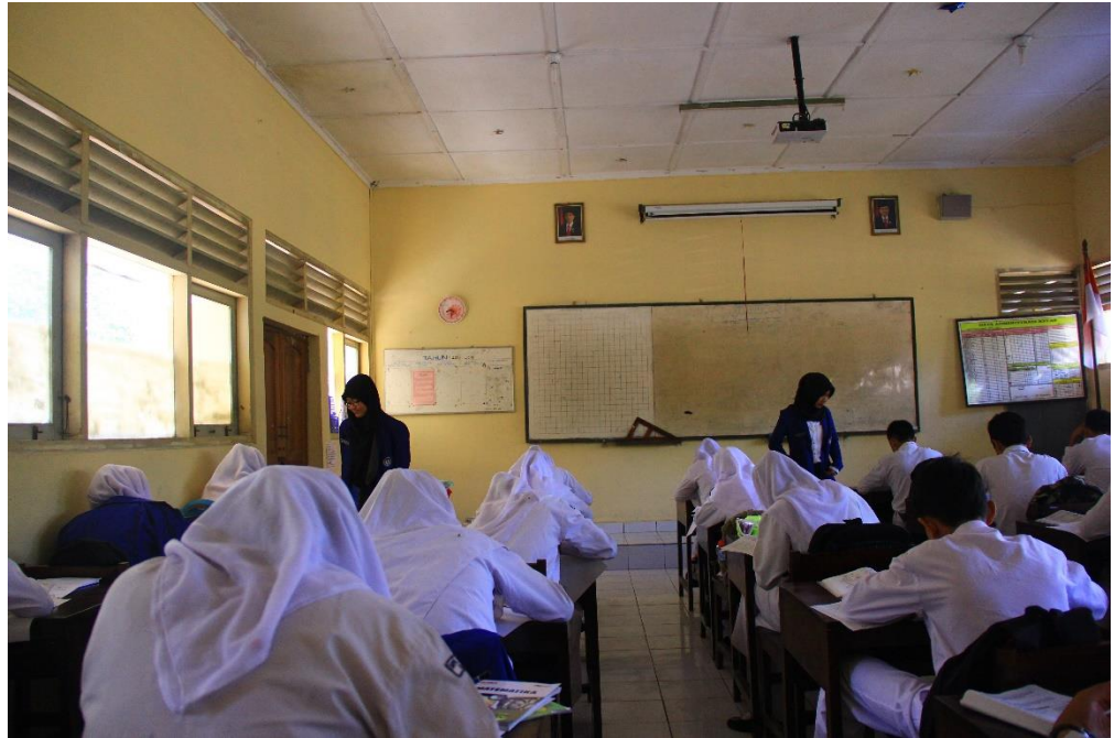
Gambar 4. Dokumentasi Kegiatan Belajar Mengajar dari Mahasiswa PPL