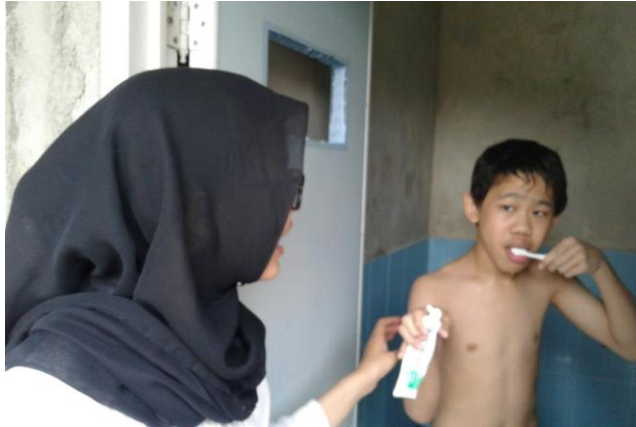
D. Kegiatan di Sekolah/ Di Luar Kelas