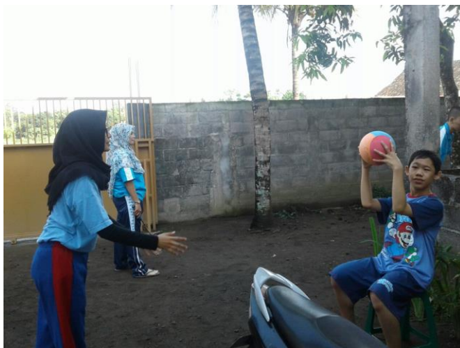
E. Media yang Digunakan