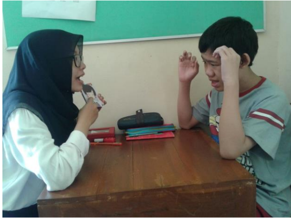
B. Kegiatan Memasak