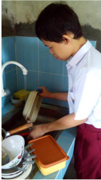
C. Kegiatan Keterampilan