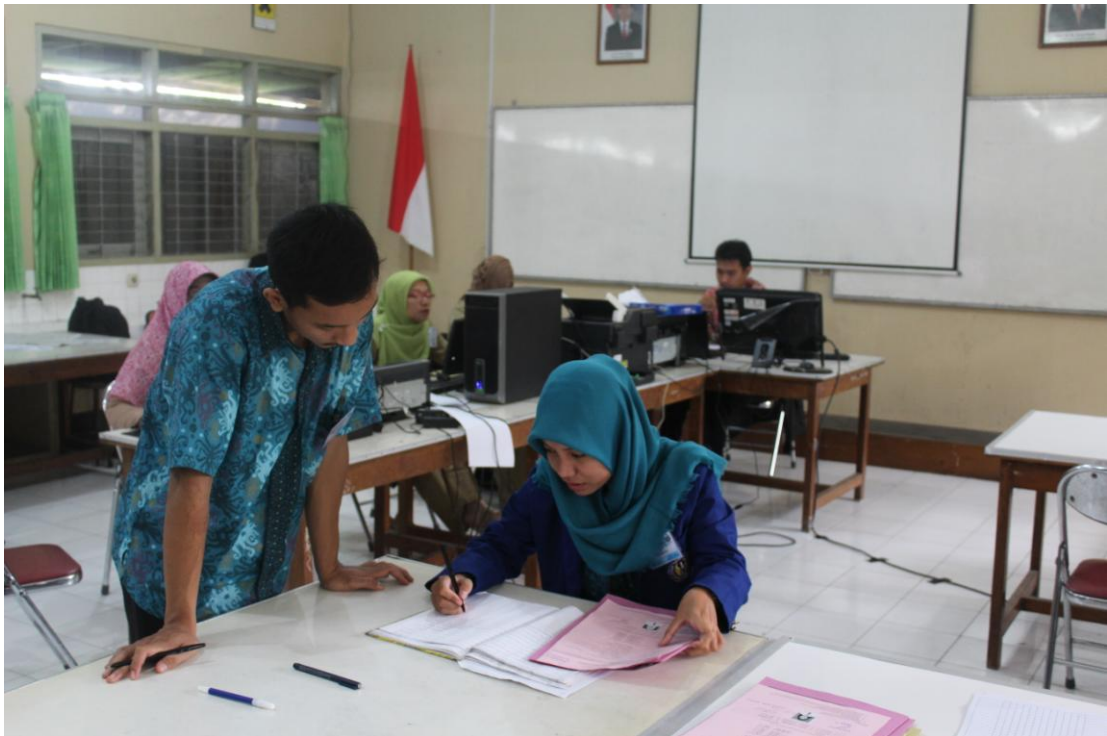
Gambar 4. Membantu pelaksanaan PPDB