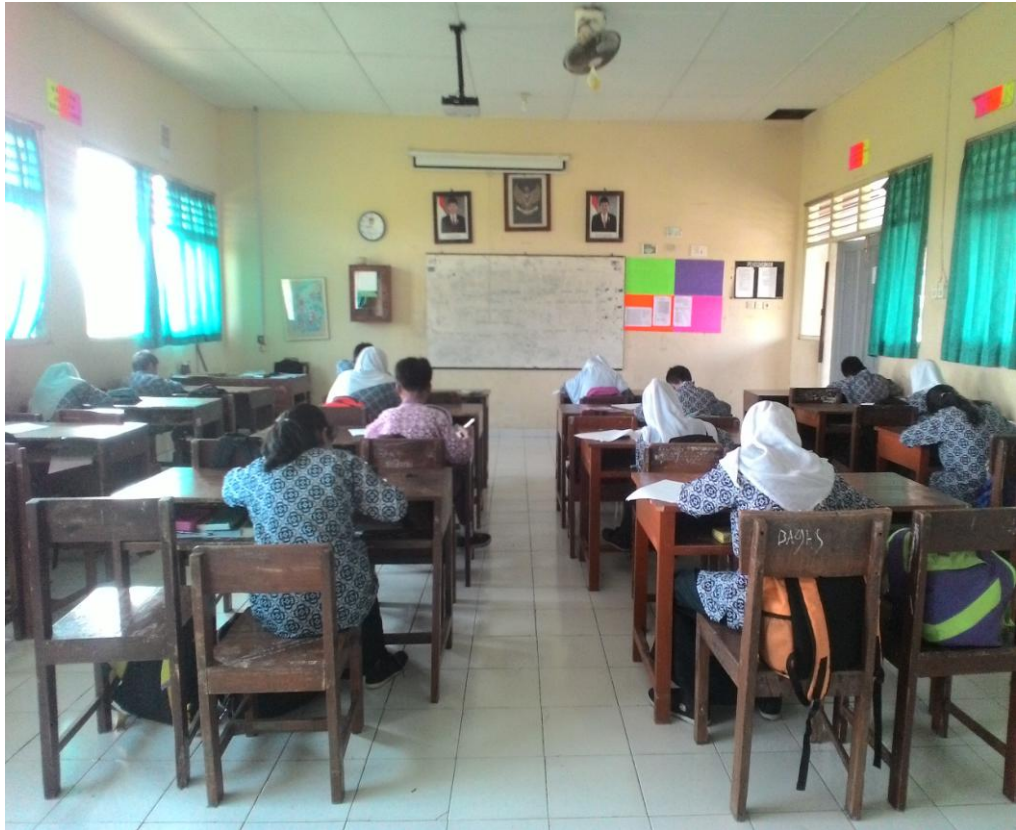
Gambar 3. Kondisi siswa saat ulangan harian