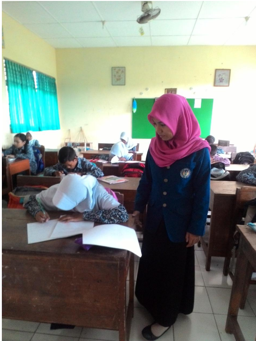
Gambar 2. Mengajar di kelas