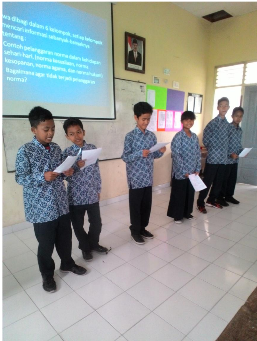
Gambar 1. Siswa sedang melakukan presentasi di depan kelas