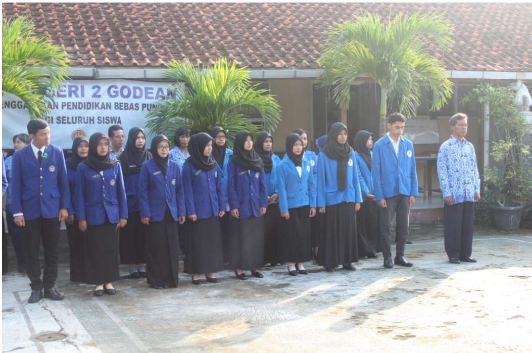
Gambar 5. Pelaksanaan Upacara Bendera