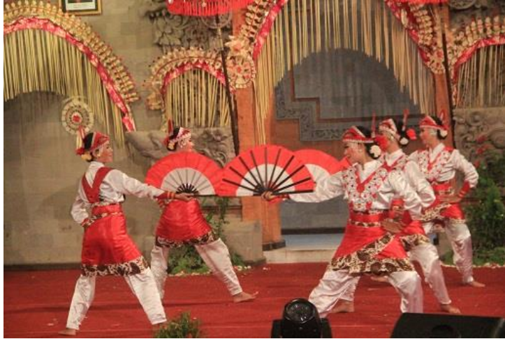
Tari topeng ireng