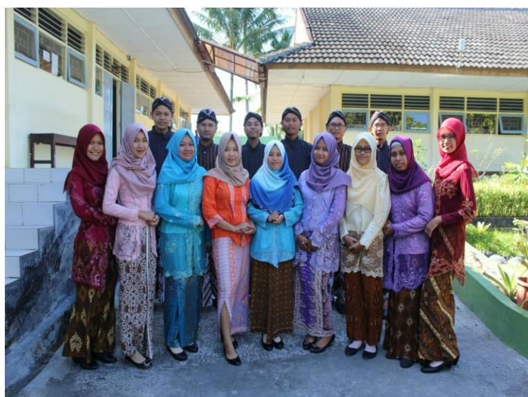
Foto bareng Teman-Teman PPL SMA N 1 Tempel.