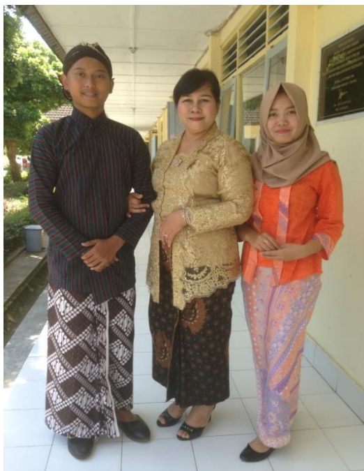
Foto bareng Guru Sejarah SMA N 1 Tempel dan Teman PPL Sejarah.