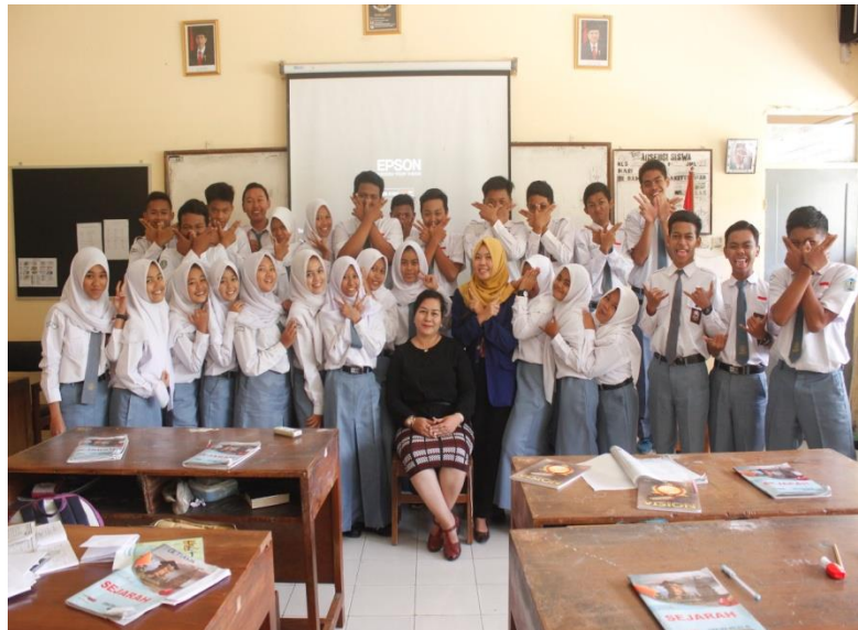
Foto bareng Kelas XI IPS 1