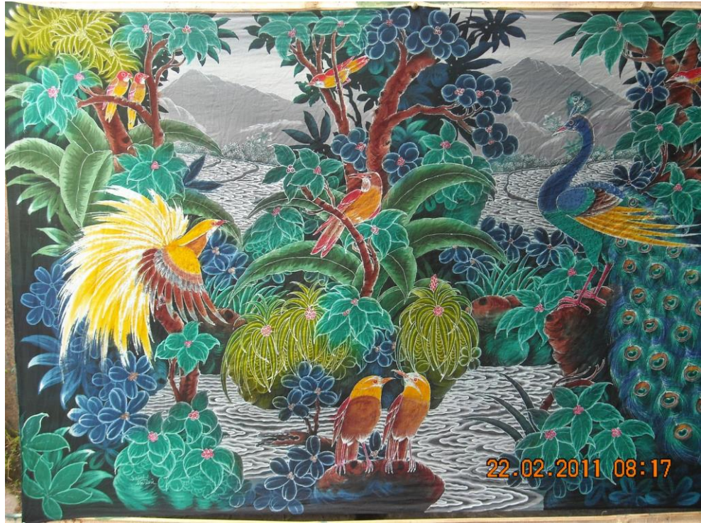
3). Batik Cap