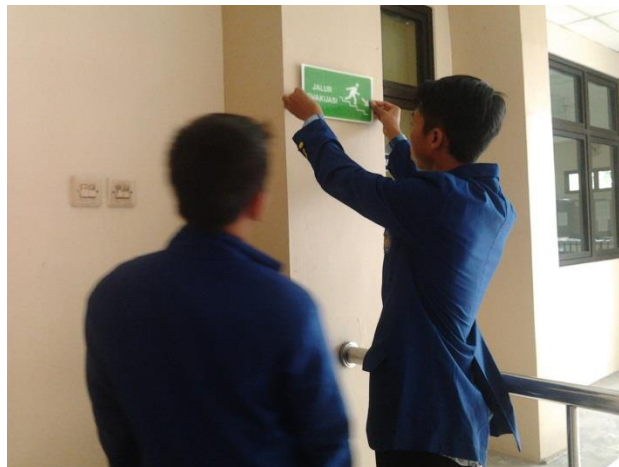
Gambar 3. Pengadaan Tanda Jalur Evakuasi