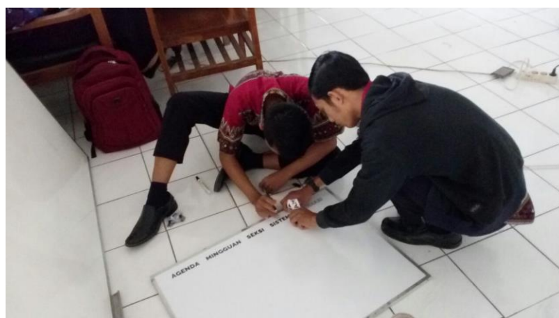
Gambar 8. Pembuatan Papan Agenda Mingguan PSI