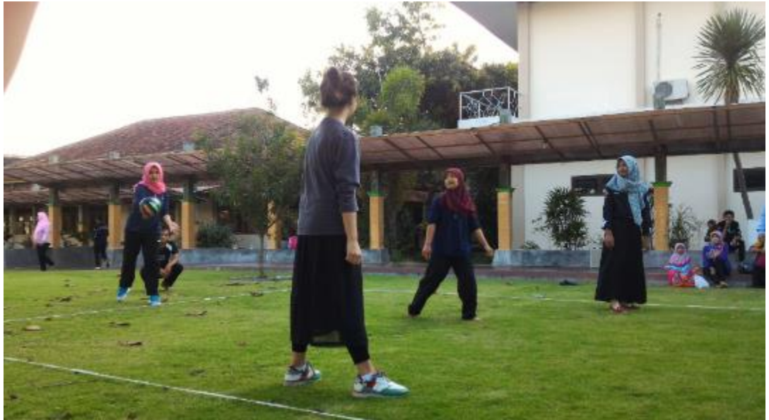
Gambar 1. Peringatan HUT RI Volly Geber