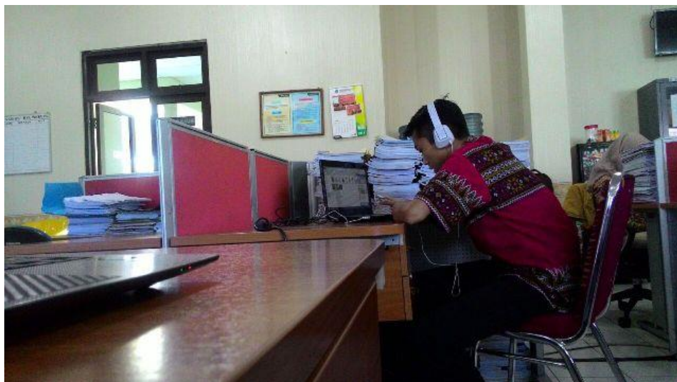
Gambar 7. Pembuatan Multimedia Selayang Pandang LPMP