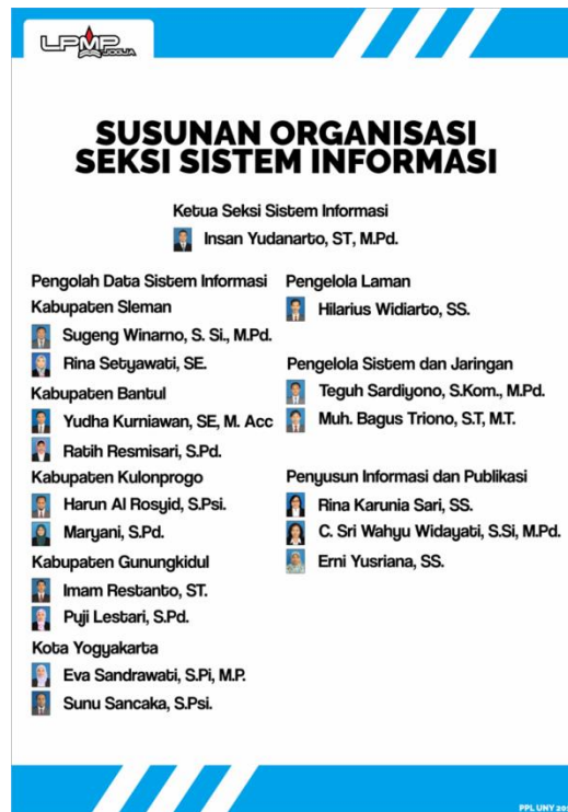
Gambar 6. Struktur Organisasi PSI