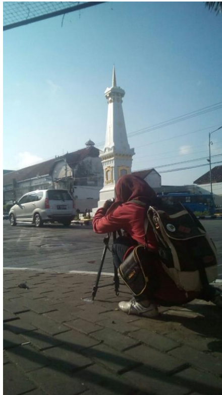
Gambar 4. Pembuatan Video Profil LPMP Pengambilan Tugu Jogja Untuk Opening Video