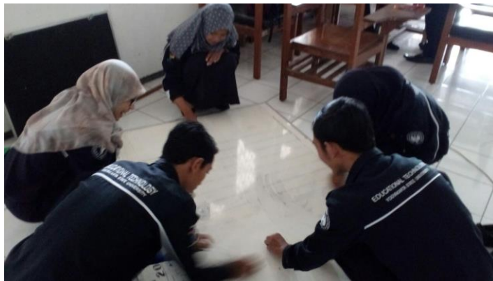
Gambar 5. Pembuatan Papan Kerja PSI