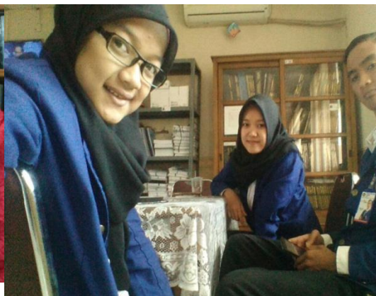
Gambar 2. Translate Bahasa Inggris Instrument Monitoring