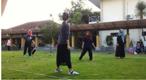
Gambar 1. Peringatan HUT RI Volly Geber