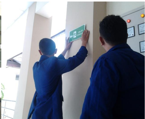
Gambar 4. Pengadaan Tanda Jalur Evakuasi