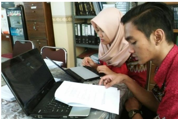
Gambar 1. Entri Data Instrumen Monitoring Awal Tahun Pelajaran Baru