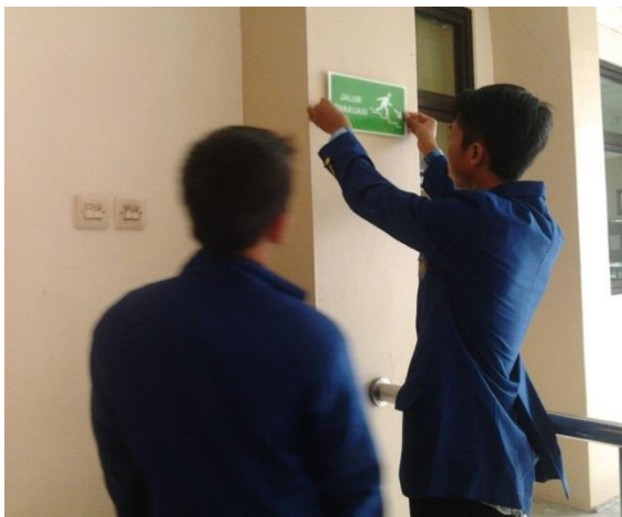
Gambar 3. Pengadaan Tanda Jalur Evakuasi Tangga