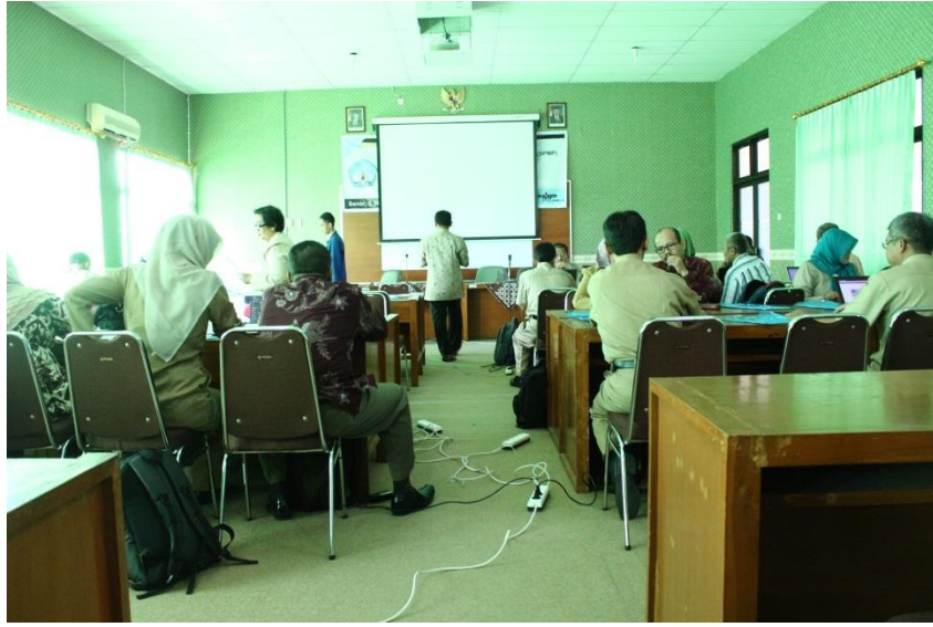
Gambar 3. Diklat Calon Fasilitator Daerah se-DIY