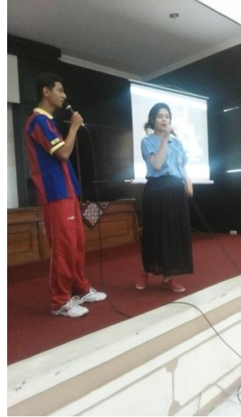
Gambar 2. Peringatan HUT RI Karaoke