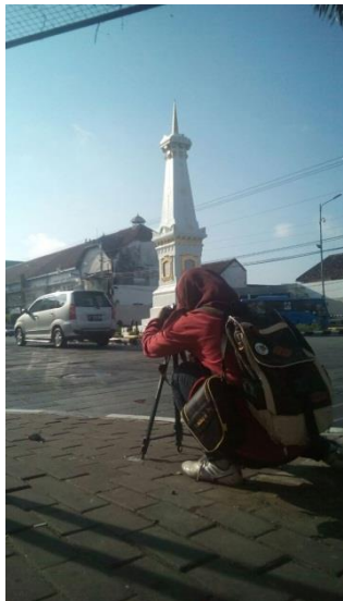
Gambar 5. Pembuatan Video Profil LPMP