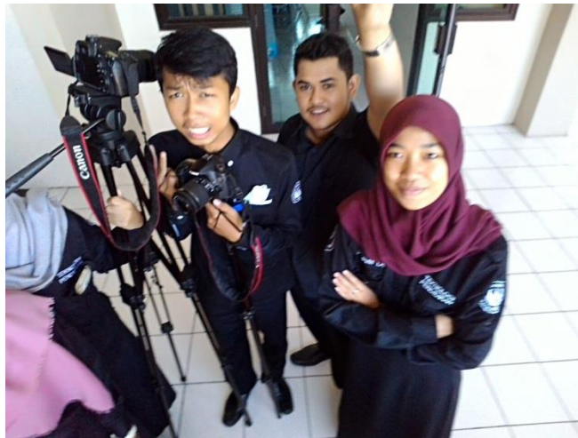
Gambar 6. Pembuatan Video Profil LPMP