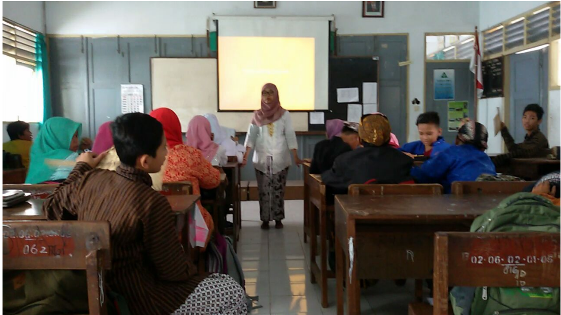
FOTO KEGIATAN PPL