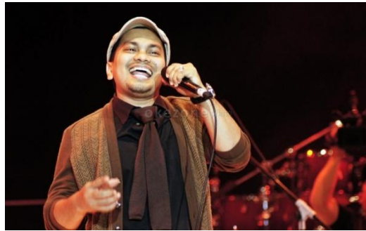
Gambar 2. Penyanyi jazz Indonesia

Pendengar lagu-lagu Jazz tidak terlalu banyak, dan biasanya dari kalangan ekonomi menengah ke atas mungkin karena lagu jenis ini biasanya dimainkan di cafe atau tempat makan menengah ke atas. Biasanya karakter vokal lagu jenis ini berkarakter berat dan harmonisasinya terdengar rumit. Memiliki tonalitas yang luas dan sering terjadi modulasi atau perpindahan tangga nada dalam sebuah lagu. Ritme dan melodinya juga memiliki kecenderungan sering berimprovisasi. Beberapa penyanyi Jazz Indonesia antara lain sebagai berikut.