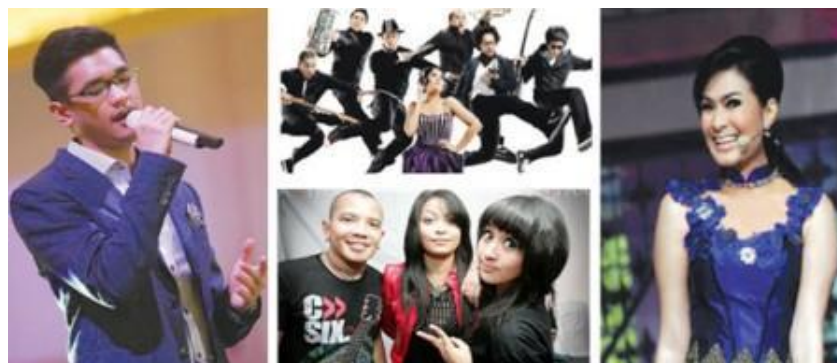
Gambar 1. Penyanyi dan grup pop Indonesia