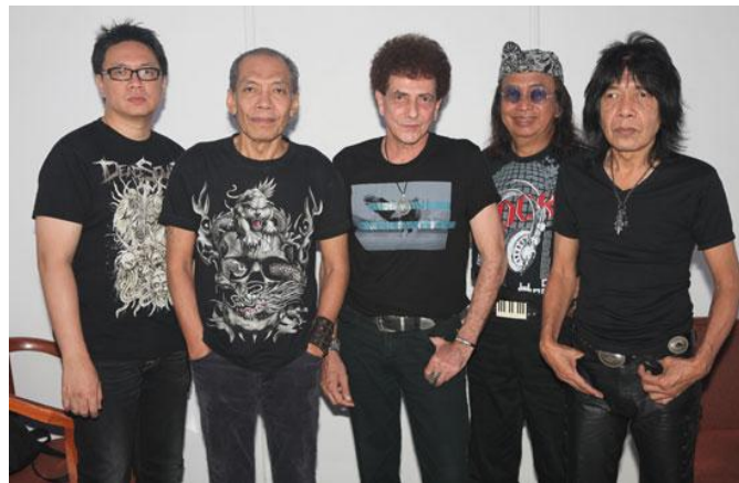
Gambar 2. Penyanyi jazz Indonesia