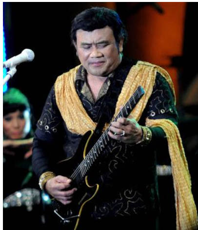
Gambar 3. Penyanyi dangdut Indonesia