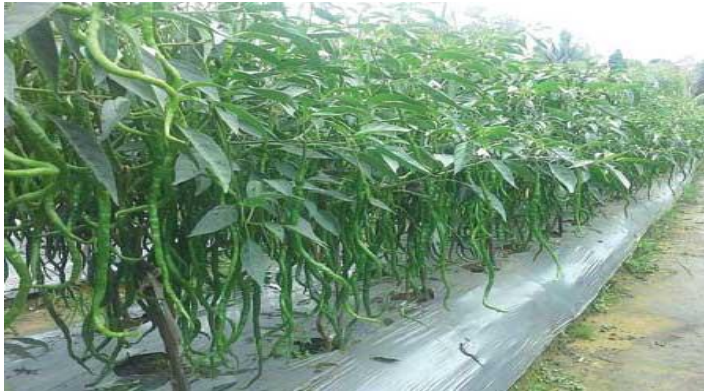
Hamparan perkebunan cabai yang tak berapa lama lagi akan dipanen.