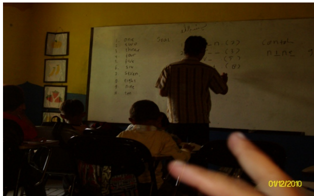
Picture 1. The English teacher was writing exercises on the whiteboard