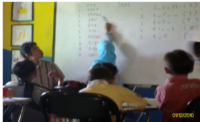
Picture 2. A student was pointing a word "three" and she asked to the teacher how to read it.