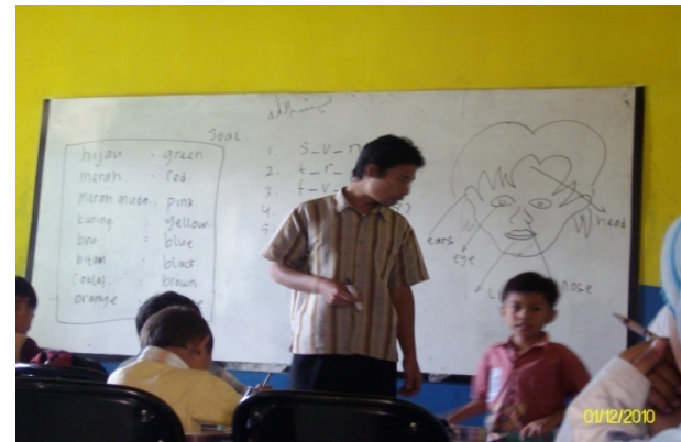
Picture 3. The teacher presented the materials by drawing and writing on the whiteboard.