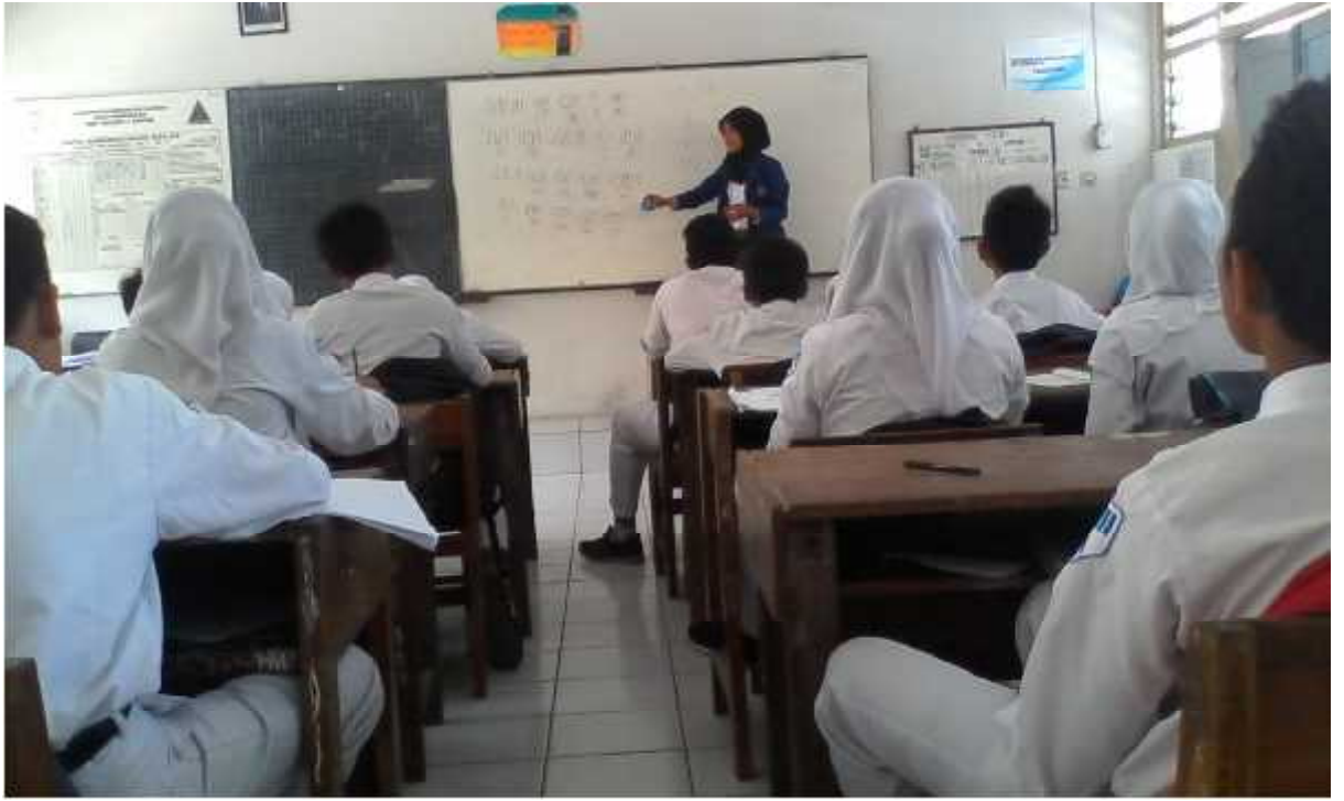
Gambar 1.3 Mengajar kelas VIII