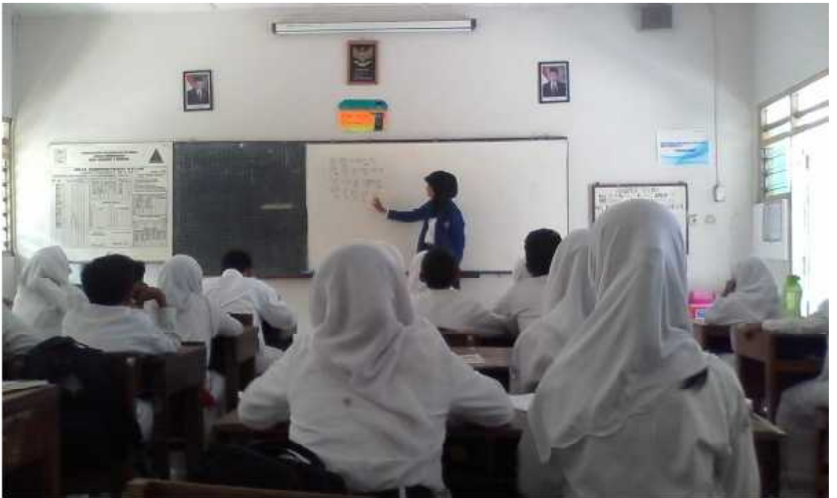
Gambar 1.1 mengajar di kelas VIII