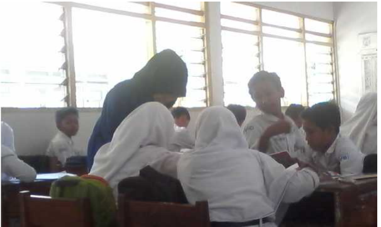
Gambar 1.2 Mengajar kelas VII