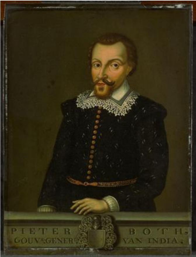
PIETER BOOTH. GOUVERN. VAN INDIA.