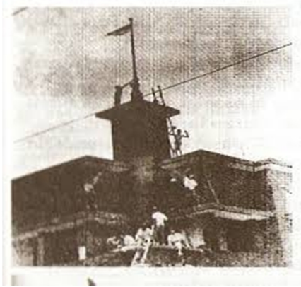
Insiden Bendera Tahun 1945 di Surabaya