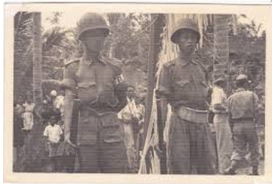
Gambar Rakyat Terlatih Ketika Melawan Jepang