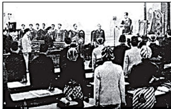
Persidangan resmi BPUPKI yang pertama pada tanggal 29 Mei-1 Juni 1945

Sidang Kedua berlangsung mulai tanggal 10 sampai dengan 17 Juli 1945. Agenda Sidang Kedua adalah pembahasan bentuk negara, wilayah negara, kewarganegaraan, rancangan undang-undang dasar, ekonomi, keuangan, pembelaan, pendidikan, dan pengajaran.