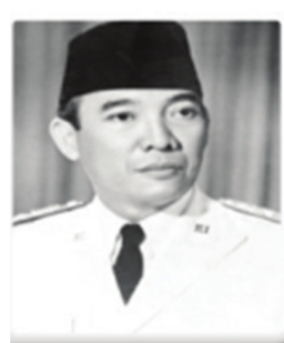
Gambar 1.4 Ir. Soekarno