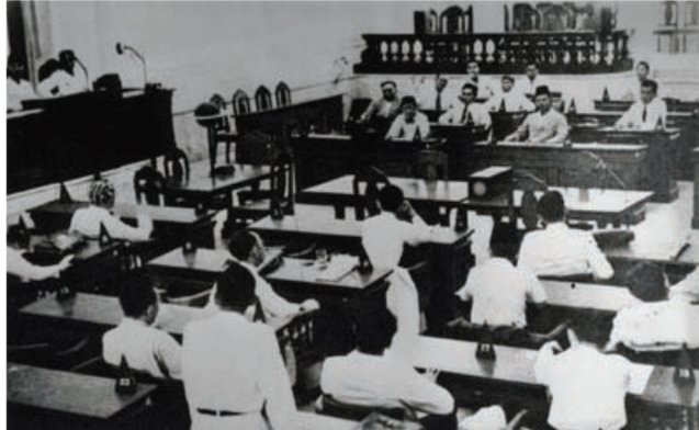
Gambar 2.2 Sidang BPUPKI

Sidang kedua BPUPKI, tanggal 10-16 Juli 1945. Dr K.R.T Radjiman Weyodiningrat selaku ketua BPUPKI menyerukan agar para anggota secara merdeka melahirkan pendapatnya dan menyampaikan pandangan-pandangannya. Sidang Kedua BPUPKI membahas penyusunan undang-undang dasar, serta rencana lain yang berhubungan dengan kemerdekaan bangsa Indonesia. BPUPKI membentuk tiga panitia kerja yaitu, (1) panitia untuk merancang undang-undang dasar, (2) panitia untuk mempelajari hal pembelaan tanah air, dan (3) panitia untuk mempelajari hal keuangan dan perekonomian.