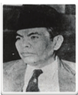
Gambar 1.3 Mr. Moh. Yamin