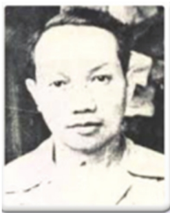
Gambar 1.2 Mr. Soepomo

Proses perumusan Pancasila pertama kali terjadi dalam sidang BPUPKI pertama 29 Mei 1945 yang membahas dasar Negara Indonesia. Menanggapi masalah itu ada tiga tokoh yang mengusulkan gagasannya tentang dasar Negara, seperti pada gambar dibawah ini: