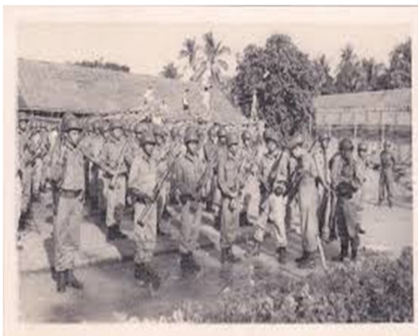
Gambar Rakyat Terlatih Ketika Melawan Jepang

Bangsa dan negara Indonesia juga lahir dari perjalanan sejarah yang telah dibangun oleh para pendiri negara dan seluruh bangsa Indonesia di masa lalu. Selama ratusan tahun Belanda menjajah Indonesia. Sejarah juga mencatat kekalahan Belanda oleh Jepang kemudian menyebabkan bangsa Indonesia dijajah oleh Jepang. Pepatah “lepas dari mulut harimau, masuk ke mulut buaya” tepatlah kiranya untuk menggambarkan bagaimana kondisi bangsa Indonesia saat itu. Jepang mulai menguasai Indonesia setelah Belanda menyerah kepada Jepang di Kalijati, Subang Jawa Barat pada tanggal 8 Maret 1942. Semboyan “Jepang Pelindung Asia, Jepang Pemimpin Asia, dan Jepang Cahaya Asia” didengungkan oleh Jepang untuk menarik simpati rakyat Indonesia. Sejak berkuasa di Indonesia, Jepang dengan segala cara menguras kekayaan dan tenaga rakyat Indonesia yang menimbulkan kesengsaraan bagi rakyat Indonesia.