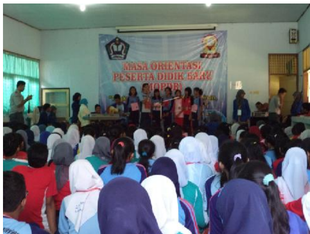
Gambar 11. MOPDB