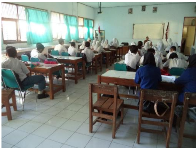
Gambar 5. Observasi