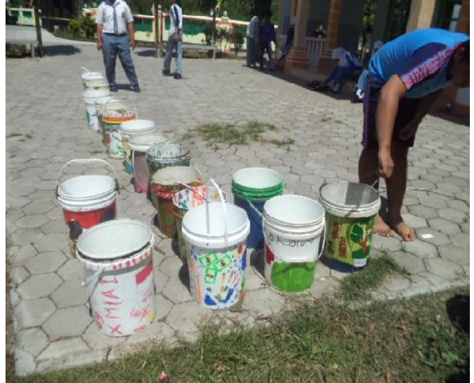
Gambar 8. Lomba Lukis tong sampah (HUT RI)