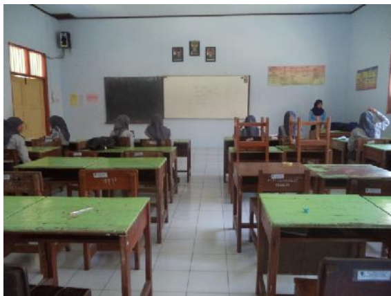
Gambar 9. Zusammen lernen