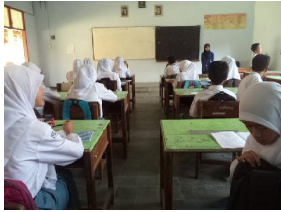
Gambar 2. Proses KBM