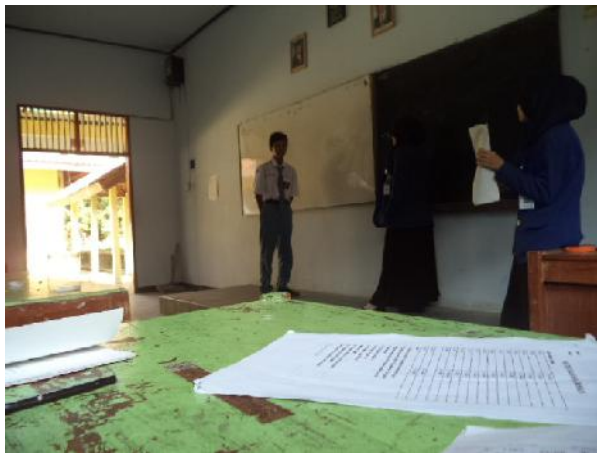
Gambar 3. Proses Penilaian