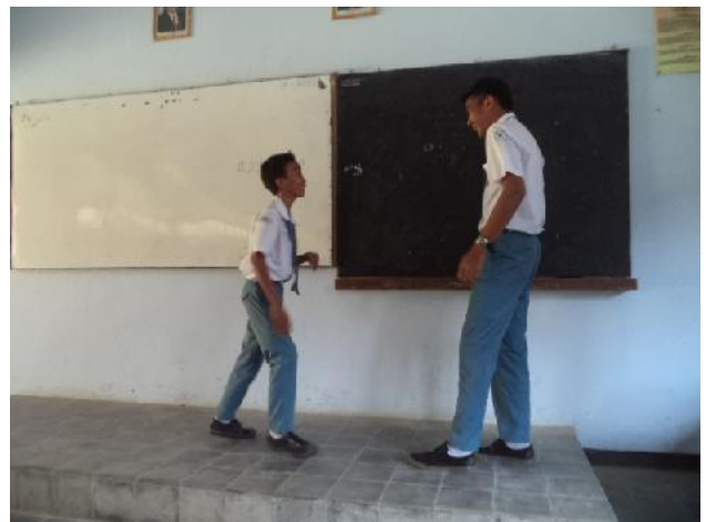
Gambar 4. Proses Penilaian