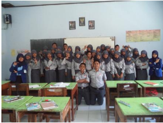
Gambar 1. Kelas X IBB