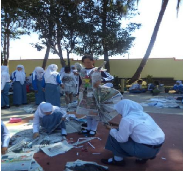
Gambar 7. Lomba kreasi koran (HUT RI)