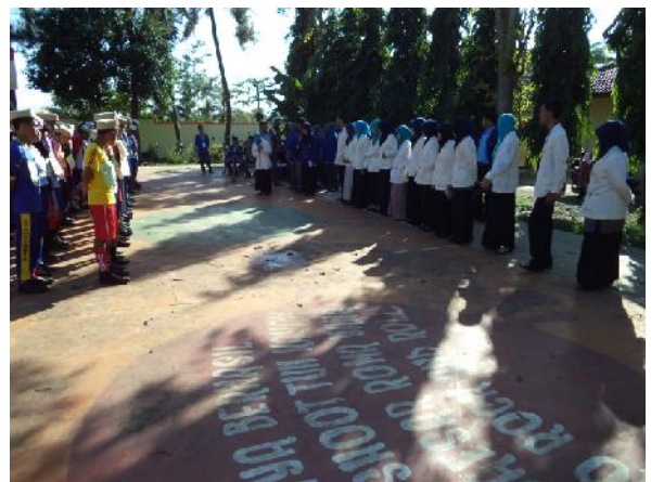
Gambar 12. MOPDB