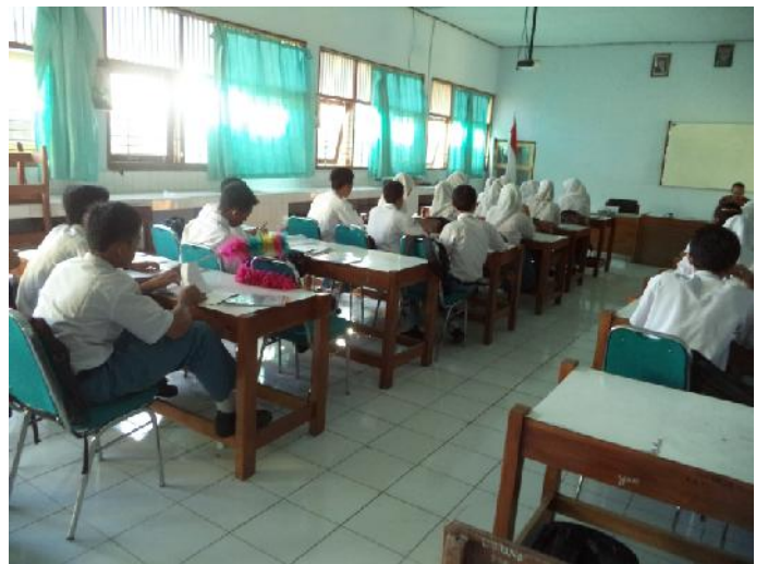
Gambar 6. Observasi