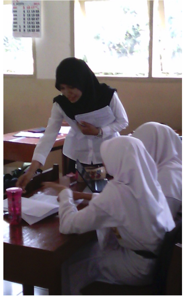
Mengajar Kelas VIII C