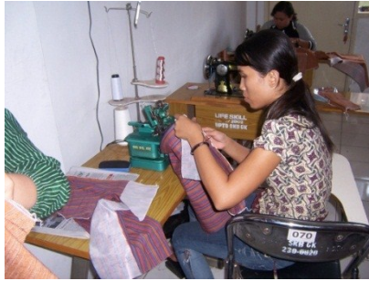
Kegiatan kursus bordir di SKB Gunungkidul

Saat ini, UPT SKB Gunungkidul sedang merintis mitra kerjasama untuk memperluas jaringan khususnya di bidang bordir.