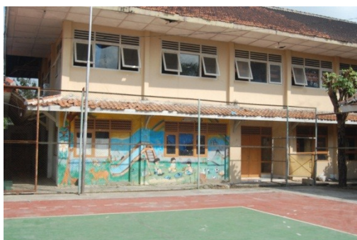
Gedung Asrama dan Gedung PAUD