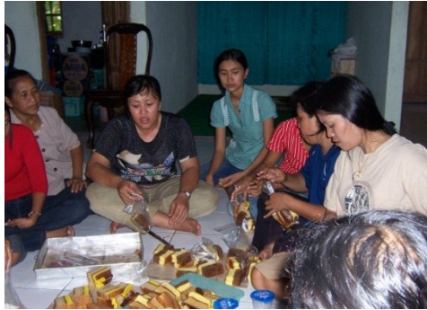
Kegiatan Kursus Tata Boga di SKB Gunungkidul