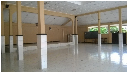
Aula Bagian Dalam