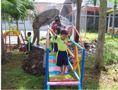
Kegiatan bermain di KB Handayani

dan swadaya masyarakat. Adapun lembaga-lembaga yang menjadi mitra KB Handayani adalah HIMPAUDNI, Forum PAUD, SLB, Dinas Kesehatan, PKK, BPKB, dan P2PNFI.