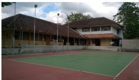
Gedung Kantor, Gedung Belajar, dan Lapangan