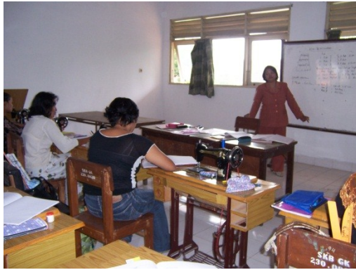
Kegiatan kursus menjahit di SKB Gunungkidul