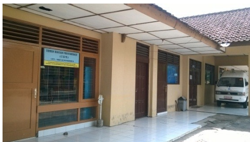
Taman Bacaan Masyarakat dan Mobil Taman Bacaan Masyarakat