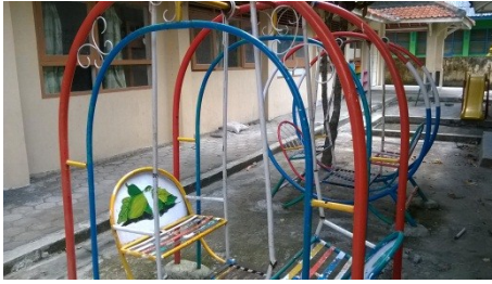
Alat Permainan Edukatif Luar