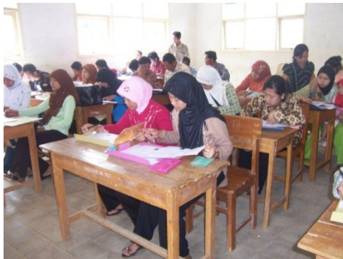
Kegiatan pembelajaran program kesetaraan Di SKB Gunungkidul

Penilaian pendidikan kesetaraan ini meliputi penilaian penyelenggaraan dan penilaian hasil belajar. Penilaian hasil belajar dilakukan menggunakan tes sumatif dan tes formatif. Sedangkan sumber dana penyelenggaraan pendidikan kesetaraan di SKB Gunungkidul berasal dari Swadaya untuk kelas X, APBD untuk kelas XI, dan APBN untuk kelas XII.