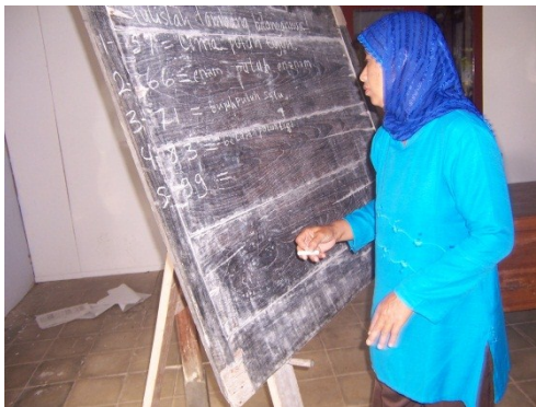
Kegiatan pembelajaran keaksaraan di SKB Gunungkidul