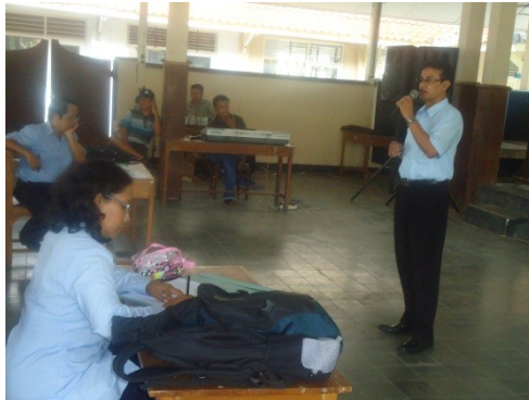
Kegiatan program lifeskills kursus vokal Di SKB Gunungkidul

pertemuan UPT SKB Gunungkidul. Dalam kursus vokal peserta mampu mengetahui teknik-teknik vokal yang benar dan baik, selain itu warga belajar juga dapat menyanyikan lagu dengan benar sesuai dengan teknik – teknik vokal yang di harapkan, baik lagu kerondong, dangdut maupun campur sari. Adapun manajemen pembiayaan (sumber dana dan pengelolaan dana) di peroleh dari APBD, peserta tidak di pungut biaya (gratis). Kursus vokal ini menajalin kerjasama dengan komunitas atau paguyuban seniman-seniwati Gunungkidul serta studio recording SRGK dan Free Production Gunungkidul.