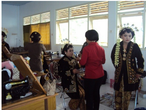
Kegiatan Tata Rias dan potong rambut Di SKB Gunungkidul

meningkatkan kesejahteraan warga masyarakat khususnya yang belum memperoleh pekerjaan. SKB Gunungkidul menerima warga belajar sebanyak 20 orang untuk setiap kursus. Proses pembelajaran dilakukan selama 15 kali pertemuan dengan waktu tiga jam per pertemuan. Dalam pelaksanaannya, SKB Gunungkidul bekerja sama dengan Salon Diawan. Sebagai mitra kerja, pelaksanaan, sarana, dan prasarana dilaksanakan di salon tersebut. Selain itu warga belajar juga dibekali dengan beberapa perlalatan penunjang seperti gunting, sisir, dan handuk. SKB Gunungkidul tidak memungut biaya bagi masyarakat yang berminat mengikuti kursus (gratis).