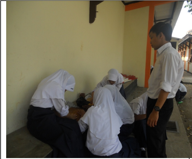
Gambar 1.1 Proses kegiatan Praktik keramik diluar kelas