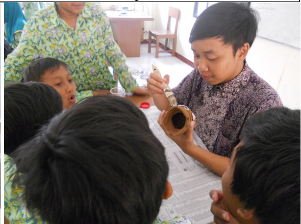
Gambar 1.4 Proses interaksi dengan siswa di dalam kelas