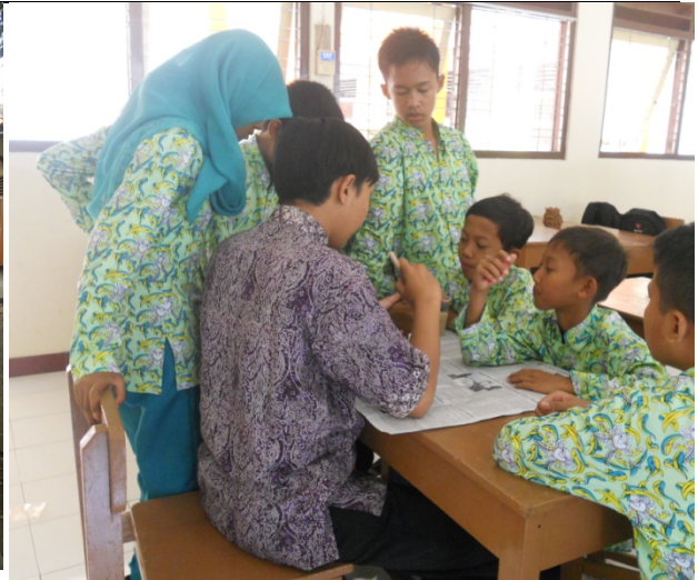
Gambar 1.2 Proses Finishing pembuatan kerajinan keramik teknik pilin di dalam kelas