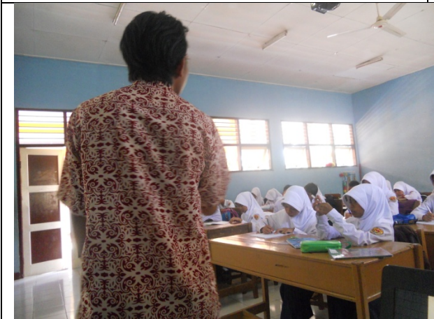
Gambar 1.3 Penyampaian materi di dalam kelas