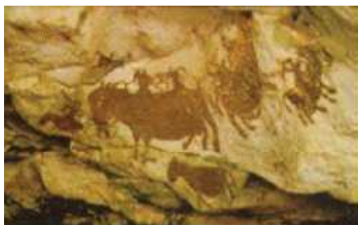
Gambar perburuan pada dinding gua.

Gambar merupakan bahasa yang universal dan dikenal jauh sebelum manusia mengenal tulisan. Gambar sudah dikenal masyarakat sejak zaman purba. Pada saat itu, gambar sering dihubungkan dengan aktivitas manusia dan roh leluhur yang dianggap memberi keberkahan dan perlindungan. Bagi manusia purba, gambar tidak sekedar sebagai alat komunikasi untuk roh leluhur saja, tetapi juga memberikan kekuatan dan motivasi untuk dapat bertahan hidup. Menggambar tidak hanya melibatkan aktivitas fisik semata tetapi juga mental. Aktivitas fisik berhubungan dengan keterampilan menggunakan peralatan menggambar sedangkan mental berhubungan dengan rasa, karsa, dan daya cipta untuk memenuhi kebutuhan hidupnya. Manusia dalam melakukan aktivitas menggambar memerlukan media, alat serta bahan yang senantiasa berubah sesuai dengan perkembangan zaman. Jika pada zaman purba manusia menggambar dengan menggunakan bahan yang tersedia di alam maka pada zaman sekarang peralatan menggambar telah diproduksi oleh pabrik sebagai komoditas ekonomi. Manusia melalui menggambar dapat menyampaikan gagasan, ide, serta simbol sebagai salah satu bentuk ekspresi. Jadi menggambar merupakan salah satu sarana untuk mengekspresikan diri.