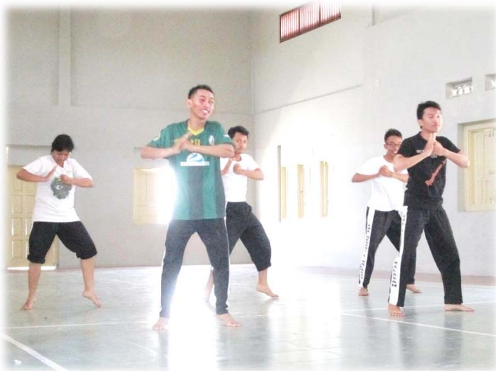
Gambar 3. Penilaian teknik dan hafalan siswa kelas XII IPS 1