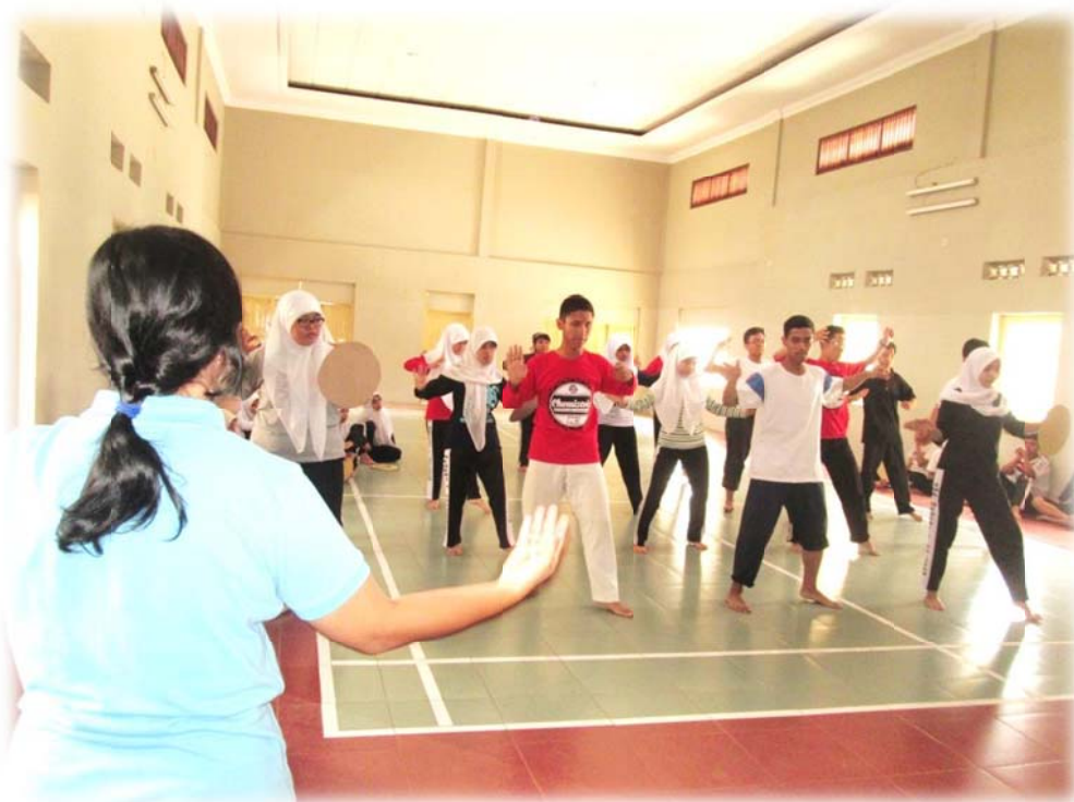
Gambar 4. Ibu Guru pendamping memberikan pengarahan