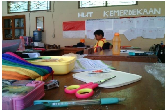
Gambar 2. Fatchu saat teman yang lain sedang istirahat