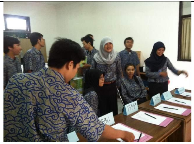
Pelatihan Kurikulum 2013 untuk Kepala Sekolah