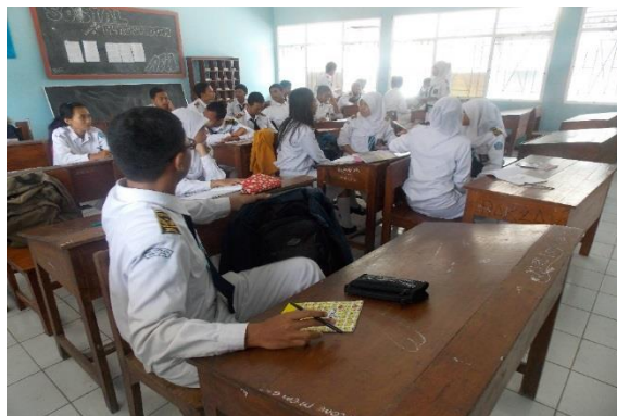
SUASANA PEMBELAJARAN KELAS XI IIS DI DALAM KELAS