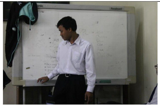
Pelatihan Kurikulum 2013 untuk Kepala Sekolah