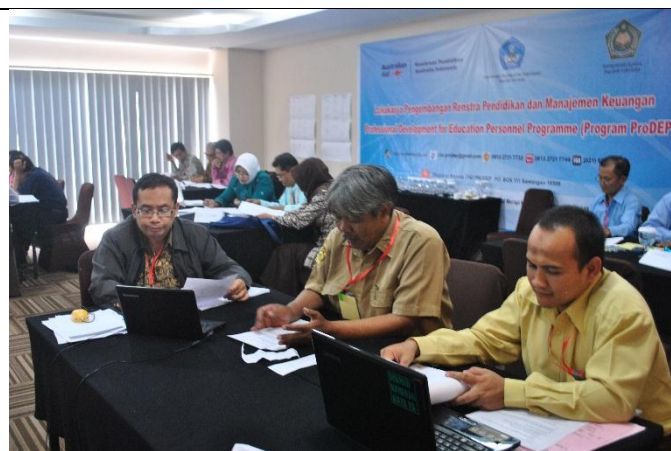
Pengelompokan Lembar Kerja Diklat