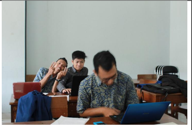
Pendampingan Diklat ProDEP