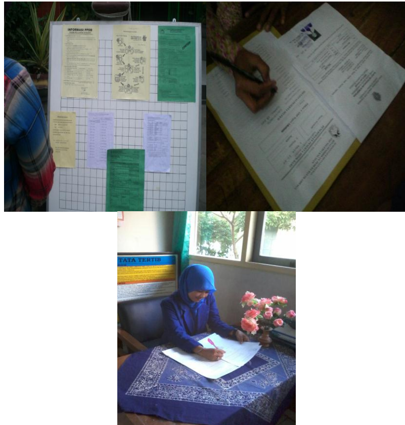
PPDB (Penerimaan Peserta Didik Baru) SMP N 2 Kalasan