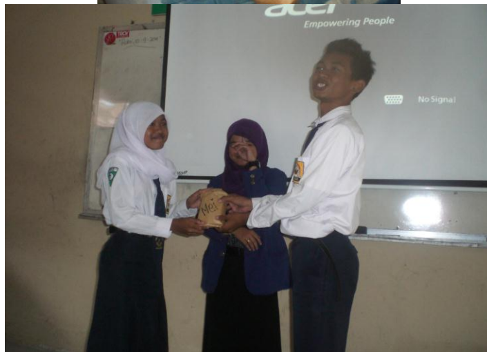
Pemberian Reward untuk Siswa-siswa yang mendapatkan nilai terbaik