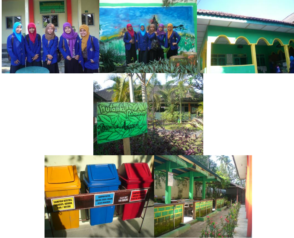
Observasi Lingkungan sekitar SMP N 2 Kalasan