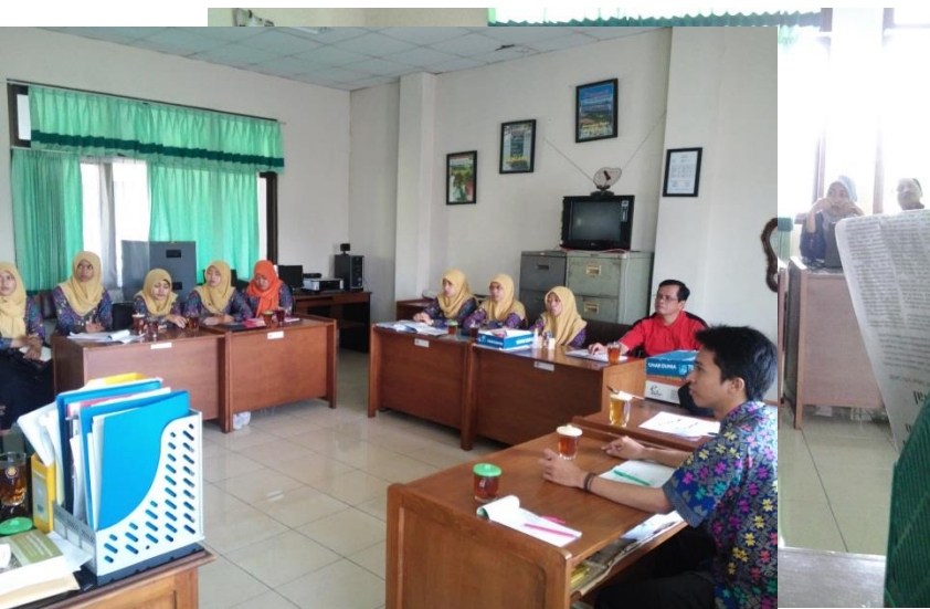
Gambar 2. Diskusi Bersama Pegawai Lab. PEKSOS