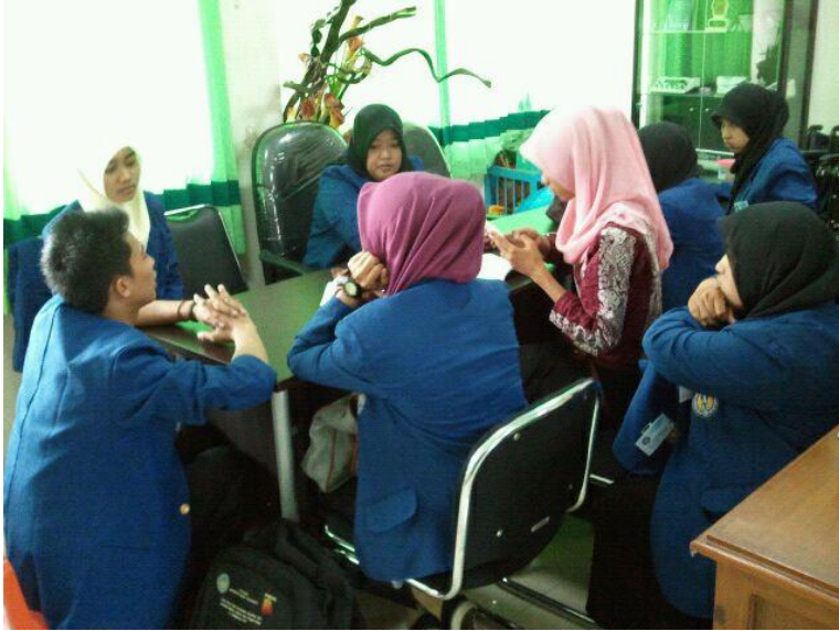
Gambar 3. Diskusi Kelompok di Lab. PEKSOS