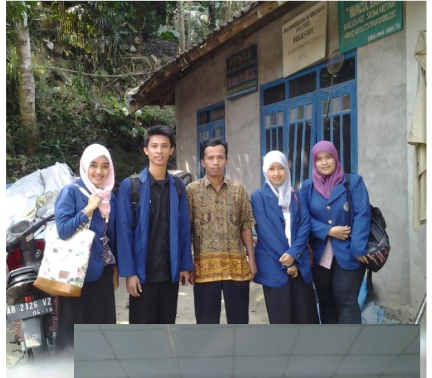
Gambar 1. Pengumpulan Data di Lapangan