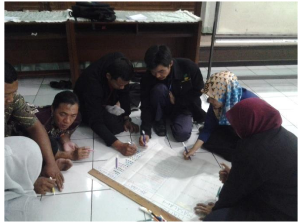
Gambar 2: kegiatan ice breaking DIKLAT TKS