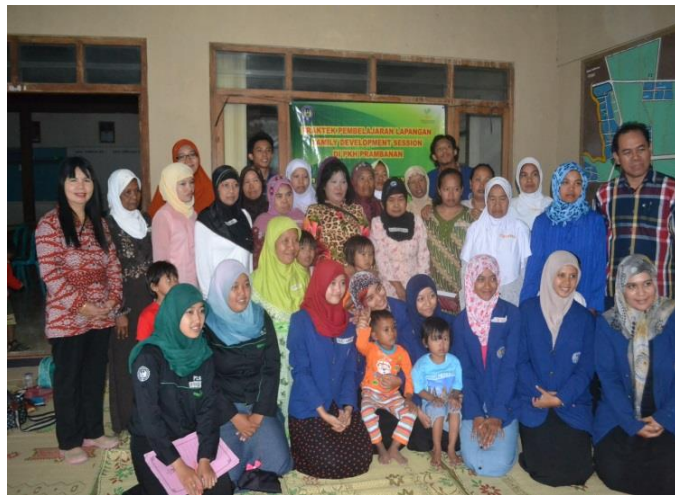
Kegiatan pembelajaran FDS sesi 2 Minggu, 7 September 2014