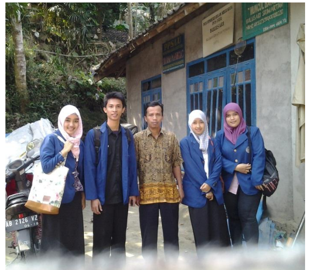
Gambar 1. Pengumpulan Data di Lapangan