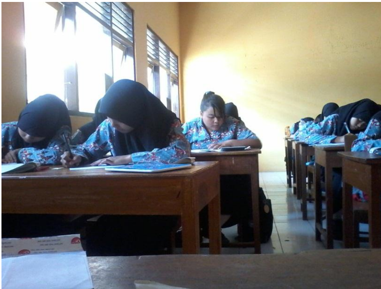
Gambar 3 : Saat pelaksanaan ulangan harian