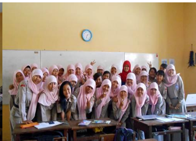
Gambar 6 : Praktikan bersama dengan siswa kelas XI AK 2