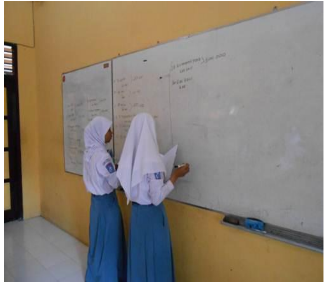
Gambar 2 : Aktifitas siswa mengerjakan soal di papan tulis