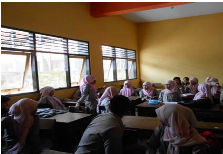
Gambar 5 : Antusias siswa saat dilaksanakan team games tournament