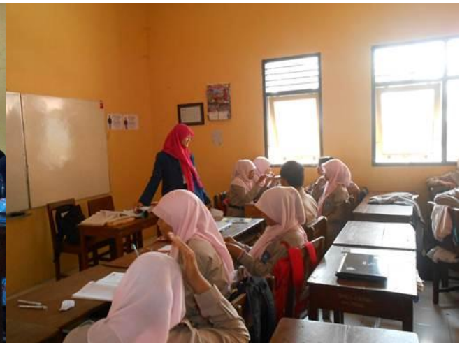
Gambar 4 : Kegiatan pembelajaran di kelas