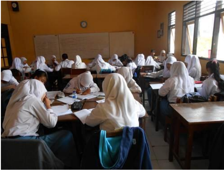
Gambar 1 : Pelaksanaan pembelajaran dengan pemberian tugas kelompok