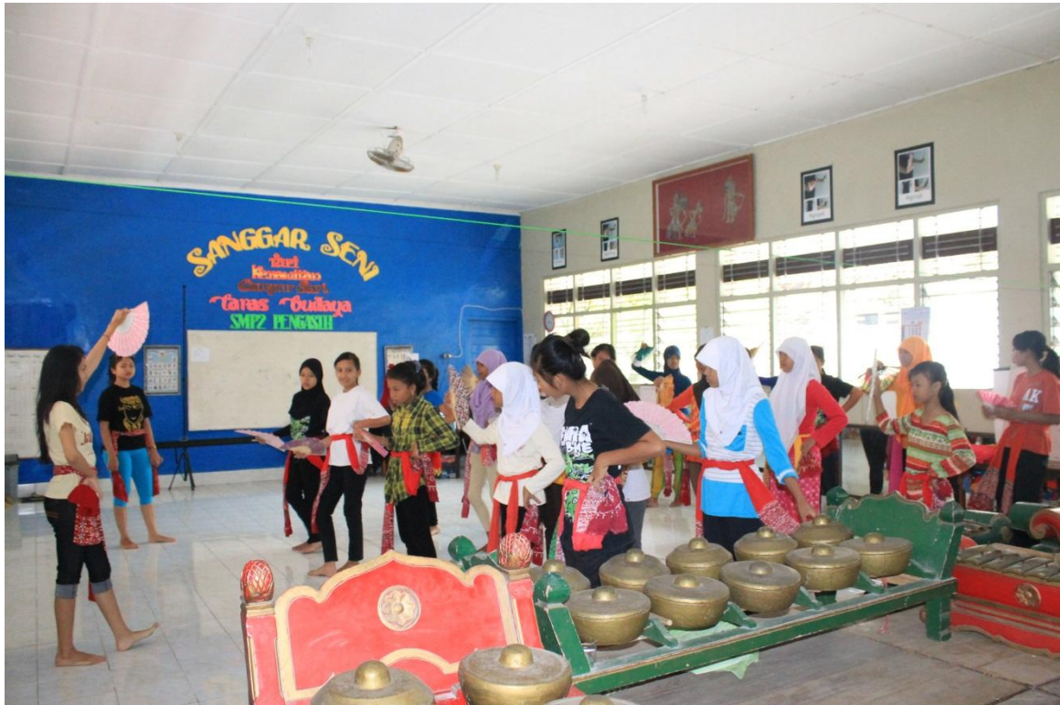
Pendampingan Ekstrakurikuler Tari SMP N 2 Pengasih