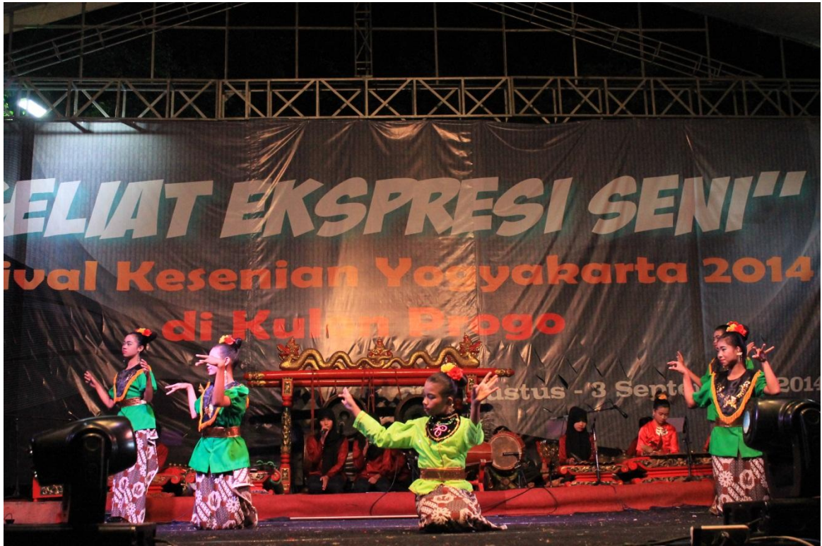
Pementasan Tari Prahau Layar, acara FKY Kulon Progo