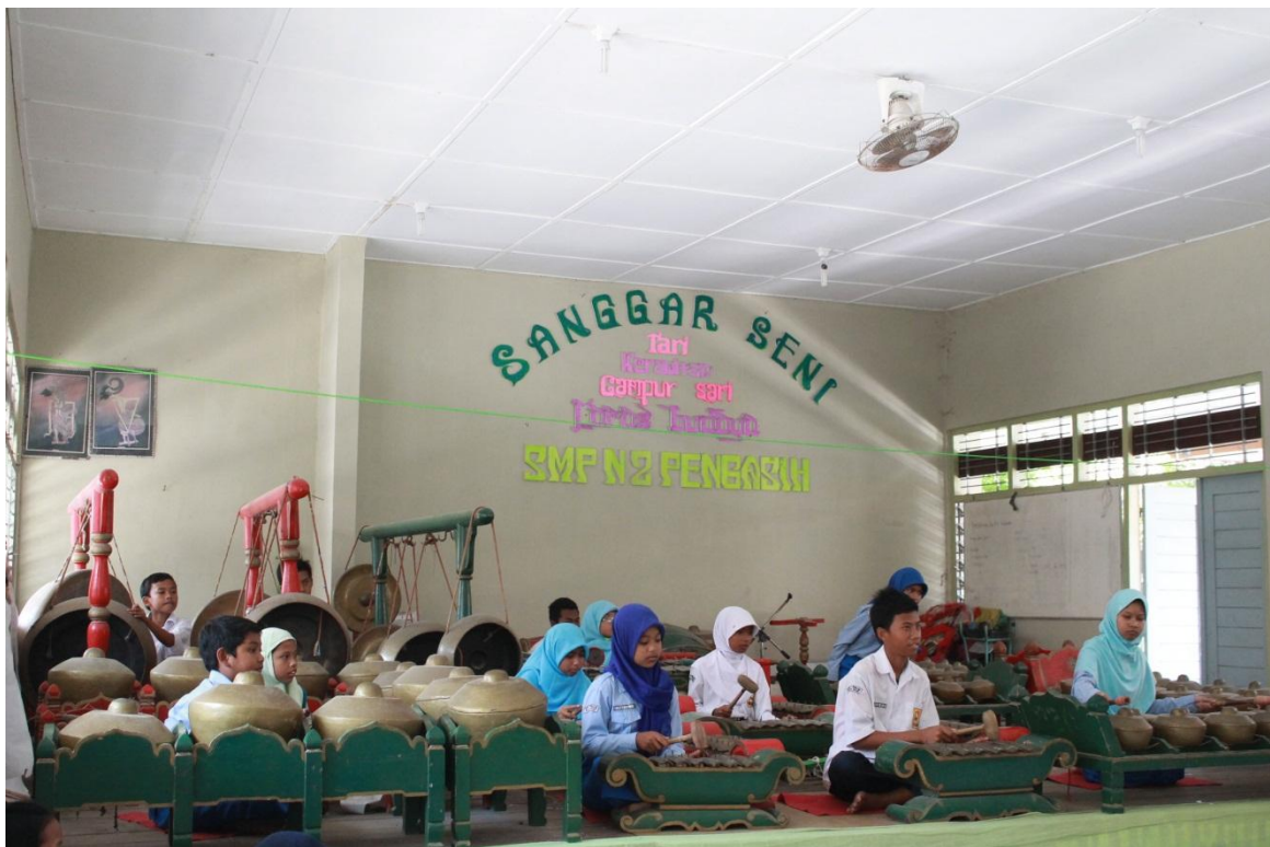
Pendampingan Ekstrakurikuler Karawitan SMP N 2 Pengasih