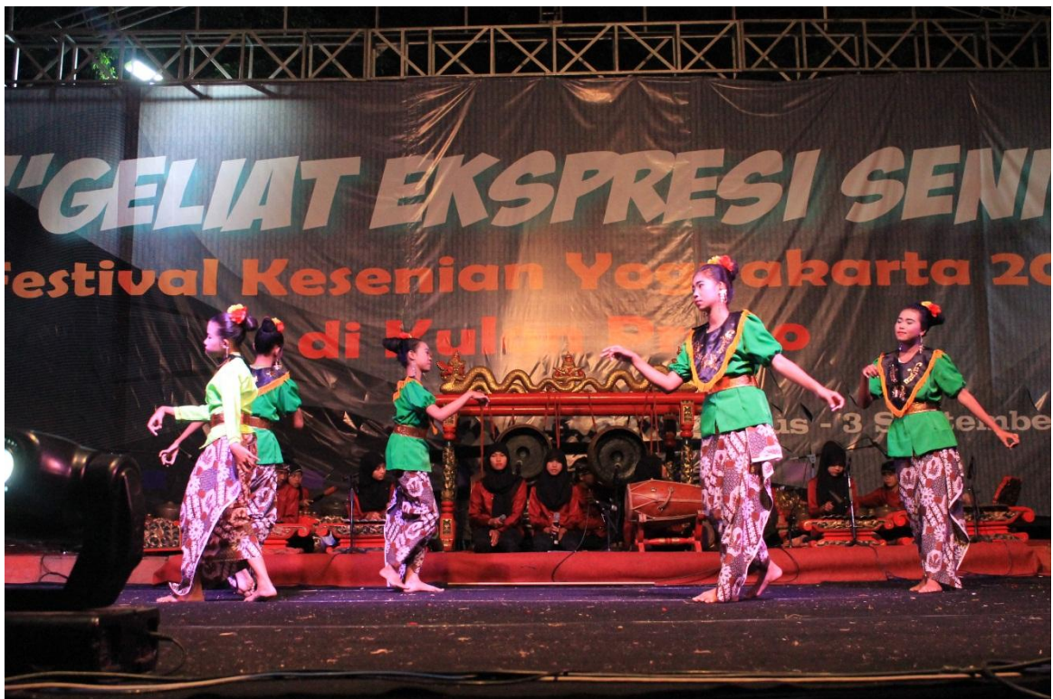
Pementasan Tari Prahau Layar, acara FKY Kulon Progo