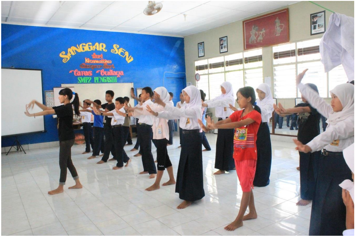
Proses KBM Ekspresi "Tari Rudat"