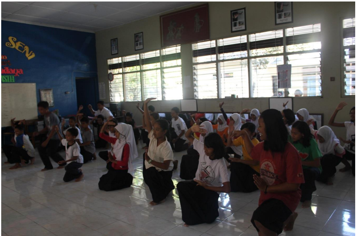
Siswa melakukan praktek Tari Rudat