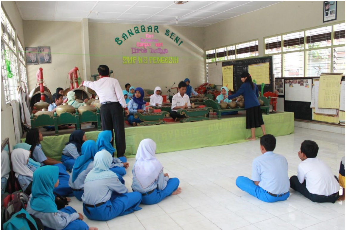
Pendampingan Ekstrakurikuler Karawitan SMP N 2 Pengasih