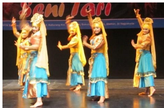
Gambar 9 menunjukkan gerak berdiri dengan gerakan tertah di lantai memberi kesan ringan sehingga tenaga yang digunakan lebih ringan juga