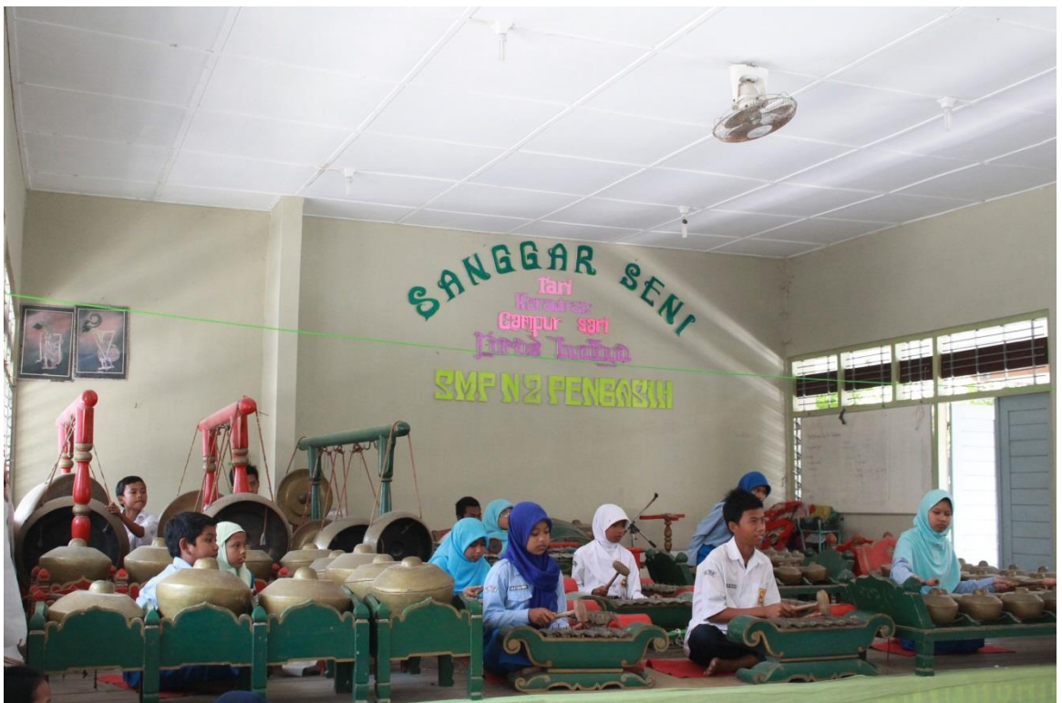
Pendampingan Ekstrakurikuler Karawitan SMP N 2 Pengasih