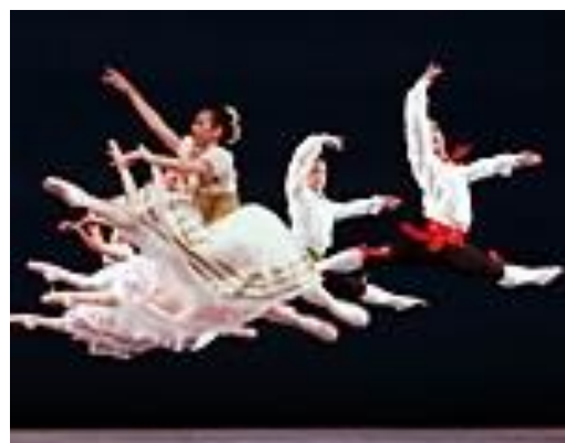
Gambar 7 gerak melayang bersama-sama memerlukan ketepatan waktu secara bersamaan