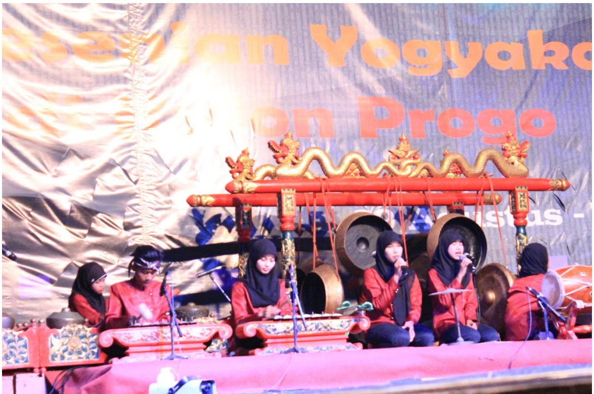
Pentas sanggar seni "Laras Budaya" di alun-alun Wates