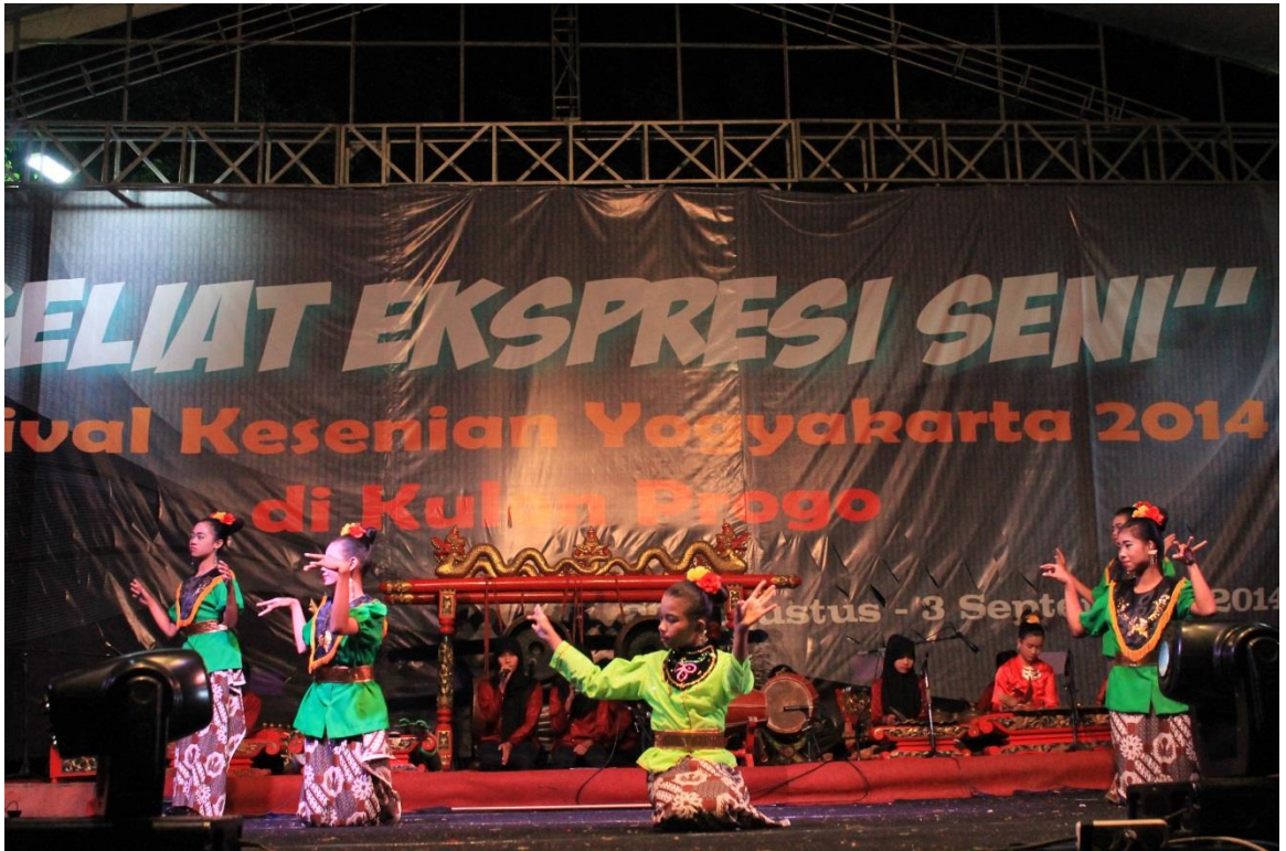
Pementasan Tari Prahua Layar, acara FKY Kulon Progo