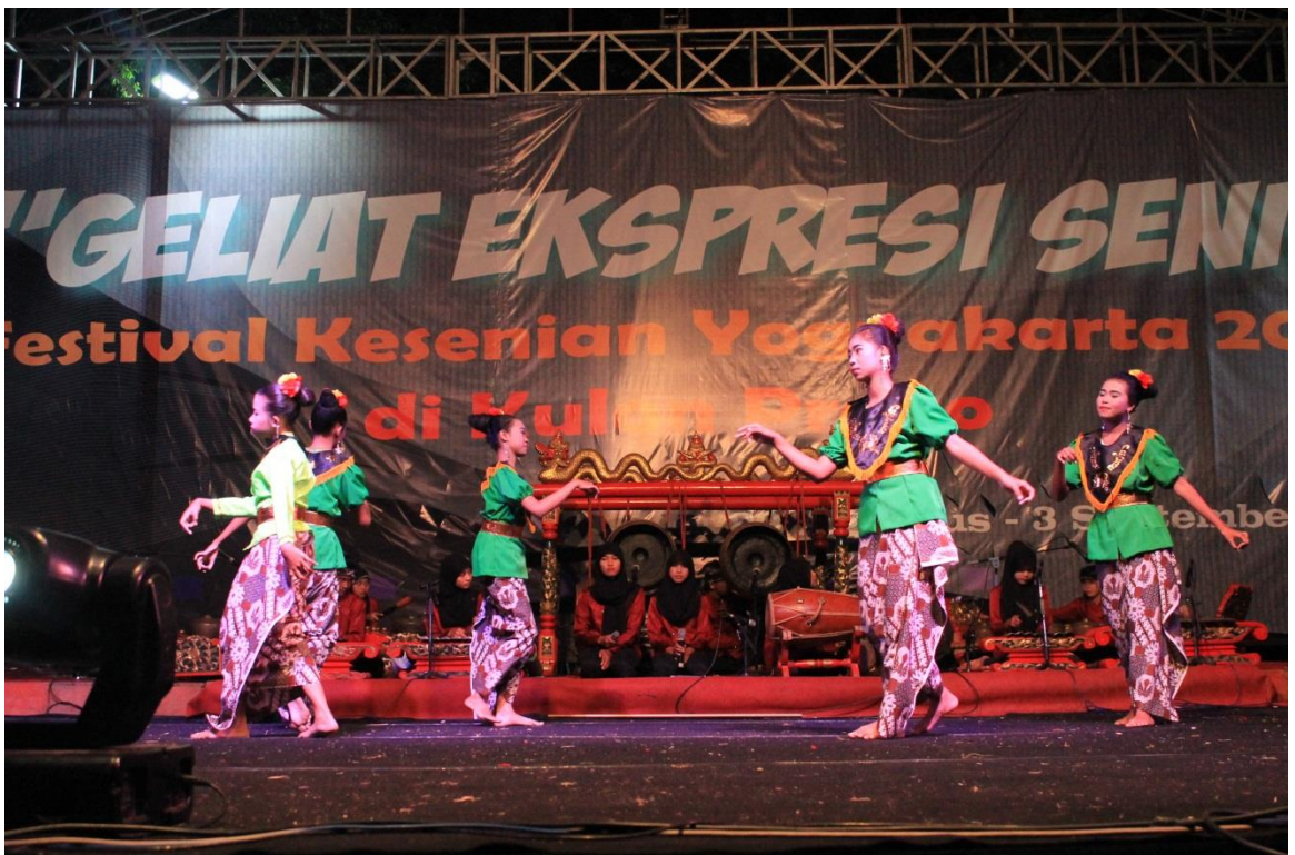
Pementasan Tari Prahua Layar, acara FKY Kulon Progo