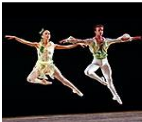
gambar 6 penari dengan gerak melayang memerlukan waktu saat tumpuan dan melayang sampai turun ke lantai kembali

Perbedaan cepat atau lambat gerak berhubungan dengan tempo. Jadi tempo merupakan cepat atau lambat gerak yang dilakukan. Gerak tari juga memiliki tempo. Fungsi tempo pada gerak tari untuk memberikan kesan dinamis sehingga tarian enak untuk dinikmati.