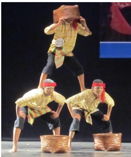
Gambar 8 menunjukkan gerak melompat ke atas punggung memerlukan tenaga lebih kuat untuk memberi kesan dan karakter gerak lebih dinamis demikian juga yang menjadi pijakan

Tenaga yang dikeluarkan oleh kedua penari yang menyangga temannya akan semakin kuat jika berjalan berpindah dari satu tempat ke tempat lainnya. Coba kalian bandingkan dengan pose gerak pada gambar 9 yang menunjukkan kaki tertahan di lantai dengan sedikit jinjit tentu tenaga yang dikeluarkan tidak sebesar dan sekuat pada gambar 8.