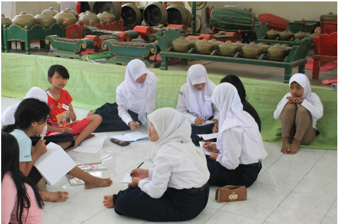
Diskusi mengenai Tari Rudat