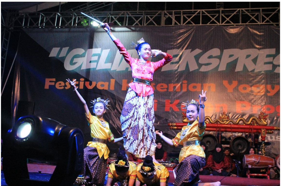
Pementasan Tari Nyi Ageng Serang,, FKY Kulon Progo, Alun-alun Wates