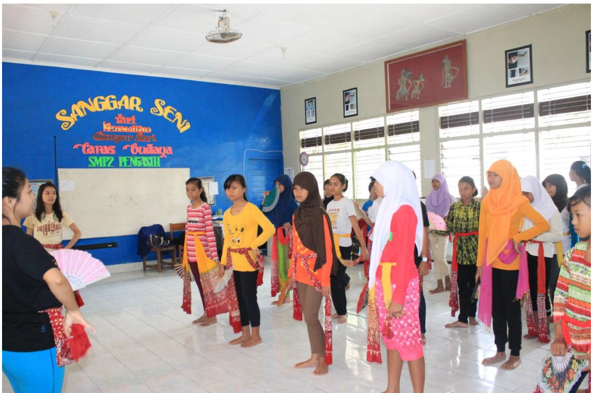
Pendampingan Ekstrakurikuler Tari SMP N 2 Pengasih