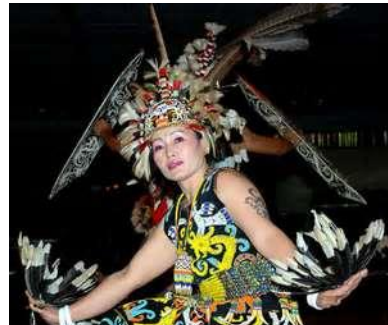
Gambar tarian kalimantan menggunakan tenaga ang lebih konstan dalam melakukan gerak