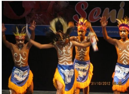
Gambar tarian papua banyak menggunakan energi dalam melakukan gerak

Gerak tari yang bersumber pada tari tradisi Papua kekuatan tenaga banyak pada kaki. Gerak kaki yang cepat dan ritmis merupakan salah satu ciri dari tarian Papua. Gerak tari yang tertumpu pada kaki di Papua dipengaruhi oleh kondisi geografis alam yang berbentuk pegunungan. Kehidupan masyarakat di daerah pegunungan memerlukan kaki kuat untuk dapat mendaki dan menuruni bukit. Kehidupan sosial budaya seperti inilah yang mempengaruhi juga terhadap karya seni tari.