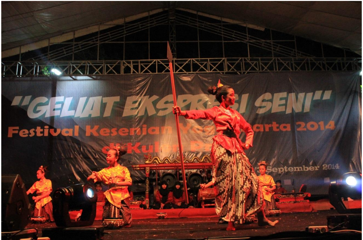
Pementasan Tari Nyi Ageng Serang,, FKY Kulon Progo, Alun-alun Wates