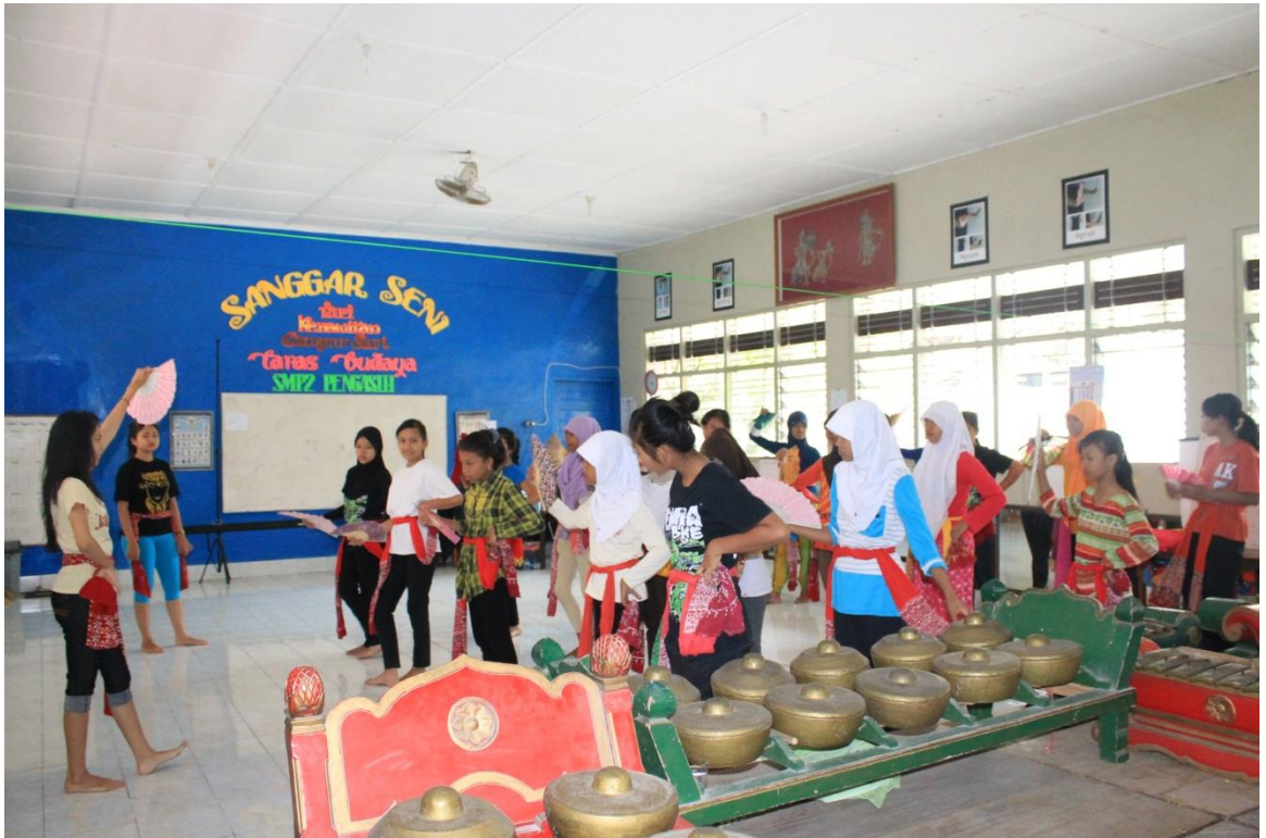
Pendampingan Ekstrakurikuler Tari SMP N 2 Pengasih