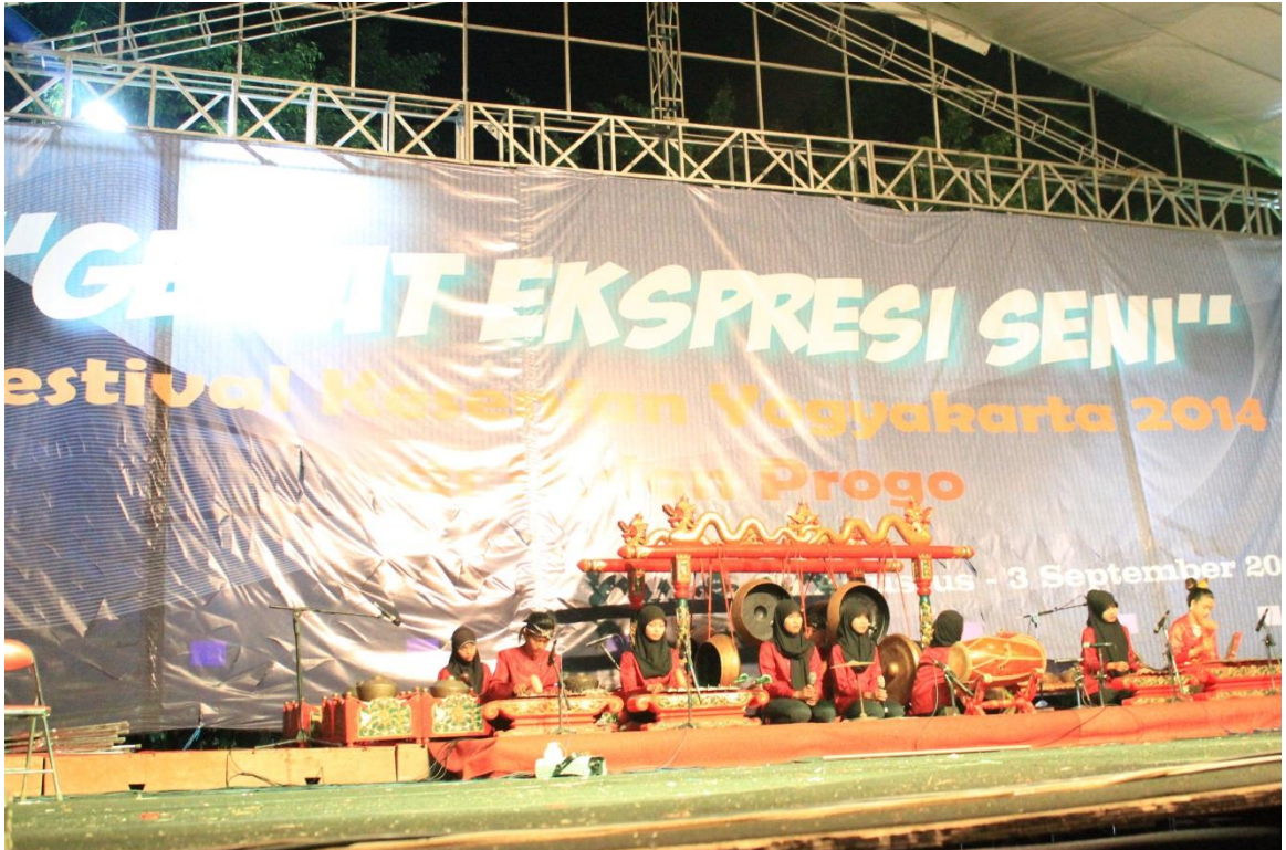
Pentas sanggar seni "Laras Budaya" di alun-alun Wates