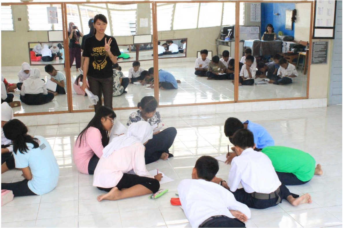
Siswa melakukan diskusi dan pengamatan