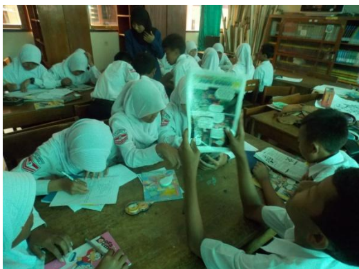
Mengajar kelas VIII D