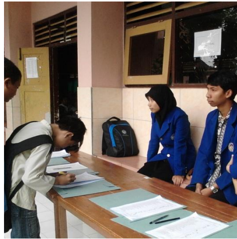
Mengawasi Presensi kehadiran siswa pesantren kilat