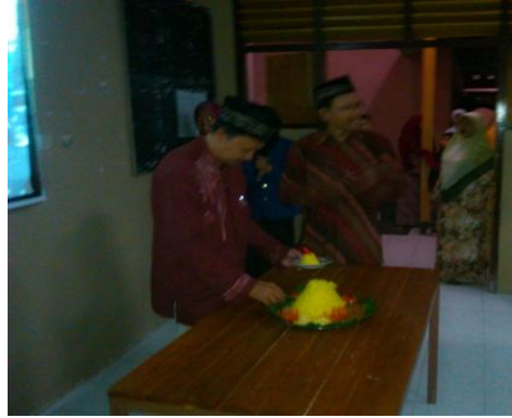
Acara peringatan HUT Sekolah dengan pemotongan tumpeng