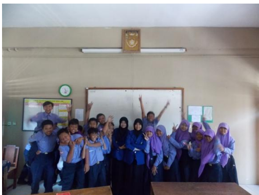
Kelas VII D