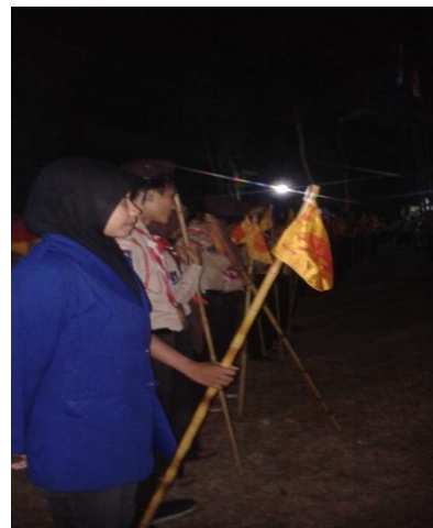
Kemah Terpadu SMP N 1 Minggir