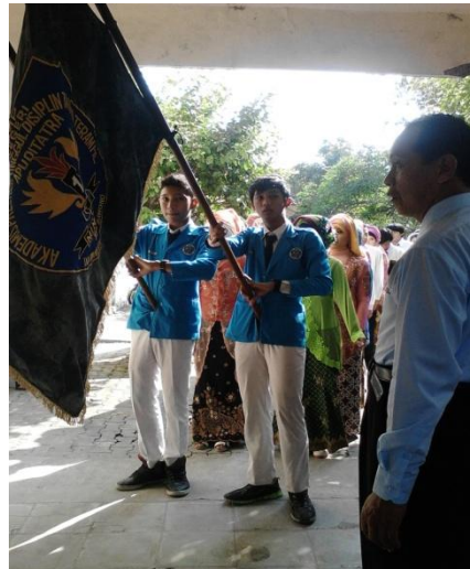
Pelepasan kelas IX SMP N 1 Minggir