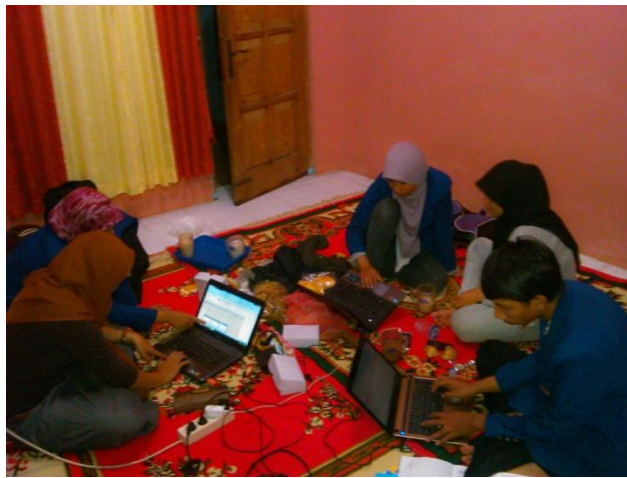
Rapat Rutin PPL