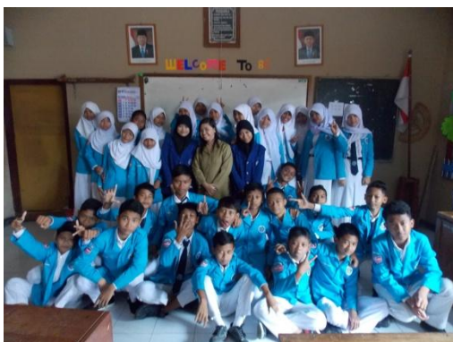
Kelas VIII C