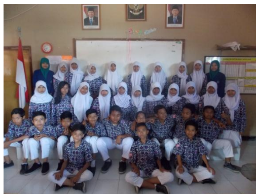
Kelas VIII D