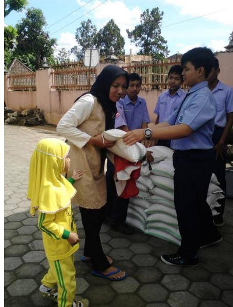
Pembagian zakat kepada orangtua siswa SMP N 1 Minggir