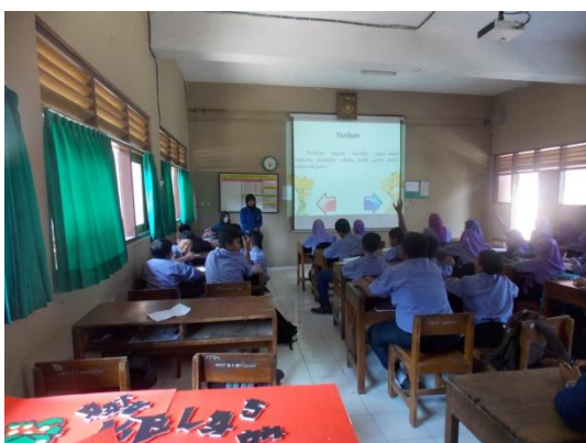
Mengajar kelas VII D