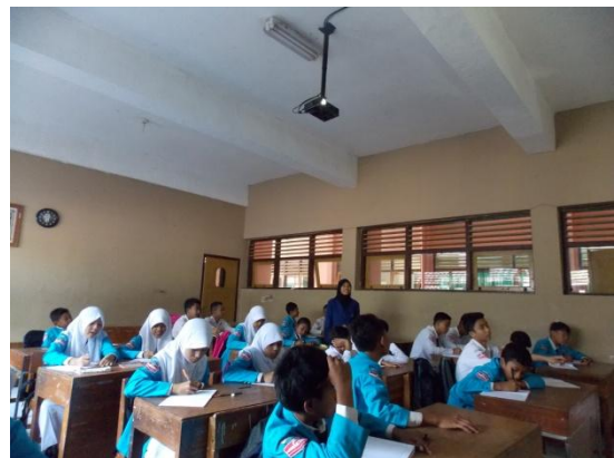
Mengajar kelas VIII C