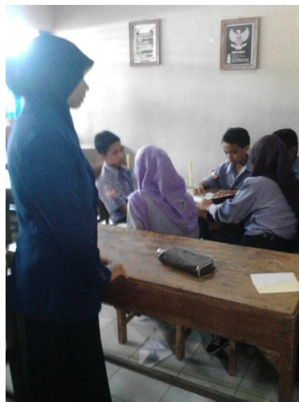
Mengajar Bahasa Jawa Kelas VIII A