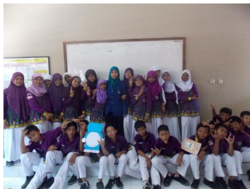
Kelas VII E