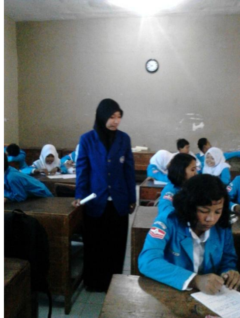
MPLS SMP N 1 Minggir