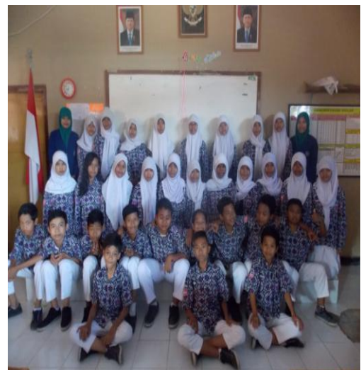
Kelas VIII D