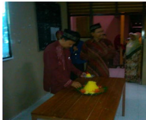
Acara peringatan HUT Sekolah dengan pemotongan tumpeng