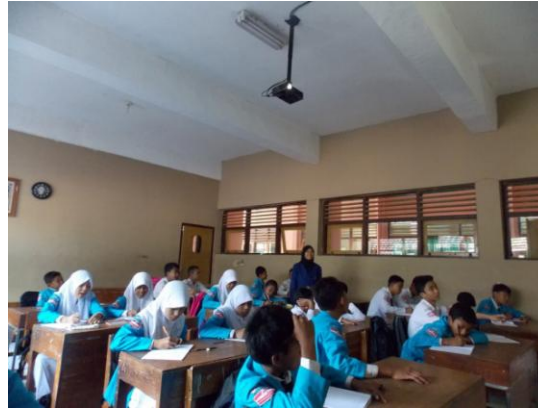
Mengajar kelas VIII C