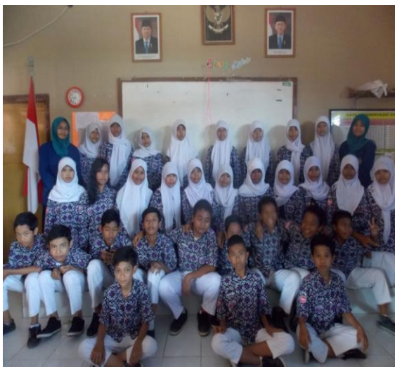
Kelas VIII C