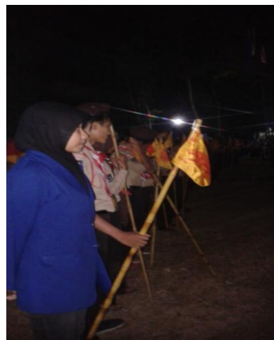
Kemah Terpadu SMP N 1 Minggir