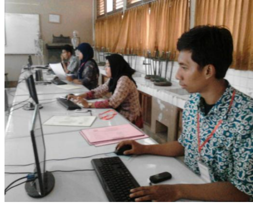
Entri Data PPDB