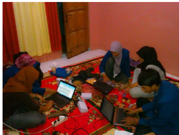
Rapat Rutin PPL