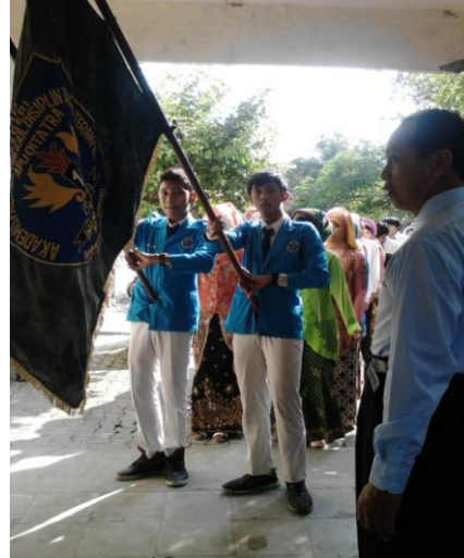
Pelepasan kelas IX SMP N 1 Minggir