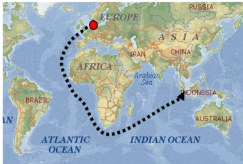
Gambar 1.35. Rute kedatangan bangsa Belanda ke Indonesia

Perhatikan peta rute kedatangan bangsa Belanda ke Indonesia di atas! Belanda adalah negara yang paling lama menjajah Indonesia. Selain Belanda, bangsa-bangsa Barat yang datang ke Indonesia pada masa penjajahan adalah Portugis, Spanyol, dan Inggris.