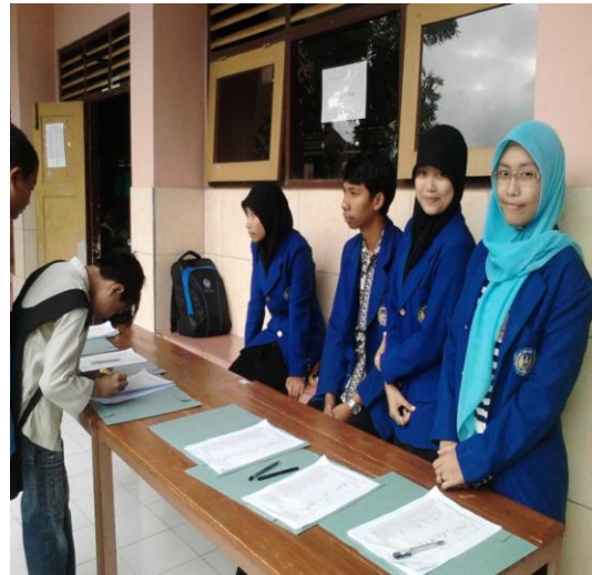
Mengawasi Presensi kehadiran siswa pesantren kilat