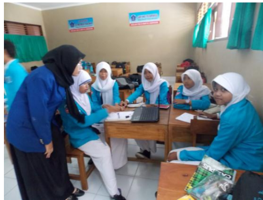
Mengajar kelas VIII G