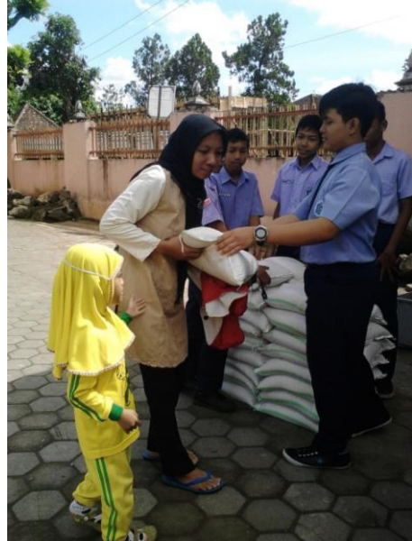
Pembagian zakat kepada orangtua siswa SMP N 1 Minggir