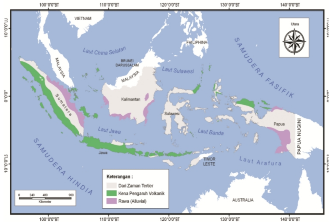
Gambar 2.10 Sebaran jenis tanah di Indonesia.

Indonesia mempunyai daratan seluas \pm 2 juta \text{km}^2 , dari luas tersebut tidak seluruhnya dapat diusahakan sebagai lahan pertanian, karena permukaannya berbeda-beda. Di satu sisi, kita sering mendengar bahwa Indonesia memiliki tanah yang subur. Benarkah? Seperti apakah tanah yang subur itu? Di daerah mana saja tanah yang subur itu di Indonesia dan berapa besar penyebarannya?