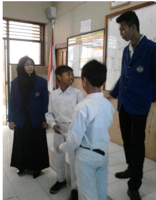
MPLS SMP N 1 Minggir