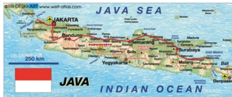
Gambar 1.38. Jalur Anyer-Panarukan

Mendengar istilah kerja paksa tentu kamu sudah dapat menebak, bahwa rakyat Indonesia bekerja tanpa fasilitas yang memadai. Mereka tidak memperoleh penghasilan yang layak, tidak diperhatikan asupan makanannya, dan melakukan pekerjaan di luar batas-batas kemanusiaan.