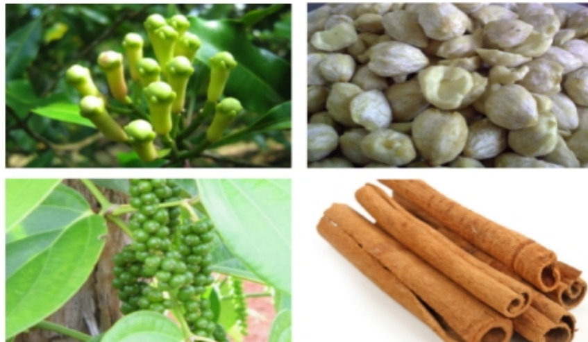
Gambar 1.33. cengkeh, kemiri, merica, dan kayu manis merupakan contoh hasil bumi Indonesia yang sangat dibutuhkan bangsa-bangsa barat

Berbagai komoditas perdagangan yang dihasilkan bangsa Indonesia itulah yang menjadi incaran bangsa-bangsa Barat. Berbagai hasil bumi Indonesia tidak hanya menjadi konsumsi bangsa-bangsa Asia, tetapi juga menjadi salah satu incaran bangsa-bangsa Barat. Mengapa bangsa-bangsa Barat sangat membutuhkan rempah-rempah? Indonesia dan bangsa-bangsa di Eropa memiliki perbedaan kondisi alam. Pengaruh lokasi telah memberikan perbedaan iklim dan kondisi tanah di Indonesia dan Eropa. Hal ini mengakibatkan hasil bumi yang diperoleh juga berbeda. Keberadaan musim hujan dan kemarau di Indonesia memungkinkan berbagai tanaman mudah tumbuh dan berkembang di Indonesia. Untuk tanaman kebutuhan sehari-hari dapat ditanam di setiap waktu. Hal ini berbeda dengan bangsa-bangsa Eropa yang memiliki empat musim yakni musim panas, musim dingin, musim semi, dan musim gugur.