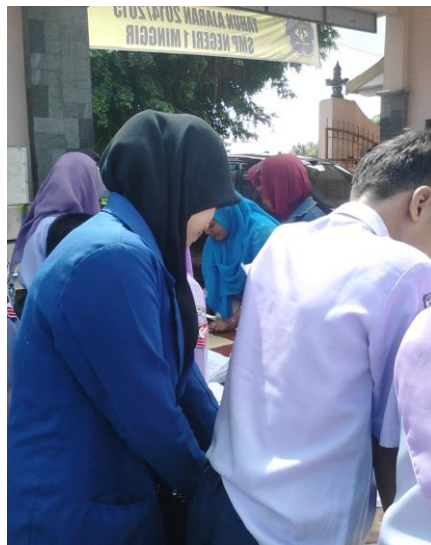
Pembagian zakat kepada orangtua siswa SMP N 1 Minggir