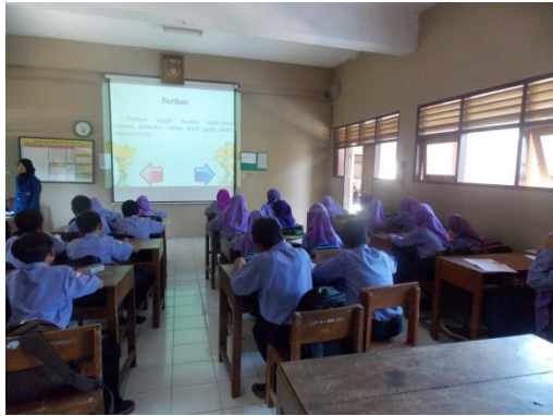
Mengajar kelas VII D