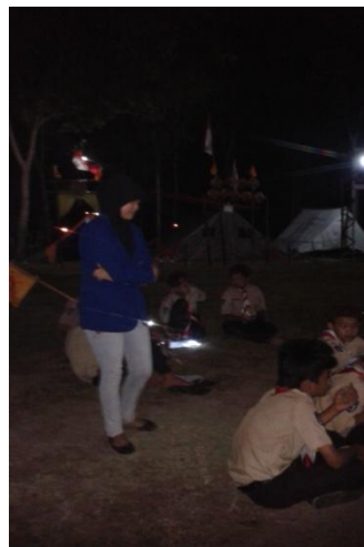
Kemah Terpadu SMP N 1 Minggir