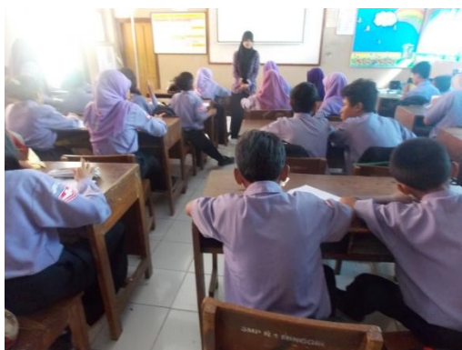
Mengajar kelas VIII B