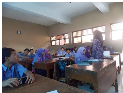
Mengajar kelas VIII A