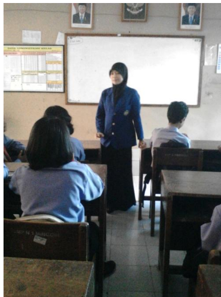
Mengajar Bahasa Jawa Kelas VIII A