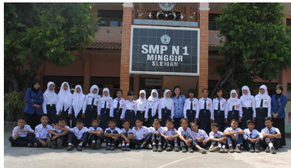
Kelas VII C