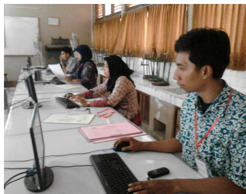
Entri Data PPDB