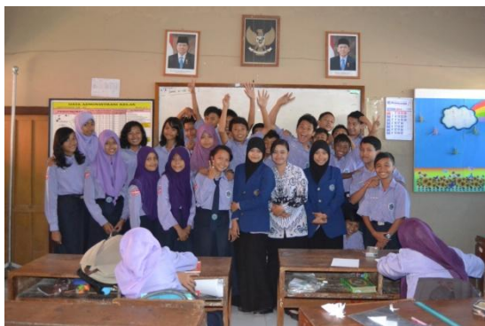
Kelas VIII A