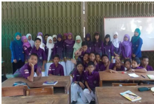
Kelas VII A