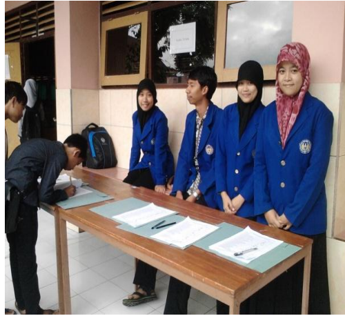
Mengawasi Presensi kehadiran siswa pesantren kilat