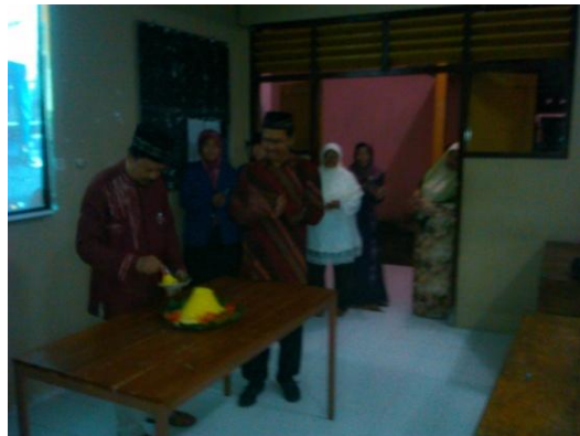
Acara peringatan HUT Sekolah dengan pemotongan tumpeng