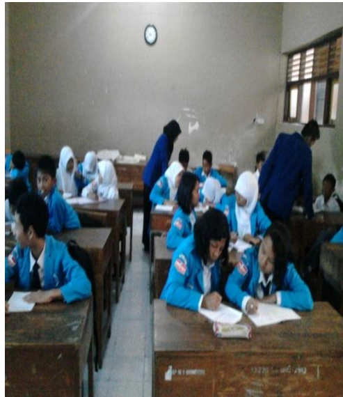
Pelaksanaan MPLS SMP N 1 Minggir