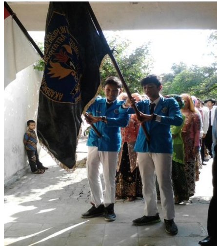
Pelepasan kelas IX SMP N 1 Minggir