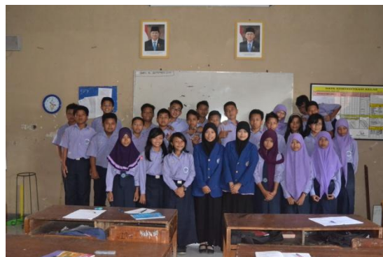
Kelas VIII B