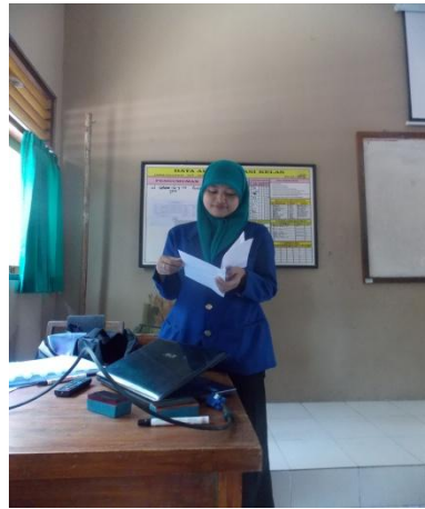
Mengajar kelas VII A