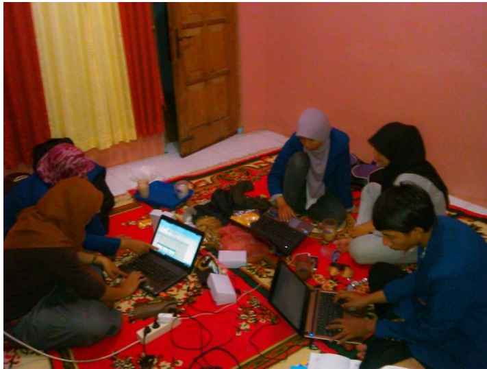
Rapat Rutin PPL