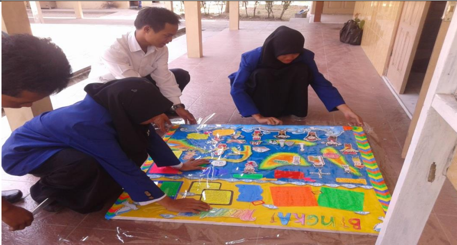
14. Tamanisasi toga