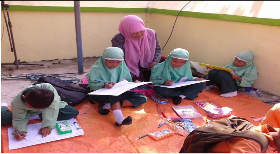
11. Mengajar aktivitas ritmik