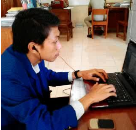
Gambar7. Penyusunan RPP