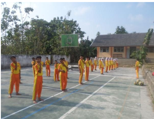
Gambar5. Siswa melakukan pemanasan