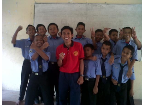
Gambar4. Pembelajaran di dalam ruang kelas