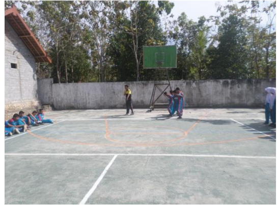
Gambar2. Model pembelajaran kooperatif