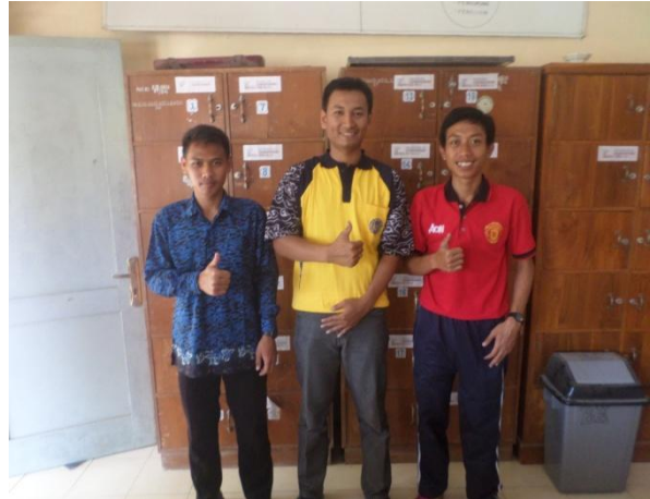
Gambar8. Bimbingan dengan DPL PPL Prodi PJKR