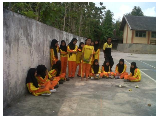
Gambar6. Evaluasi kegiatan pembelajaran