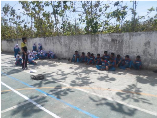
Gambar3. Evaluasi kegiatan pembelajaran