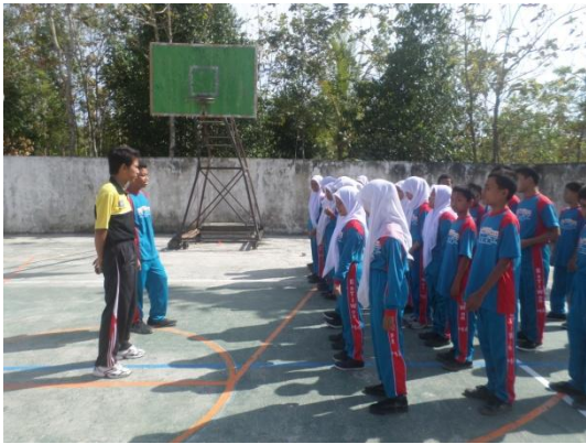
Gambar1. Salah satu siswa mengondisikan kelas