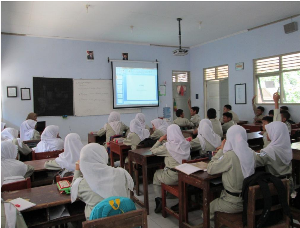
Salah satu media pembelajaran