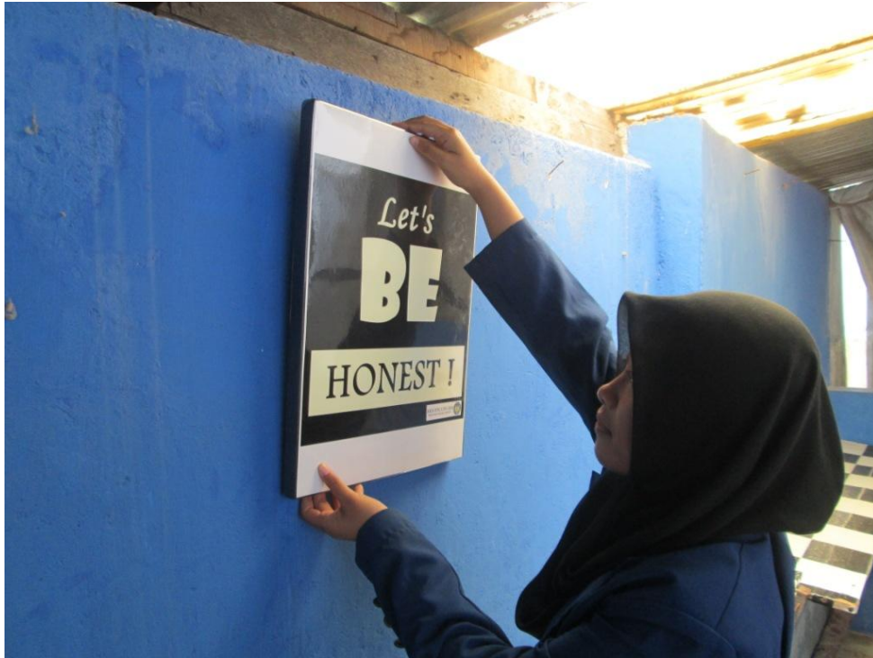
Hasil lomba majalah dinding