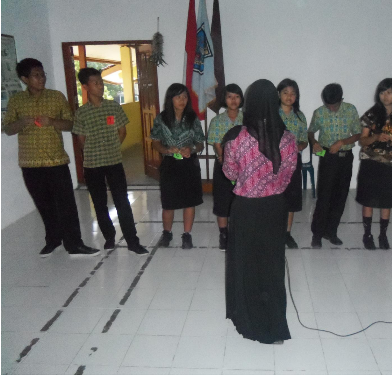
5. PENDAMPINGAN AUBADE