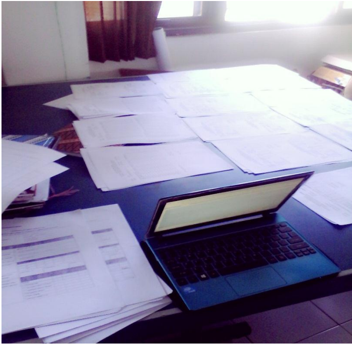
Gambar 2. Pembagian Form Penjaringan