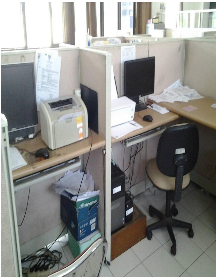
Gambar 4. Ruangan Kerja Pegawai