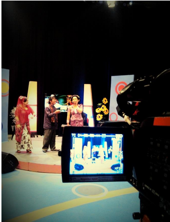
Gambar 3. Live Program Tembang Tembung