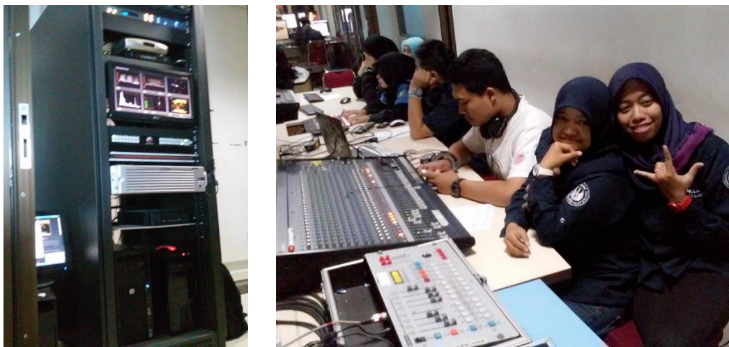
Gambar. 5 Suasana di Ruang MCR ADiTV.