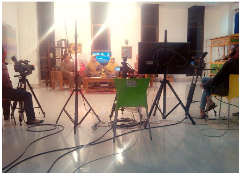
Gambar 4. Live Program Dialog Khusus PT. Arminareka