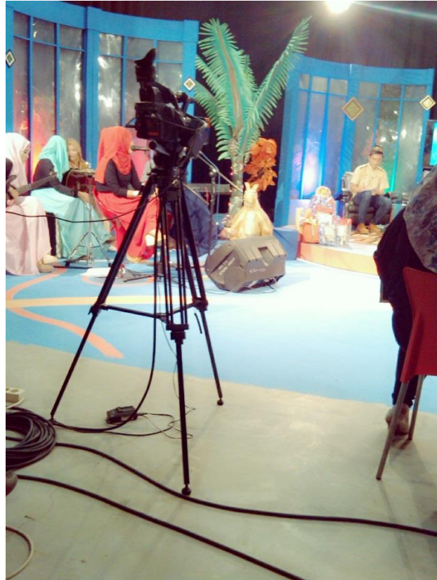
Gambar 4. Live Program Ramadhanku Di Jogja